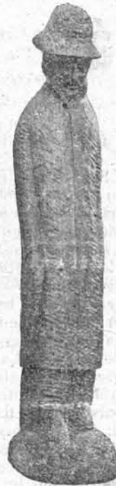
«Hombre con gabardina», talla de M. MORELL.

Como una granizada de cristal y color ha caído la exposición del Grupo Tago en la recogida sala de la Caja de Pensiones. Asombro y desconcierto en las gentes que desfilaron ante los cuadros y las esculturas. Y lo más eficaz: que se discutiera, apasionadamente, de arte, negando o afirmando.