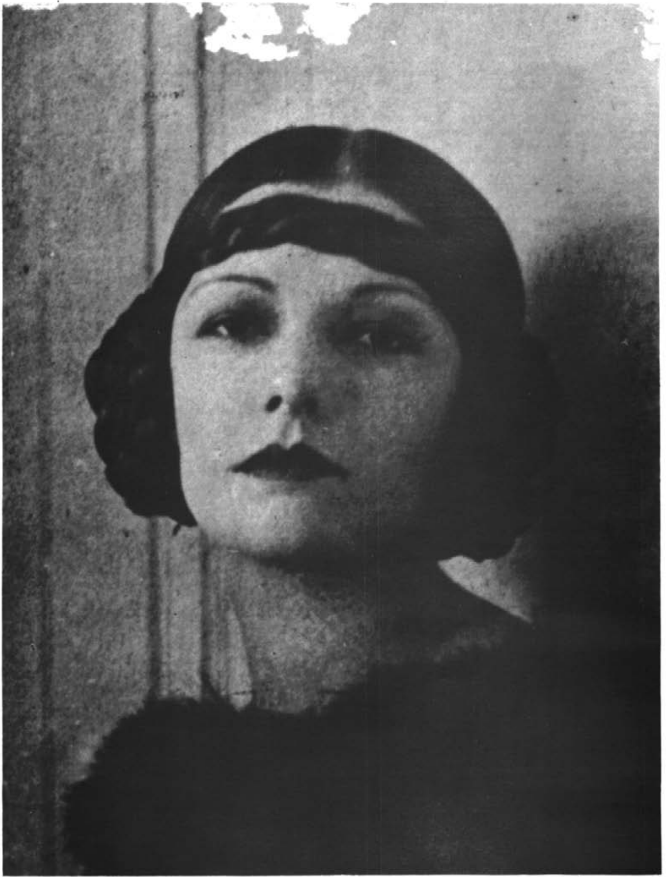
NATACHA RAMBOVA DE URZAIZ