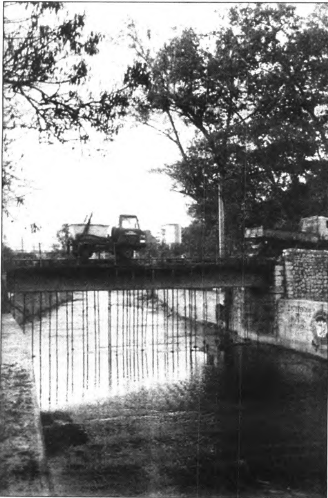
L'empresa que ha apuntalat el pont ha estat denunciada per l'Ajuntament als organismes competents.