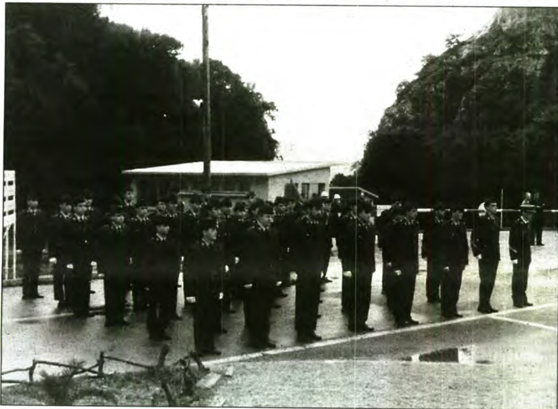
Fonts del Ministeri de Defensa asseguren que ha estat un error dels sistemes informàtics.

Segons les dades obrants a l'Ajuntament de Sóller, 34 dels 48 joves que l'any 1994 s'incorporaran a files faran el servei militar fora de les Illes Balears. Això suposa que, en el sorteig celebrat el passat 18 de novembre, el setanta per cent dels reclutes sollerics foren destinats a zones militars allunyades de la nostra.