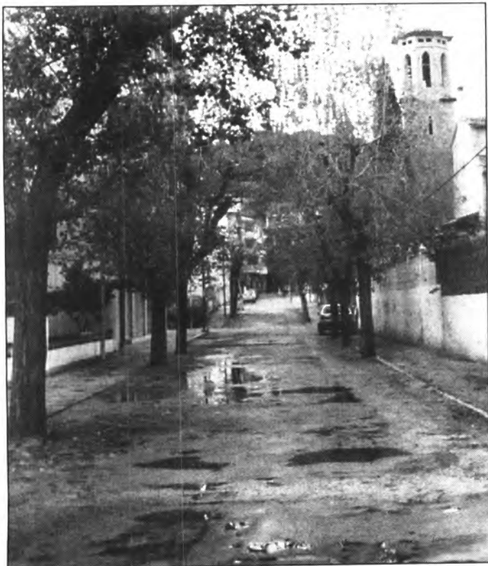
Com els altres carrers, el del Canonge Oliver veurà renovada la xarxa d'aigües brutes i també s'hi instal·larà una canonada per evacuar les aigües de pluja. La xarxa d'aigua potable d'aquest carrer, en canvi, no serà modificada.

Tots els carrers seran asfaltats de bell nou, i els arbres seran protegits per sengles garangolles.