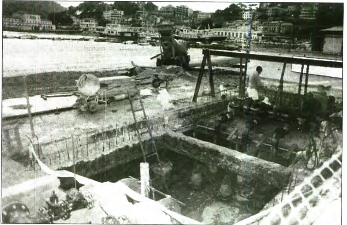
A més d'ampliar la potència dels motors, es refà la coberta de l'edificació.