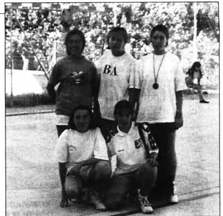
El grup de les més grans, actuals campions de les darreres Olimpíades Escolars.

Amb 19 inscripcions, dividits en tres grups, on cada un d'ells realitza dues sessions setmanals d'una hora. El lloc d'entrenament és el bar "Ses Pistes", aprofitam per agrair-lis la seva bona predisposició tant ara, com en el curset efectuat a l'estiu.