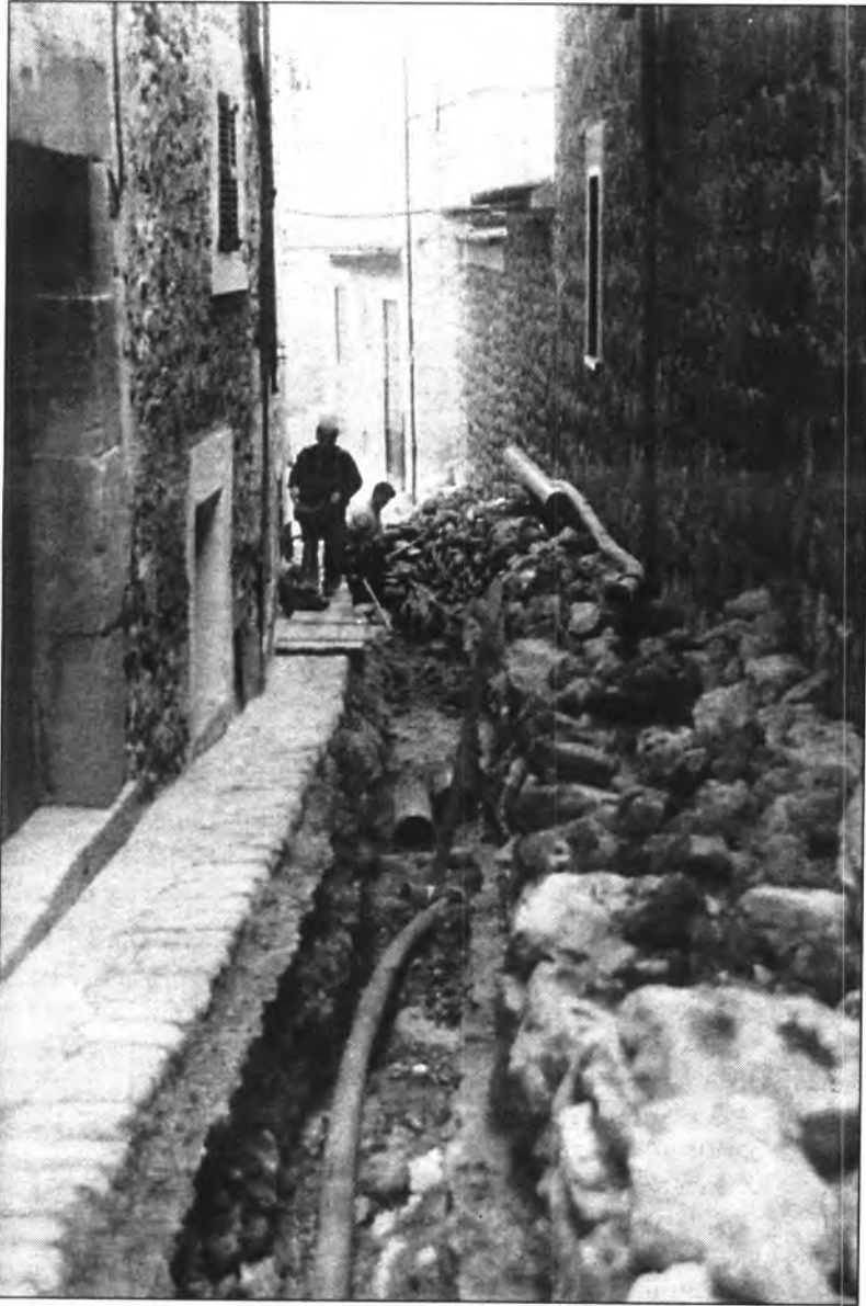
A cada un dels carrers que s'obren s'hi instal·la una canonada per a les aigües residuals, una altra per a les aigües de pluja i una tercera per a l'aigua potable.