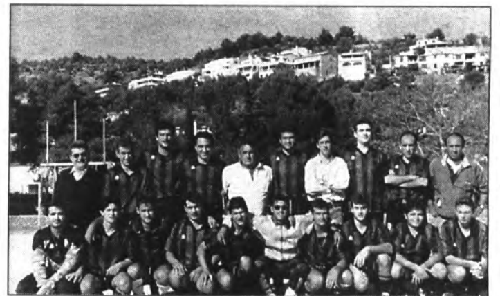
Formació actual del Trans Muntaner.