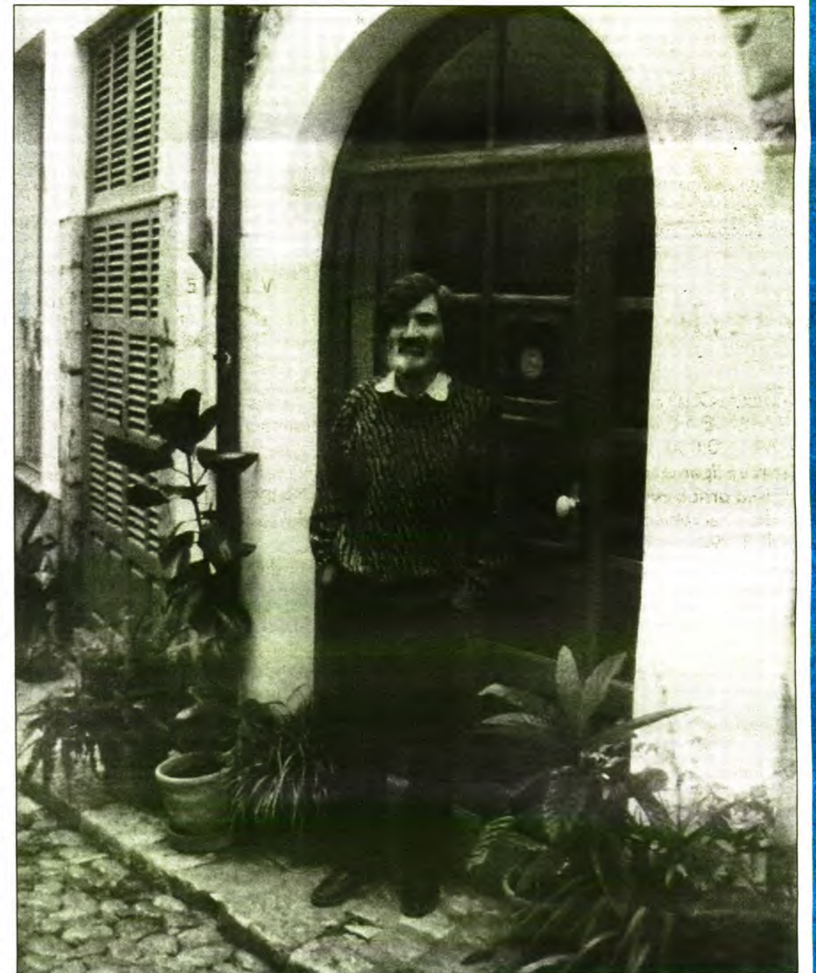
"Les escoles concertades i públiques de Sóller tenen un bon esplet de mestres que cal cuidar i potenciar".

J.- L'escola hauria de ser un espectacle, i de cada dia té un repte més difícil: fer-se atractiva. La societat de consum ens supera en encants i és impossible superar-la sense que els professionals tinguem espai, temps i mitjans necessaris.