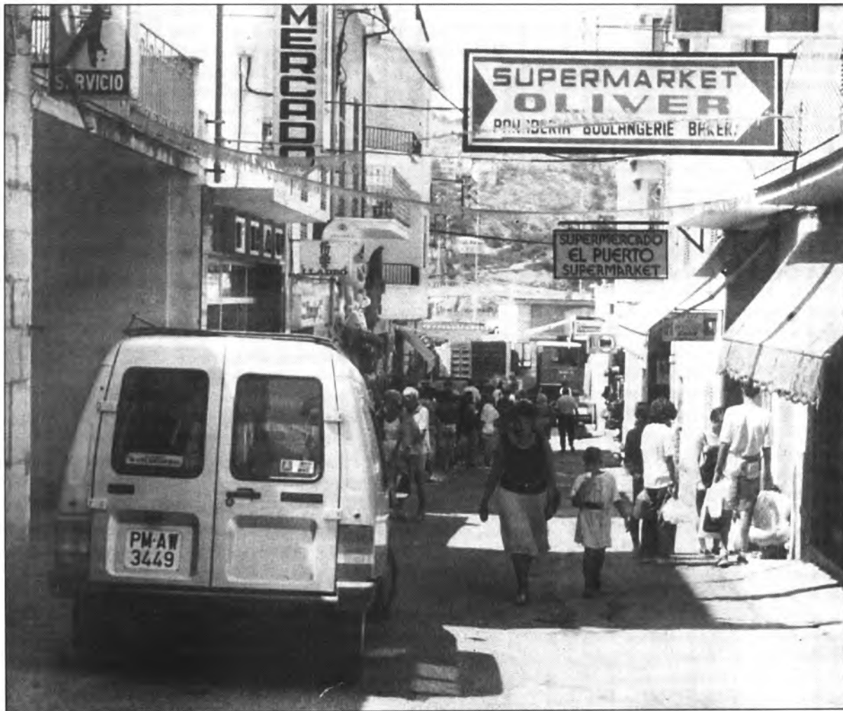
El carrer Jaume Torrens serà exclusivament peatonal. Per això serà empedrat amb pedra calcària abujardada, amb un doble dibuix longitudinal.

La setmana anterior se rebé a l'Ajuntament el "Projecte d'embelliment dels carrers del port de Sóller", que la comissió de Govern havia comanat als enginyers Manuel Palomo i Bartomeu Reus . El projecte empara la renovació de les infraestructures dels actuals carrers de Jaume Torrens , del Canonge Oliver , de l'Església , de Costa i Llobera i d'una part del carrer de Montis . Està prevista la renovació de la xarxa d'aigües residuals i la d'aigua potable, així com la dotació d'una nova xarxa de drenatge de les aigües pluvials. També es completarà la xarxa de l'enllumenat públic i es reposarà el paviment dels carrers i de les aceres. El pressupost d'execució del projecte és de 58.714.600 pessetes, i el termini fixat per a l'execució de les obres és de sis mesos.