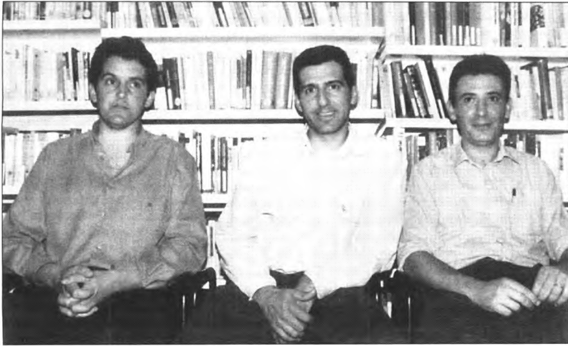
Els propietaris han iniciat la contabilització dels arbres, marges i canalitzacions d'aigua, amb la finalitat de no sortir perjudicats a l'hora de l'expropiació.