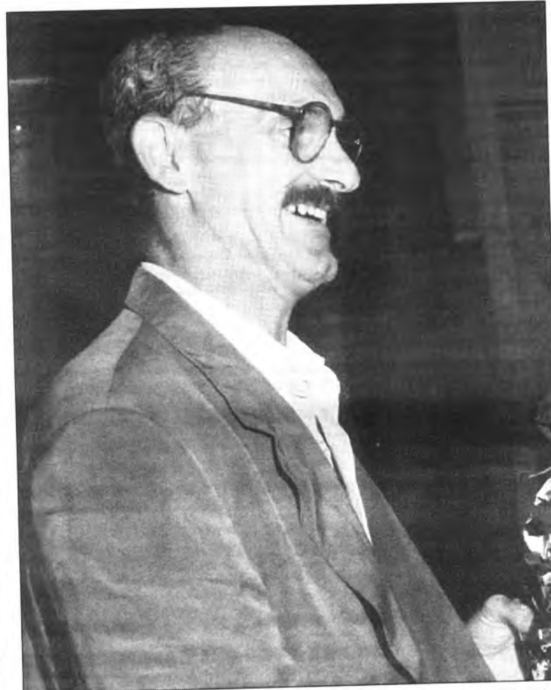
A pesar de no haver pogut passar a la final, per 9 centèsimes, el velocista solleric es trobava satisfet. Ens parlà ja de la nova cita a Buffalo (EE.UU.).