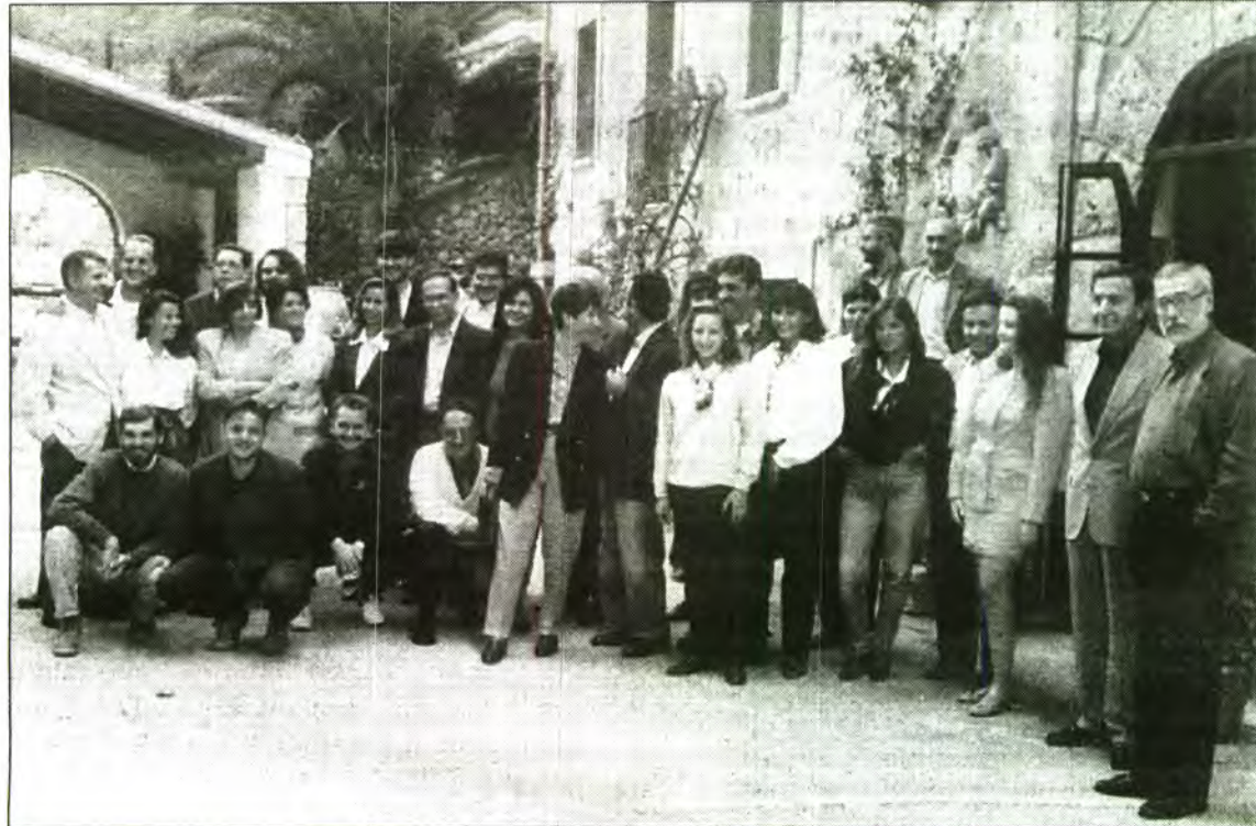
Una bella mostra dels poetes que varen assistir a aquesta diada.