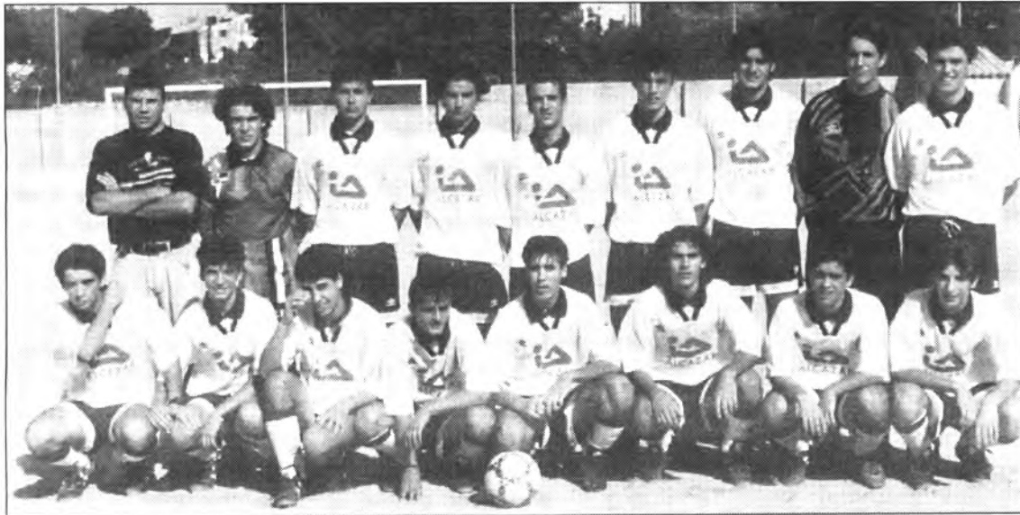
Els juvenils ja reaccionen.

Diumenge, a les 10-30' amb la visita del Gènova esperam gaudir d'un bon espectacle.