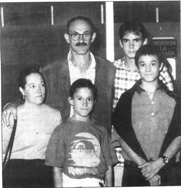
Família esportista, família feliç. Tots recolçaren i animaren a l'ex-Campió a la seva arribada a l'aeroport, a la que la premsa local hi fou present.

"Als 100 metres hi participaren 164 atletes, i a la maratón més de 8.000 persones. A més el nivell dels participants era molt alt."