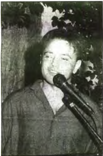
En Salvador creu que Mallorca té prou sensibilitat i història per donar-la a conèixer a la gent que ve de fora, per això va aprofitar el marc de la finca de ca n'Aí per fer una diada poètica plena de sensibilitat.

foren un exemple a seguir dins un món on el materialisme i les coses caduques marquen el ritme i el valor de les coses viscudes. Un acte com aquest, pensat i organitzat per un grup d'amics, sense cap tipus de recolzament institucional fa pensar que el poble, a hores d'ara, encara té inquietuds i necessitats i les manifesta, amb festa, per festejar les coses senzilles que una paraula d'home, dita amb fe, pot arribar a fer.