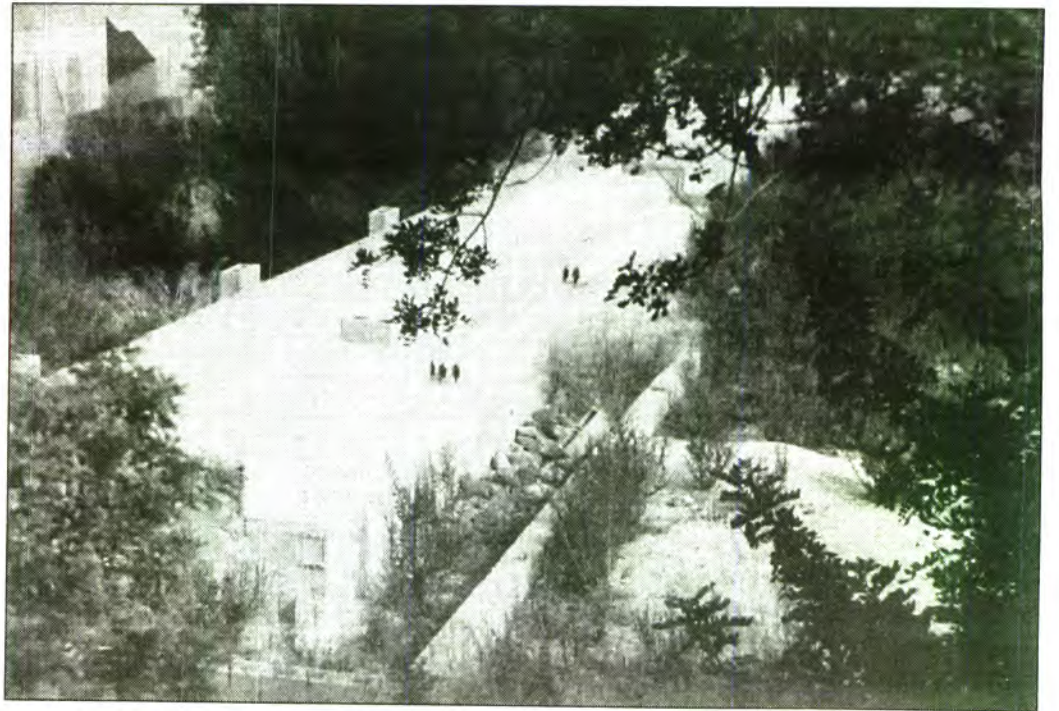
L'Ajuntament hagués pogut arreglar mínimament la pista poliesportiva descoberta d'Es Puig si no hagués deixat perdre aquesta oportunitat.