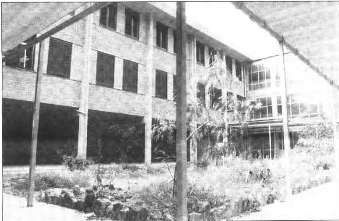
La credibilitat del sondeig del Partit Popular sobre els resultats dels alumnes de l'Institut està en entredit.

Deixant de banda la forma de l'article, passem al contingut. Els senyors i senyores que signen la carta diuen que els resultats de COU i de selectivitat del curs 92/93 a l'Institut de Batxillerat Guillem Colom Casanovas no han estat exitosos. No conec aquests resultats i no dubt que la informació que vostès tenen sigui correcta. Però del que sí estic segur és de la irresponsabilitat, de la frivolitat i del poc rigor amb què n'han analitzat les causes. Les úniques dades que vostès presenten són els resultats d'un "sondeig" entre alumnes de COU, sondeig que sembla més aviat una conversació de bar o de perruqueria. Em veig amb l'obligació de recordar-los que la ciència Estadística té unes normes, i els sondejos i les enquestes s'han de fer a partir d'unes mostres que han de complir una sèrie de condicions per tal que els resultats siguin fiables. Sospit que vostès no