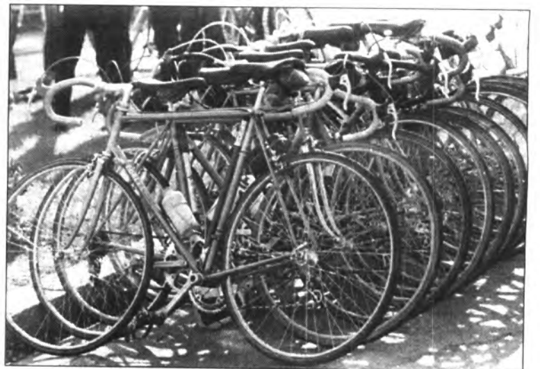
Ens proporciona un transport ràpid, no contaminant, barat i autosuficient.

En contrapartida han començat a sorgir grups urbans, autèntics moviments de defensa i difusió de la bicicleta, netament diferenciats dels que fomenten el ciclisme com a mera pràctica esportiva, que promouen el seu ús i la seva recuperació, i així redueixen la utilització indiscriminada del cotxe. Reivindiquen davant els organismes públics competents la infraestructura adequada per a la bicicleta: els aparcaments, els carrils bici, els creuers especials, l'ordenació del trànsit, la combinació amb el transport públic, la millora i manteniment de les voreres de les carreteres, les alternatives segures i ade-