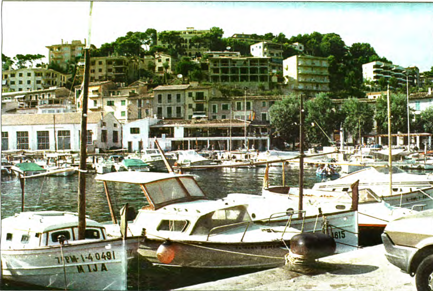
El Port serà una de les zones més afectades per la suspensió de llicències acordada per l'Ajuntament.