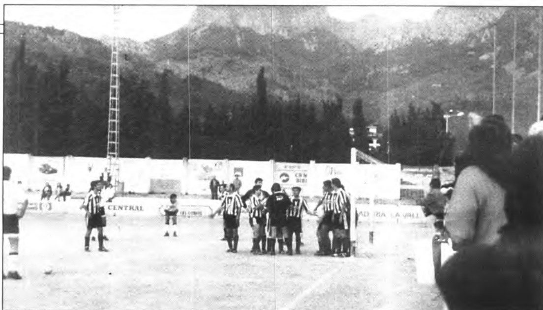
Instantània del minut 87. Falta no aprofitada dins l'àrea petita.

Diümenge capvespre passat ens visità l'Alaior en el camp d'en Maiol. L'equip aquesta temporada no va molt entonat, ningú s'ima-