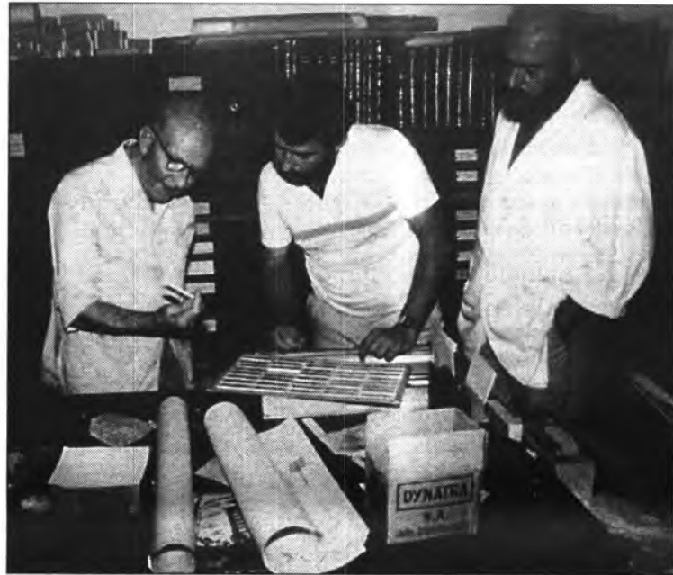
Foren molts els moments, com aquest, que compartiren estudiant i treballant.

No menys important va ser l'aportació de Colom al desenvolupament de la micropaleontologia nacional i iberoamericana, estant considerat com a l'introduïdor d'aquesta ciència a Espanya. En aquest camp, s'ha de destacar la seva participació en les prospeccions petrolife-