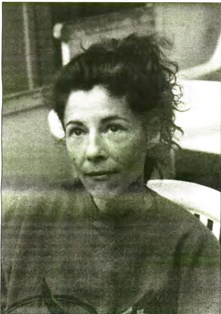
Les finques de la nostra vall són presents, sens dubte, entre els millors productes que, avui per avui, es poden oferir als turistes que demanen un altre tipus de vacances i estada entre nosaltres. Can Coll, és una bona mostra.

Avui s'està vivint una lenta però incipient revolució dins els esquemes del turisme de sempre. Qui més qui manco ha sentit parlar de l'agroturisme i el que pot