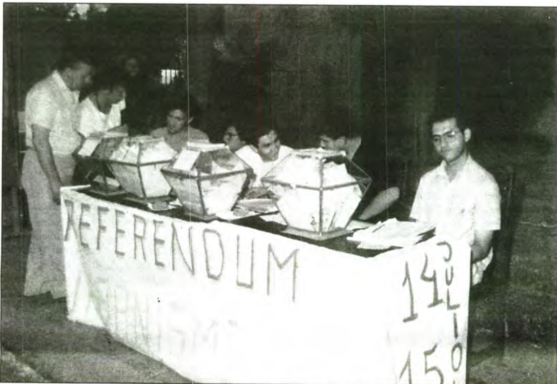
La Coordinadora de Joves organitzà l'any 1990 el Referéndum sobre la Pressió Urbanística, una de les actuacions que tengueren més transcendència de totes les que ha celebrat.

nització del debat sobre política abans de les darreres eleccions municipals, la CJC va cobrar prestigi i seriositat dins Sóller, però l'escassa renovació dels seus components ha estat un factor determinant en la seva decadència i final desaparició que ja s'intuïa des de feia algun temps.