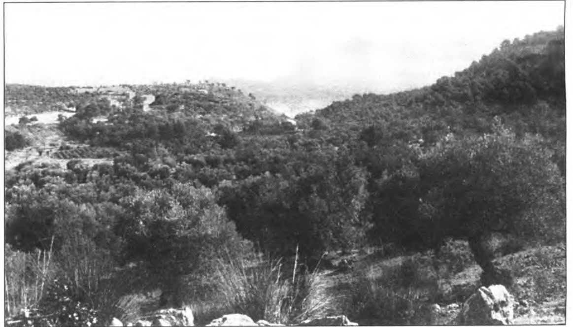
L'ADV d'Olivicultura té com a objectiu la millora de les tècniques de cultiu i de la qualitat de l'oliva.