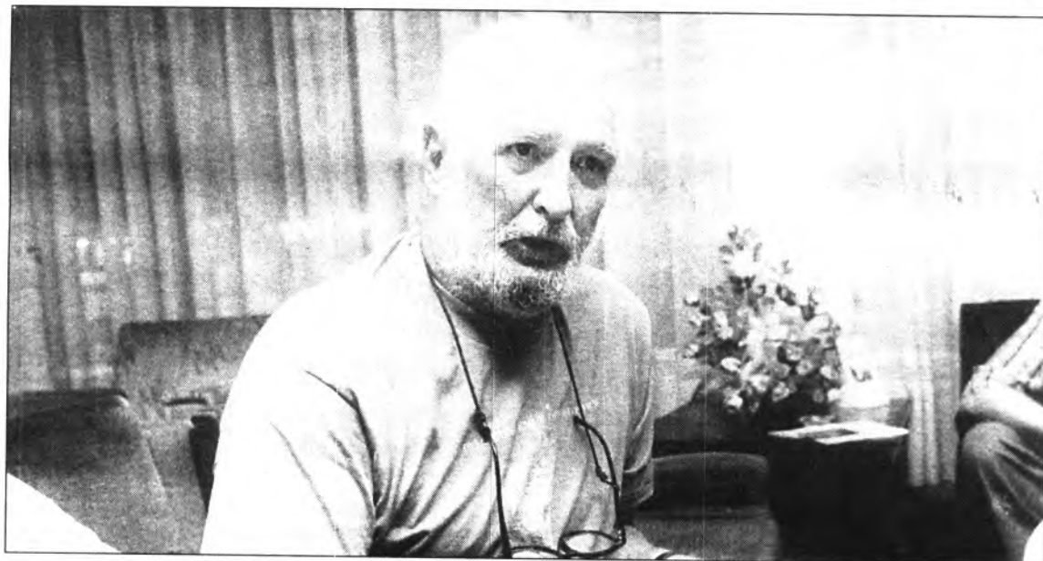
Els grups de treball feren reunions a Sóller i a Deià, en el marc d'unes jornades interdisciplinars que han aportat nous horitzons en l'estudi de les Taules de Menorca o dels enterraments del Post-Talaiòtic.