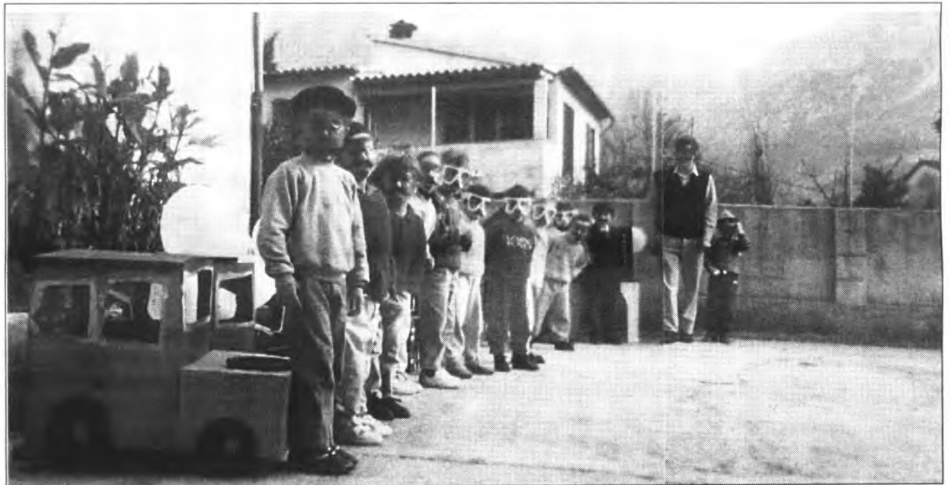
"Les petites escoles per sota 6 classes són encara com una vileta simpàtica, on la gent es pot conèixer i viure en funció els uns dels altres, on els mestres poden simpatitzar, discutir ells amb ells, i seguir tots els alumnes". (Célestin Freinet)

El Ministeri d'Educació i Ciència posava en marxa, a inicis dels anys 70, la nova Llei General d'Educació. Neixia l'EGB, Ensenyament General Bàsic, i es suprimia l'antiga Primària. Tot d'una després, el MEC construïa i posava en marxa les concentracions escolars, els col·legis comarcals, agrupant els alumnes de les escoles petites en centres majors. En fou un exemple a Sóller el Col·legi Es Puig. I també, tot d'una després, alguns professionals de l'ensenyament, entre ells i el primer el qui signa l'article, ens posàrem en campanya per defensar que els pobles petits i les barriades conservassin la seva escola, al manco per a aquells infants de menor edat. En són exemple a la comarca la continuïtat de Deià, Fossaret, L'Horta, Marjades i Port.