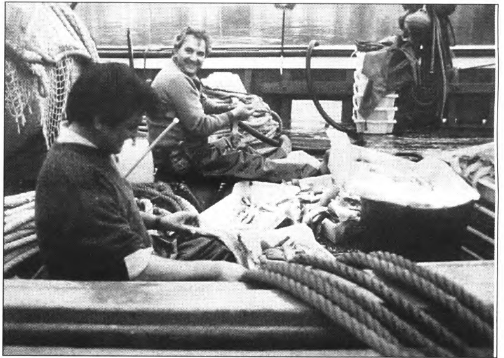
Els pescadors han estat els més perjudicats pel mal temps atmosfèric.