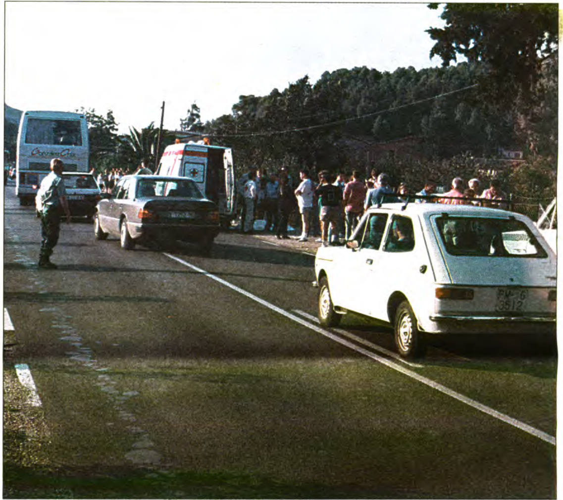
L'accident mortal es produí just passat el Monument de l'Horta.

Al lloc del succeït hi acudiren la Guàrdia Civil, el metge i l'ATS de guàrdia, la Policia Local i la Creu Roja.