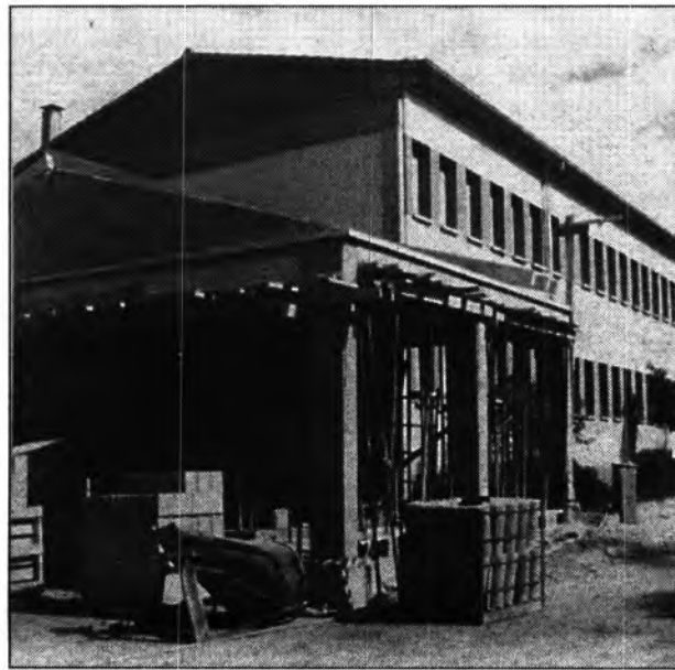
El Puig, una escola pública de Primària afectada pel correlli que haurà de fer un dels seus tutors.

Treure tutors de la seva aula per impartir anglès a altres classes o col·legis ha estat una impopular mesura entre els mestres, i, a la curta, pot ser negatiu per als bons resultats educatius de l'alumne. La imatge no és més important que la qualitat i la qualitat en Primària vol que els professors d'Educació Física, Anglès i Música no tinguin al seu càrrec tutoria, la seva iti-