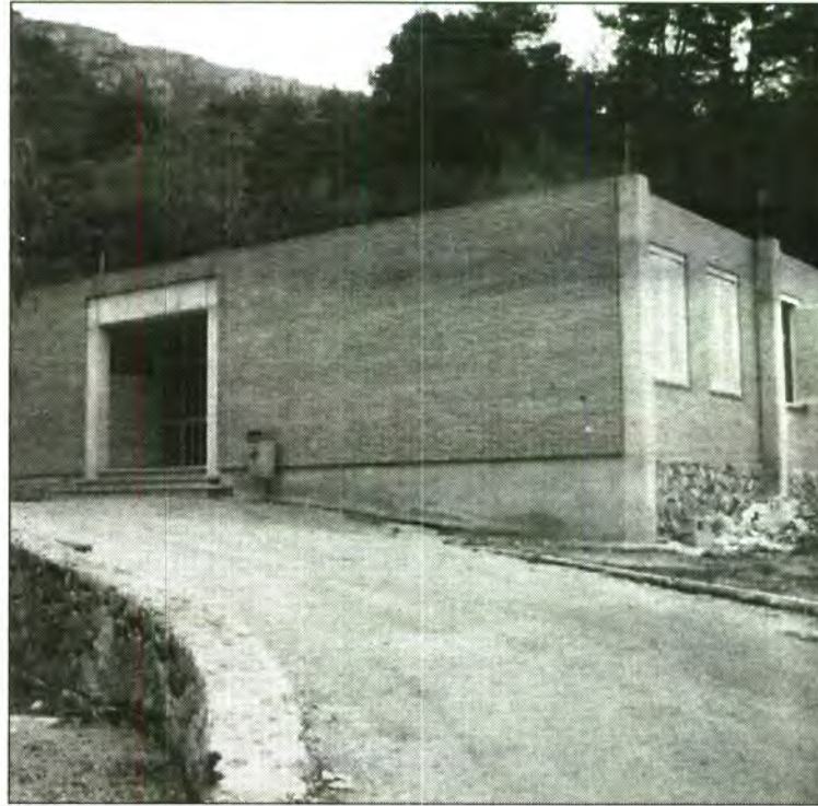
La capa impermeable del segon cos d'edifici de l'Institut ha acabat el període de garantia.

A més d'això, els problemes del Centre a l'inici de les classes són múltiples: l'edifici conegut com "el xalet" no disposa de teulada , ja que, en principi es tenia pensat fer-hi una altra planta i a l'espera de finalitzar l'obra es protegí el sostre amb una capa d'impermeabilitat que tenia una garantia de deu anys, i