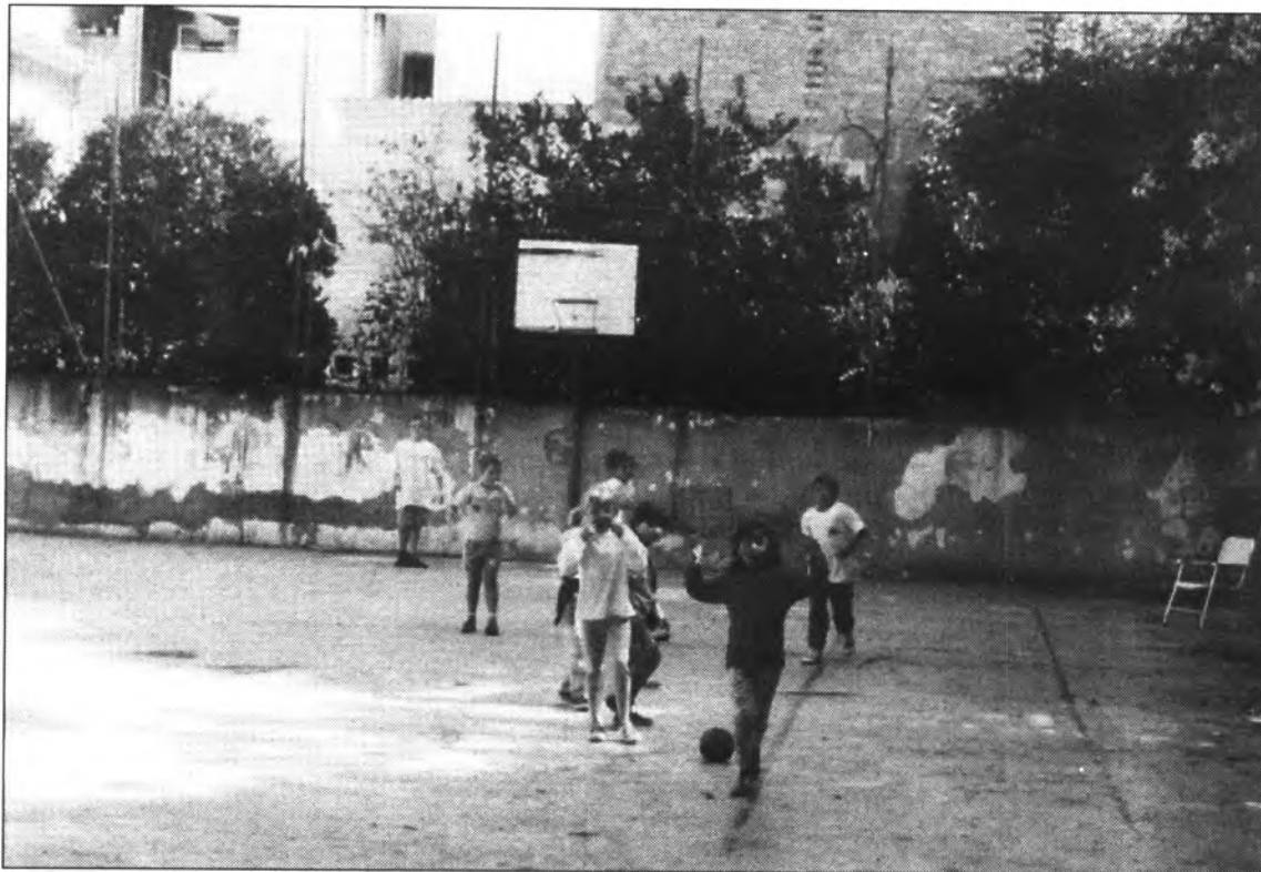
Les sales que eren utilitzades pels grups parroquials s'han transformat en aules.