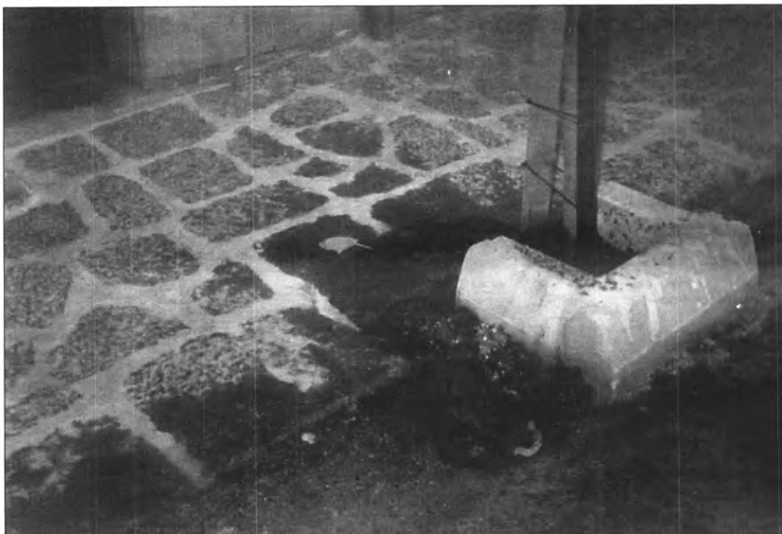
Aquest és el resultat de donar dita mescla a l'arbre.