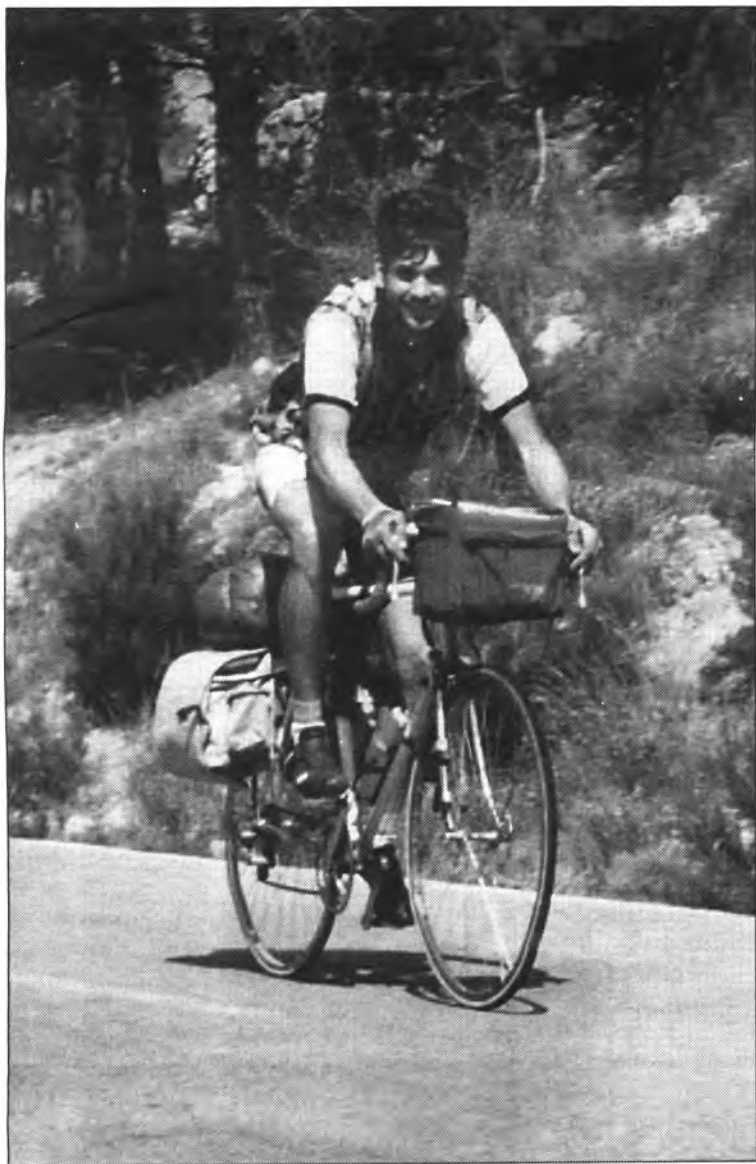
L'autèntic cicloturista és aquell que gaudeix de la Natura, aquell que sap apreciar un paisatge, el cant dels ocells...

tual la imatge de les parelles amb els seus fills, que comparteixen les emocions d'una passejada amb bicicleta.