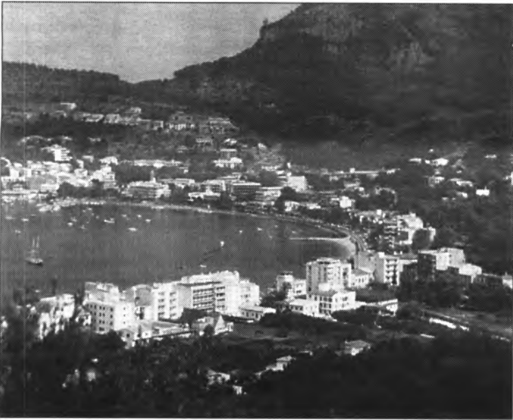
L'oposició creu que la Comissió Insular d'Urbanisme podria trobar irregularitats a l'expedient i paraitzar-se els tràmits que porten a la construcció del vial a la Platja d'en Repic.

Dins els tràmits necessaris per a la construcció del vial a la segona línia de la Platja d'en Repic, la setmana anterior el consistori va aprovar inicialment una modificació del PGOU que permet fer-la ja que en l'actualitat la qualificació dels terrenys de la zona no ho possibilita. Mancarà encara un termini d'exposició pública, des de la discussió de les possibles al·legacions i d'aprovació definitiva per part de la Comissió Insular d'Urbanisme abans que l'obra es pugui executar.