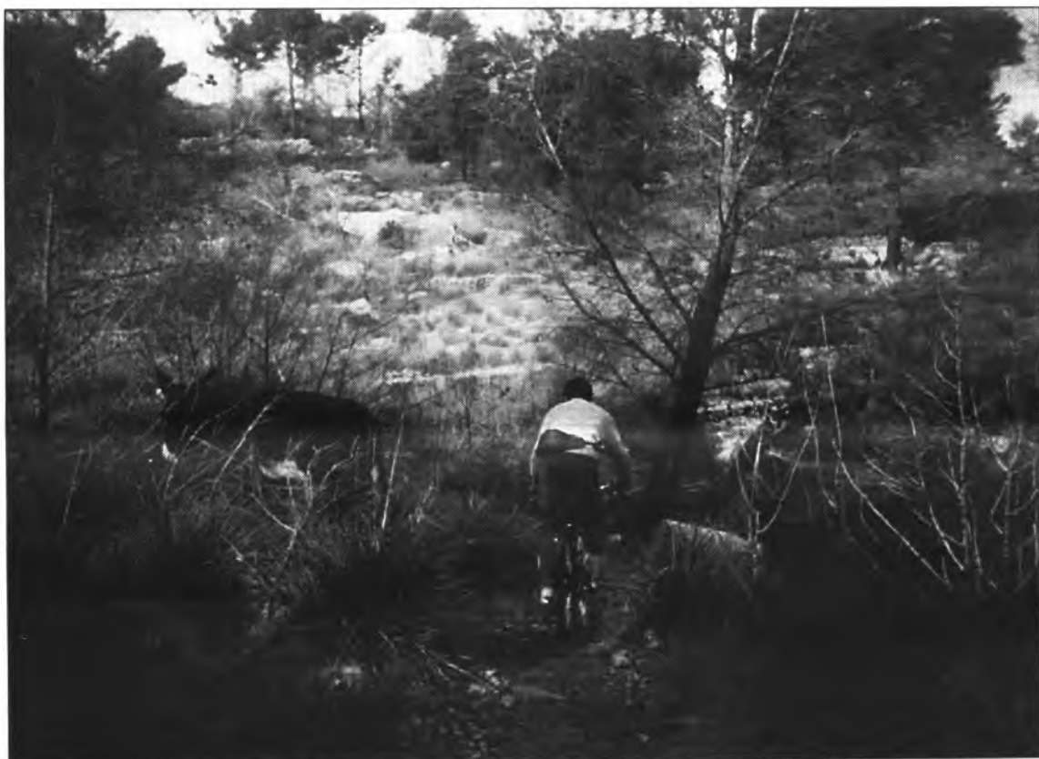
El cicloturisme és sinònim de plaer, independència i llibertat.

Desgraciadament, el problema de l'esport competitiu d'èlite radica en el terrible cinisme d'aquesta societat de consum que l'ha convertit en un