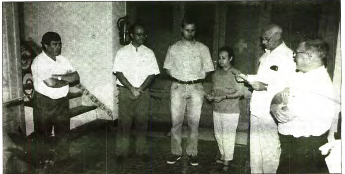
Bona part de les entrades de la Creu Roja provenen de donacions com aquesta, realitzada arran d'un concert benèfic.

caçar a menys de 100 metres d'un nucli urbà, a menys de 50 metres de carretera, caçar des de vehicles o embarcacions, amb llanternes, trampes, utilització de xerxes verticals... en aquest apartat no s'inclouen les xerxes de caçar tords, sempre que es tenguí el corresponent precinte donat per la Conselleria.