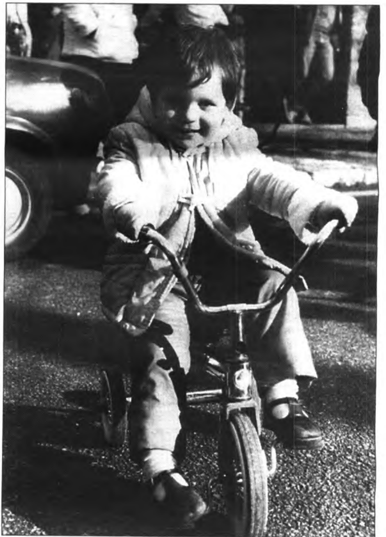
La bicicleta, vehicle alternatiu i mitjà d'emancipació per a totes les edats.

El cicloturisme, més que un esport, és un cert estil, una certa concepció i una certa filosofia de la vida. Es una combinació indivisible entre home i màquina. Es sinònim de lli-