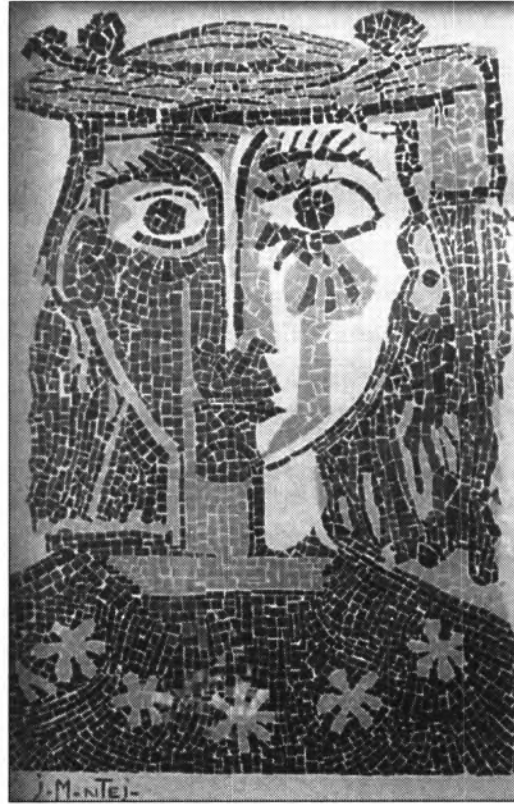
Jesús Montejo extindrà la seva sabiduria pictòrica al camp del mosaic.