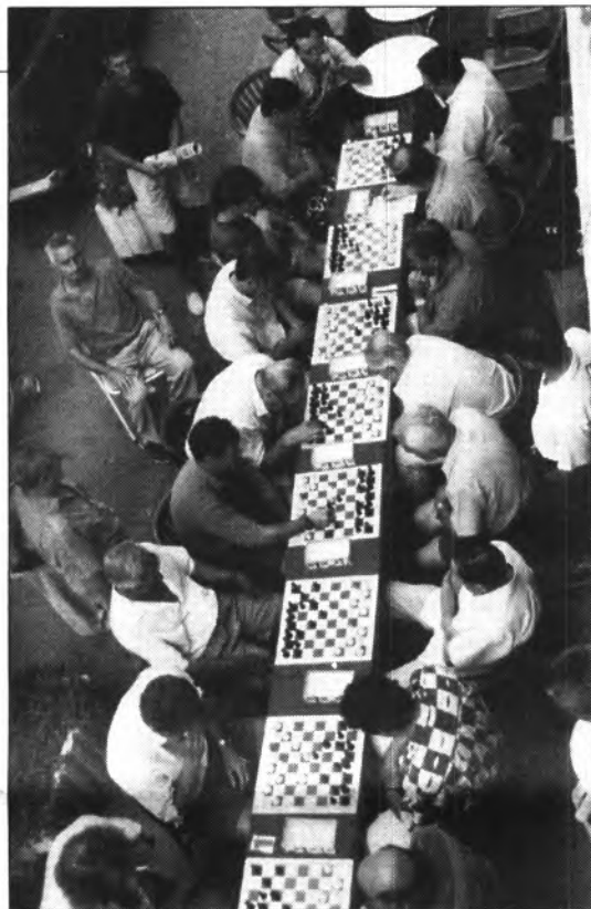
La confrontació, que durà prop de dues hores, fou molt renyida interessant.