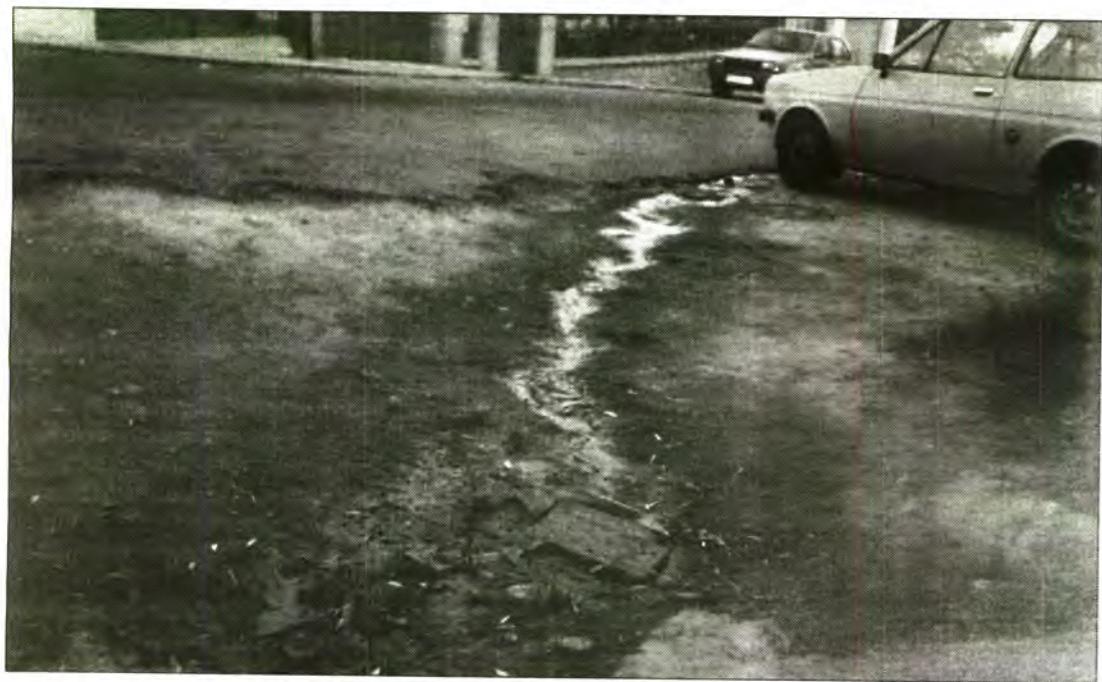
L'olor que desprén aquest suc procedent d'una mina d'aigües brutes és insuportable.