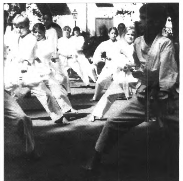
Interessant exhibició de karate el diumenge el mati a la Plaça de la Constitució a càrrec del Club Karate Sóller, que fou seguida per bastant de públic.