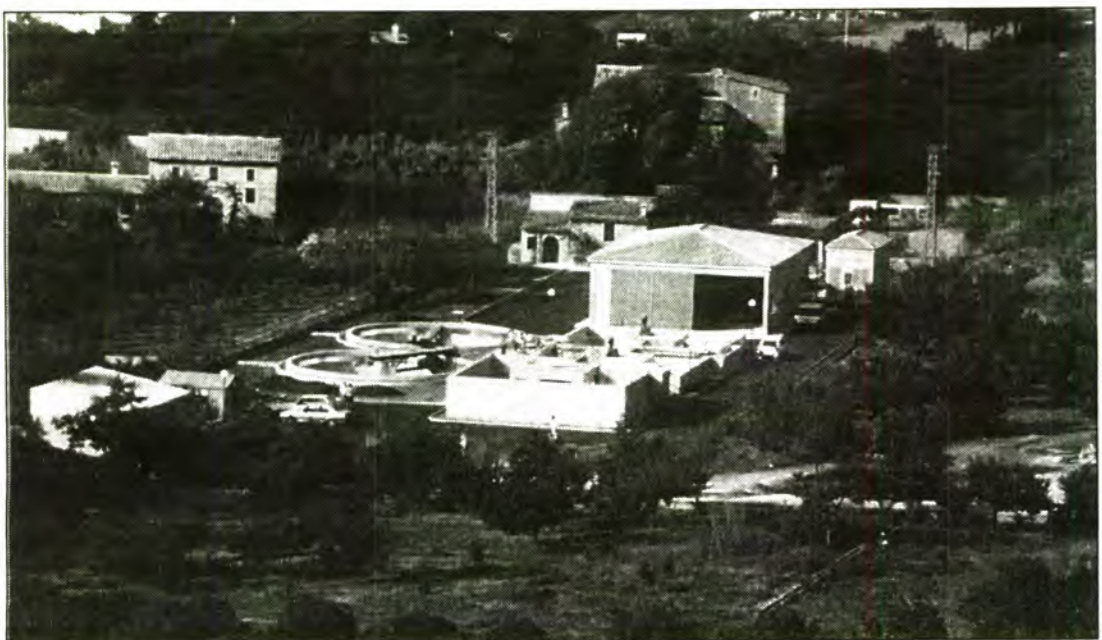
La depuradora entrà en servici l'any passat i ja recull les aigües brutes de Biniraix i de Fornalutx.

la zona, la presència d'aquest focus d'infecció ha estat denunciada fa més de dos mesos a les Cases de la Vila, però fins ara no han obtingut cap resposta a la denúncia. Sempre segons les mateixes fonts, la pudor que es desprén és insuportable, sobretot ara que la calor empeny de valent.