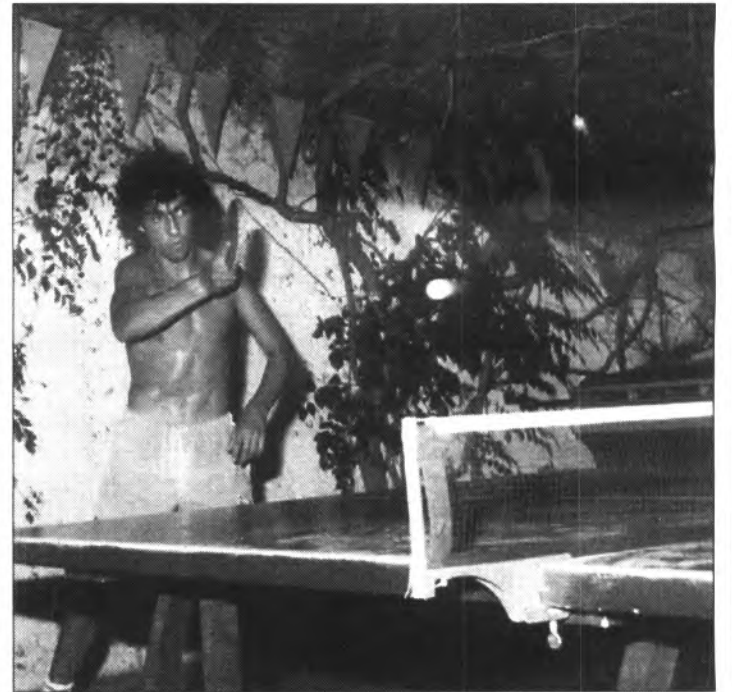
El pilot motociclista donà de nou una nova exhibició al Torneig del Bar Vicente.