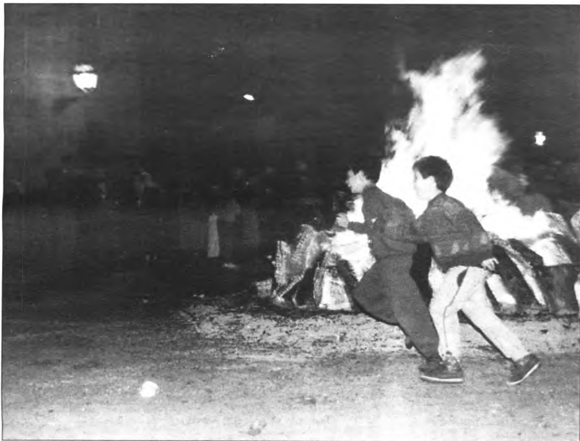
10 entitats sollerics organitzen el foc de Sant Joan i la pujada al cim.