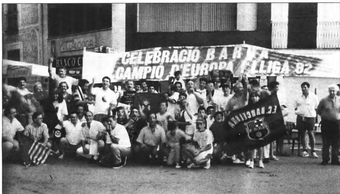
Ambient i emoció al màxim. Els barcelonistes a "tope". Gràcies al Tenerife es repetí la història per segona vegada.