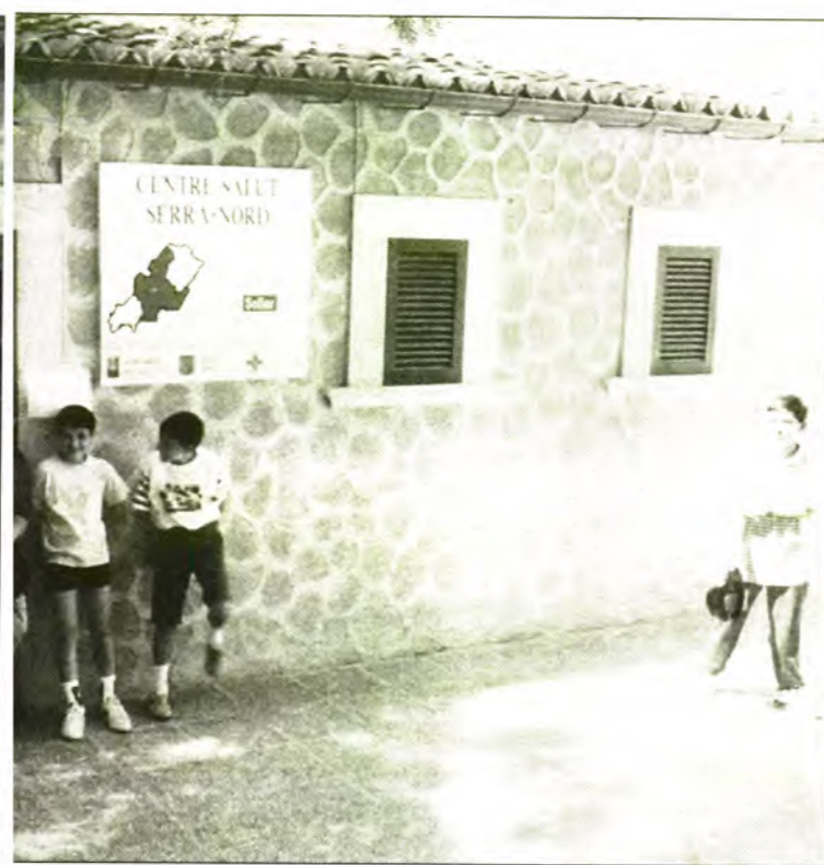
El Centre de Salut "Serra Nord" a l'estat equipat pel Govern Balear. Ara l'INSALUD el posa en funcionament i n'assumeix les despeses.

El manteniment i el personal administratiu ja són de l'INSALUD