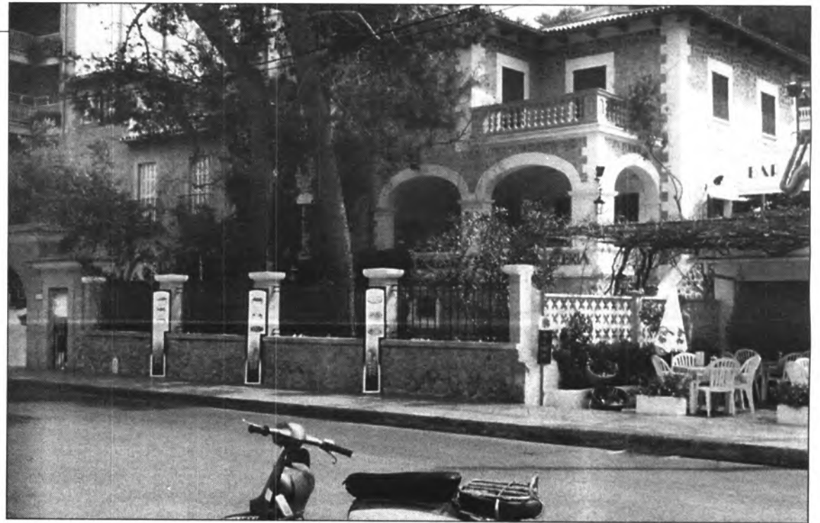
La façana de Randemar té poca "randa" de local agressiu, lleig i poc respectuós amb l'entorn. Un clar exemple del que hauria de ser una primera línia per a embellir la imatge donada als turistes.

Seria impossible poder nomenar la qualitat i quantitat de plats que és imperdonable no tastar, per la qual cosa, anar a Randemar (que està oberta a tothom, doncs els preus són també per a tothom.), i gaudir d'unes fines pastes, unes fresques carns o un bon peix i tot