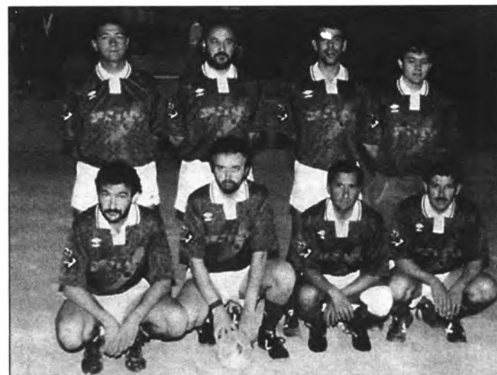
Es comencen a clarificar les primeres posicions. Els col·legues de l'Esportiu capdavanter del Grup B.