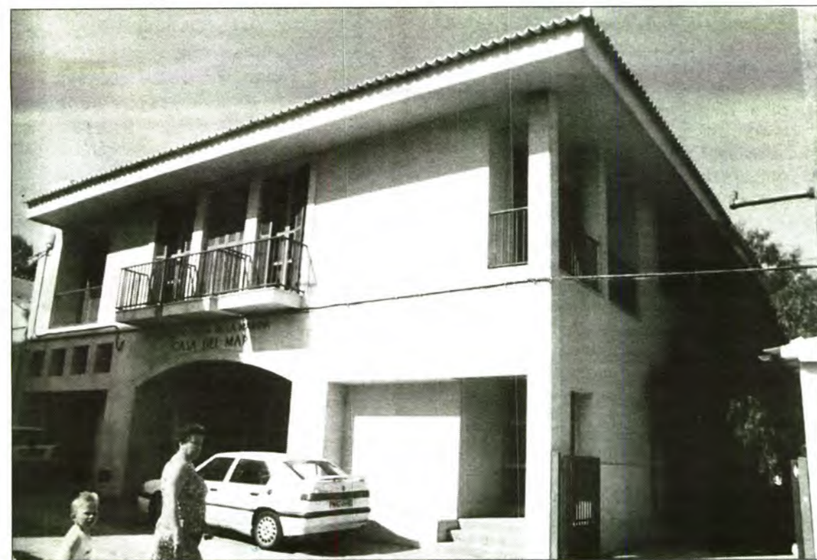
Els beneficiaris de la Seguretat Social del Port disposaran d'un metge permanent a partir del mes de juliol, que passarà consulta a la Casa del Mar.