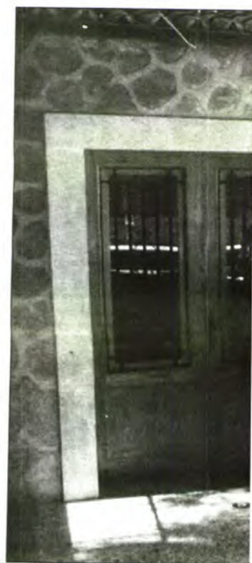
El Centre de Salut "Serra Nord" a l'estat equipat pel Govern Balear. Ara l'INSALUD el posa en funcionament i n'assumeix les despeses.

Com a conseqüència de la incorporació dels metges de Fornalutx i de Deià, s'haurà de procedir a la modificació de la quota de cartilles assignades a cada un d'ells. Per aquest motiu, alguns dels beneficiaris de la Seguretat Social sofriran un canvi del metge de capçalera que han tengut assignat fins ara.