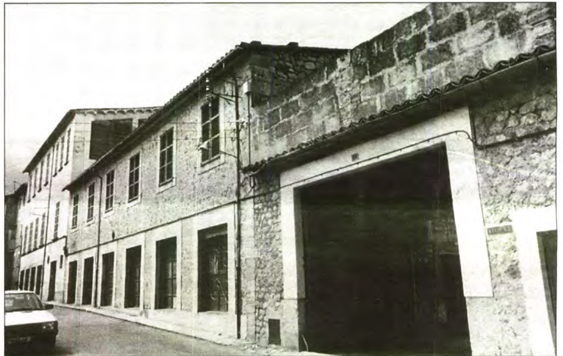
El Fons de Garantia Salarial, els treballadors i una entitat bancària recuperaran deutes amb la venda de l'immoble.