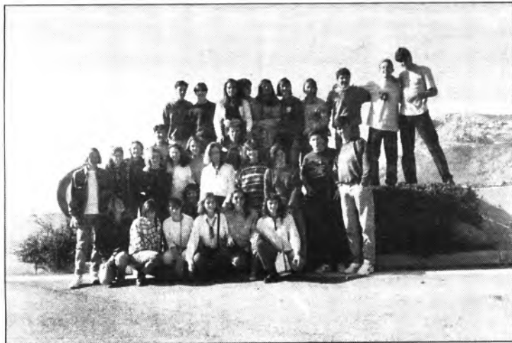
Els alumnes de tercer de BUP, els quals han recorregut cinc països europeus en el seu viatge d'estudis.