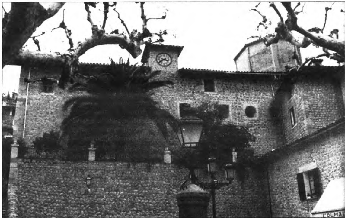
Fornalutx destinarà el 6,5 % del pressupost d'enguany al servei d'ajuda a domicili i d'atenció al minusvàlid.

Per transferències extraordinàries de la Comunitat Autònoma: set milions.