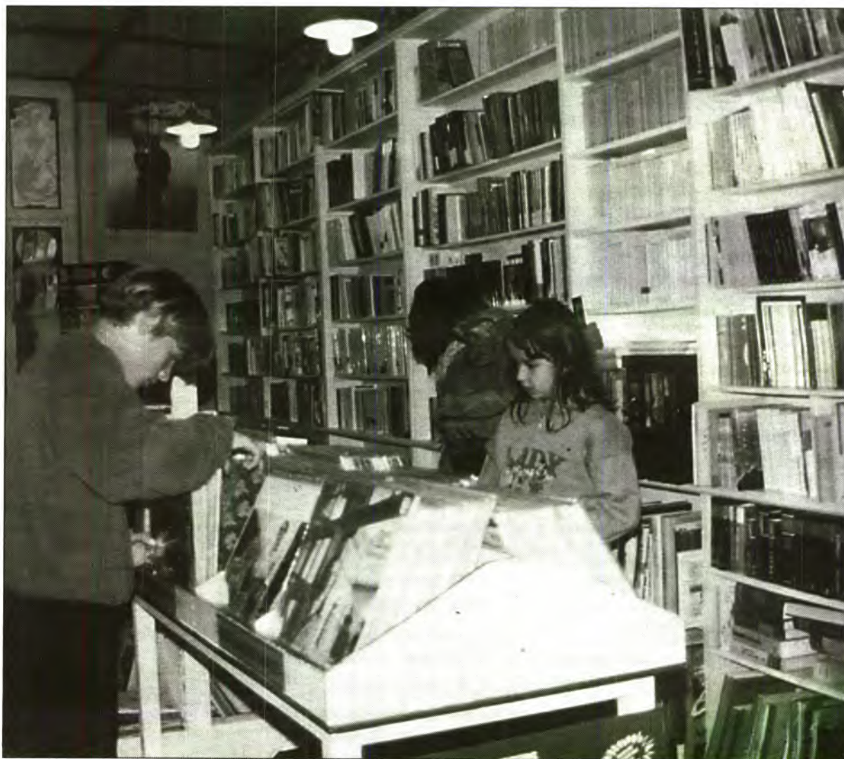
La llibreria Calabruix fa més d'una dècada que realitza una lloable tasca per oferir, a la gent, tota bona classe de lectures.

"Despertares poètics", Pedro Colom Mayol.