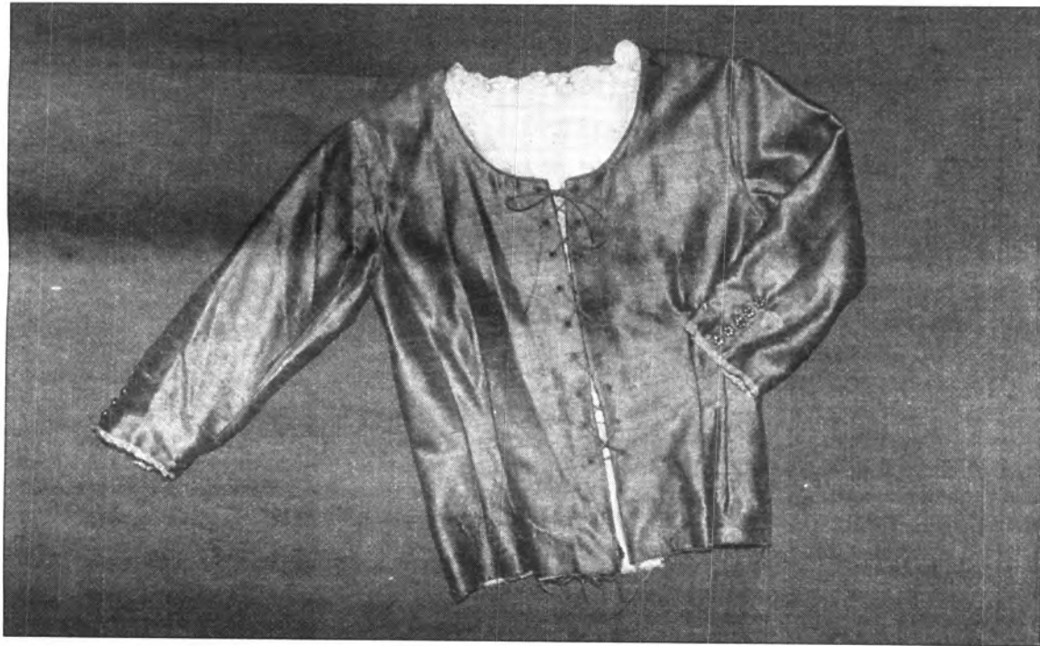
Exemple de gipó encordat amb veta.

menya, franel.la, friseta, mantó de catiu, panyo, roba de Pollença, sarjeta, xamellot. I aquestes teles