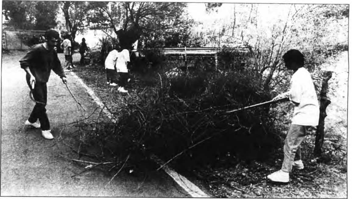
Pel seu compte Els Verds han senyalitzat i netejat un bocí de la carretera perquè la Conselleria d'Obres Públiques la té descuidada.