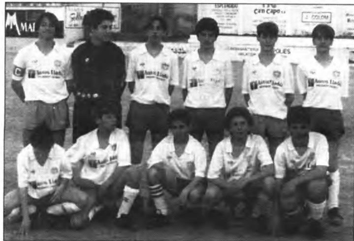
Equip infantil sollerense