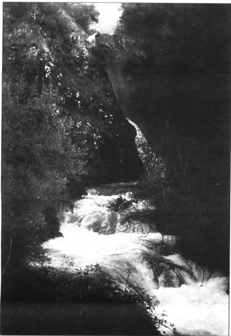
S'impone un control personal i de grup per gaudir de la natura i, a la vegada, respectar-la.

Una vegada acabat l'hivern, la primavera que comença ens convida a gaudir de la Natura i augmentar el nombre d'activitats que realitzem a l'aire lliure. Això que és bo per a tots nosaltres, no ha de ser dolent tampoc per la natura si respectem un codi ètic, que tots coneixem.