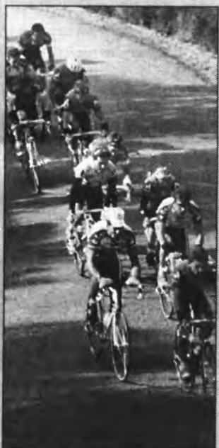
L'etapa sollerica pot ser decisiva.

A la segona etapa, que pot ser decisiva, amb els ports de muntanya del