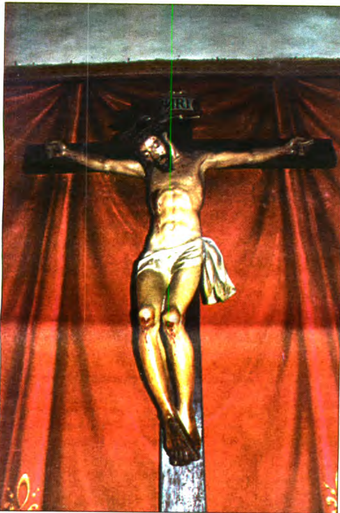
"La creu de Crist és l'escàndol que ha fet més renou de tota la història".