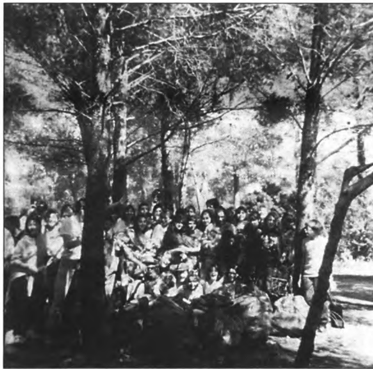
Després de la feina, el joc i les rialles...

En motiu del dia de l'arbre, els professors i alumnes de sext, sèptim i octau del Col·legi Públic "Es Puig" vàrem organitzar una excursió a la Torre Picada. La idea de l'excursió era que ens conscienciàssim de no embrutar el medi ambient , recollint la brutor que altres havien deixat.