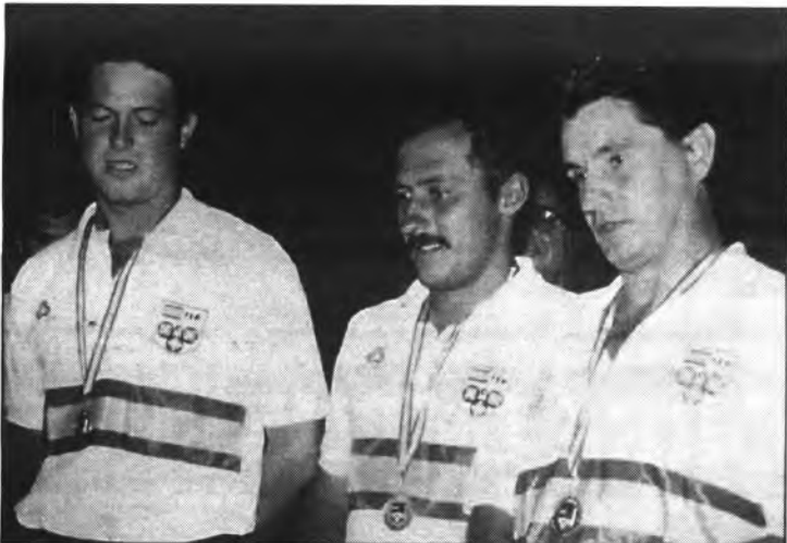
La tripleta campiona del 92 participa a la Fase Prèvia dels Campionats d'Espanya.