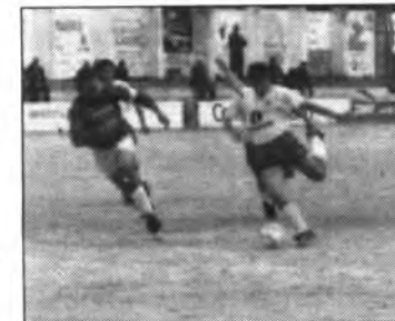
Cladera, des de fa uns partits, està immillorable.

Partit vinent: Passat demà diumenge a les 17'00 hores ens visitarà a can Maiol l'equip del Badia de Cala Millor , aquest equip a la primera volta ens va guanyar per la mínima en un partit on el Sóller no mereixia perdre, hem d'esperar que si les panades no ens han caigut feixugues els dos punts es quedin aquí.