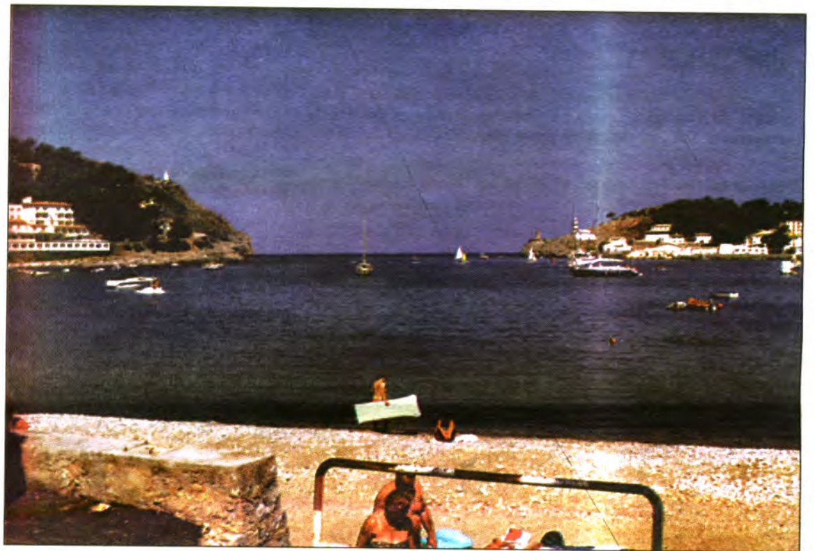
S'abocaran 200.000 metres cúbics d'arena a les platges.

Es confirma així la promesa realitzada l'any anterior pel govern central de dotar convenientment el projecte de recreixement de platges elaborat per la Jefatura de Costes de les Balears.