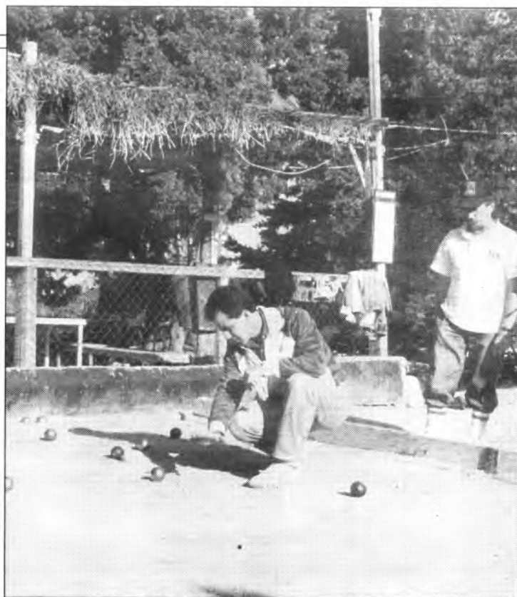
Els unionistes donaren la nota negativa de la jornada.

A Tercera, travalada del Belles Pistes en el seu desplaçament al Bar Tolo, si bé segueix en el segon lloc de la classificació.