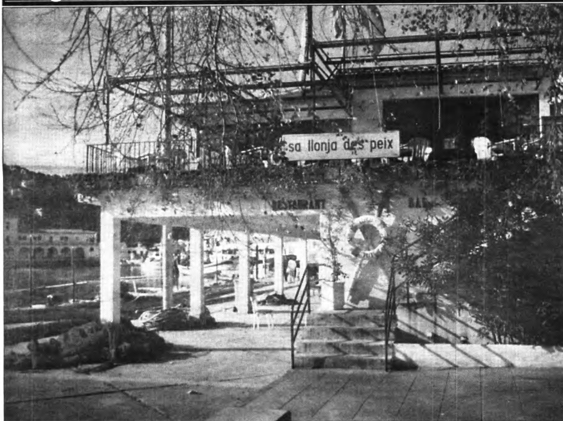
L'èxit d'un bon restaurant és entendre que als clients no se'ls pot enganyar