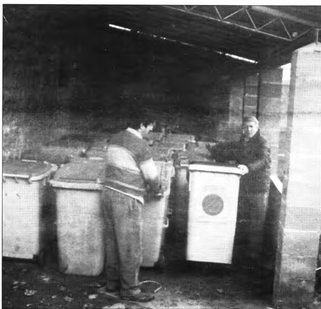
El femeters, un dels grups municipals implicats en el tema.

El grup cultural de l'Associació de la Tercera Edat ja està preparant la revetlla de sant Antoni , que l'any passat va ser un èxit. Seguïrem informant al pròxim número.