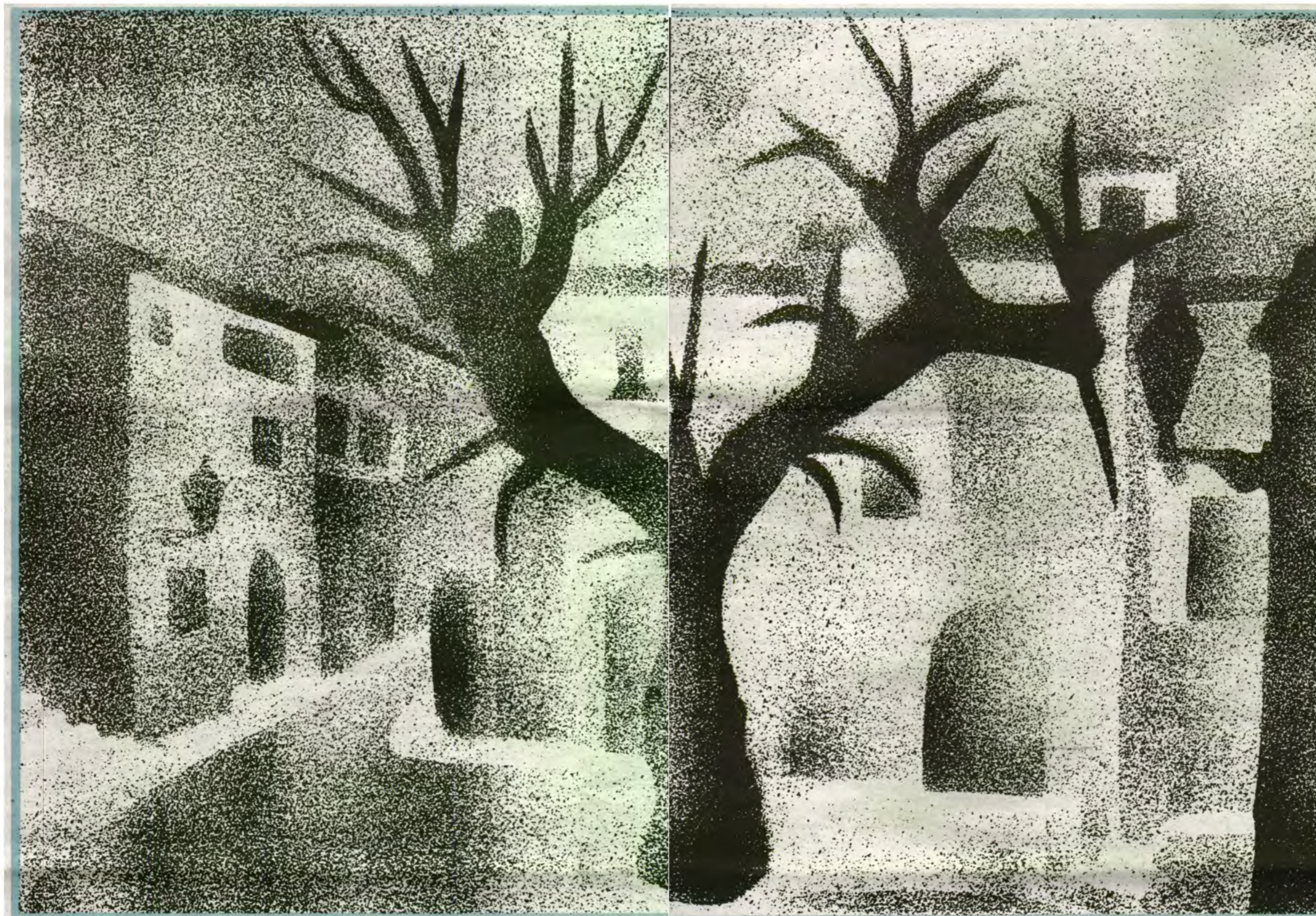
Biniraix. Sa Plaça. Nit del 1.985. Alberti. Pulverització a tinta xinesa.