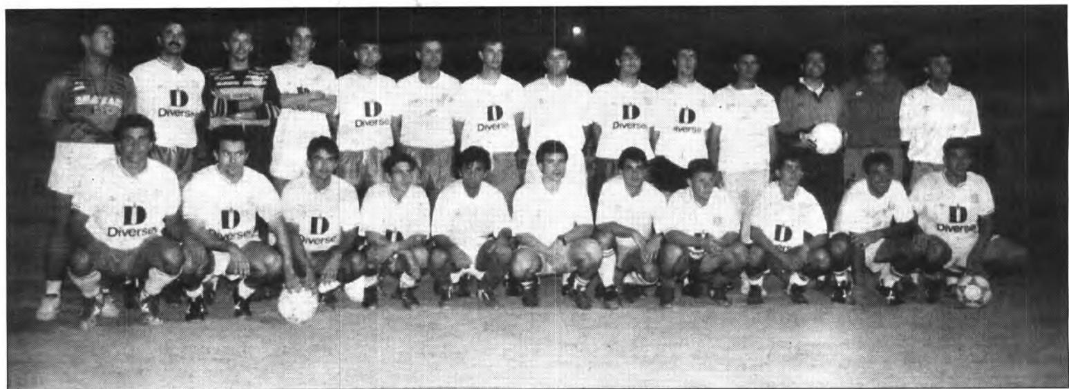
Els sollerics no podien començar l'any millor.

Els billets de la Loteria de Nadal del C.F. Sóller han estat agraciats amb el reintegrant. Seran abonats a l'oficina de Sóller de Sa Nostra.