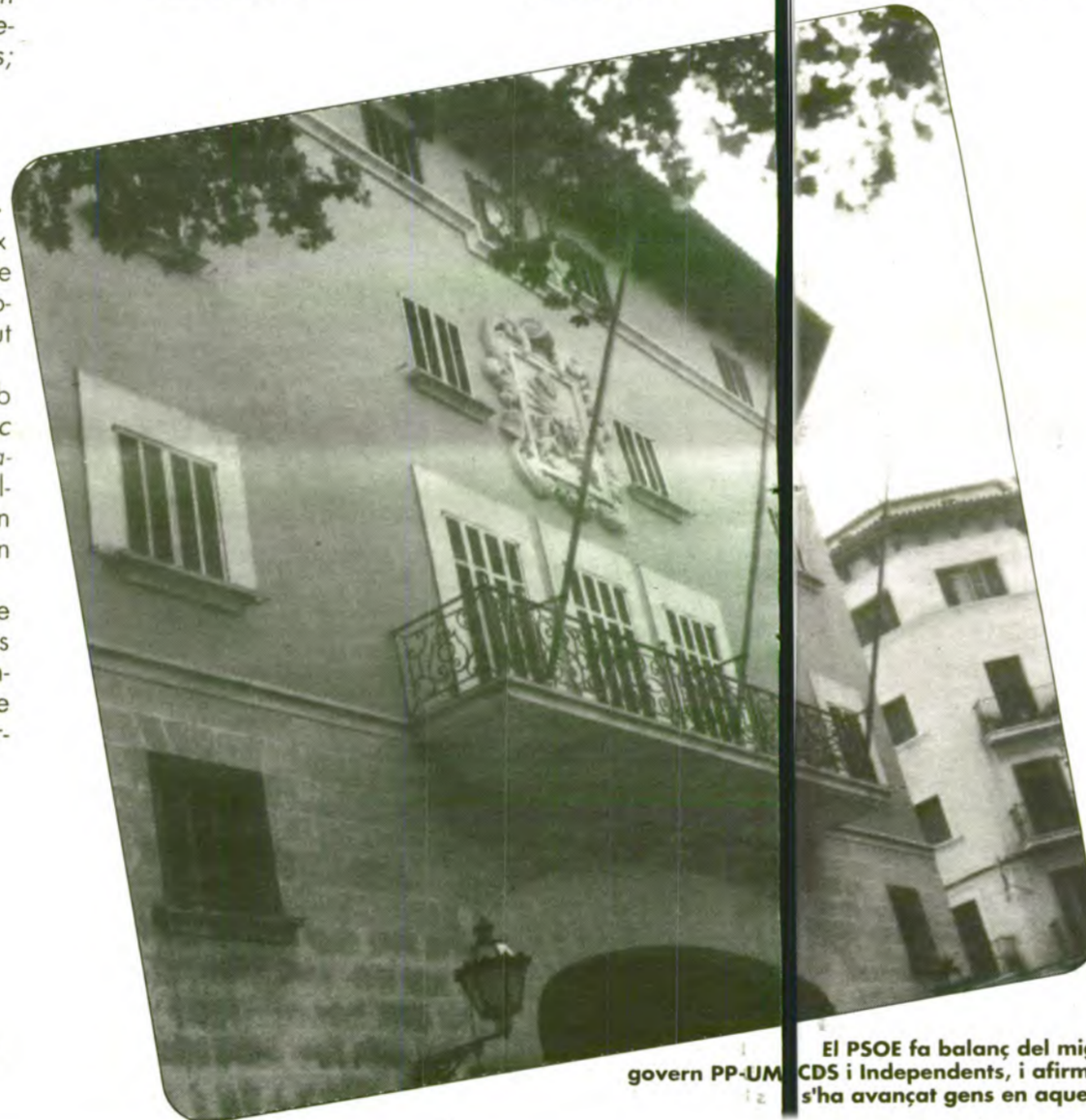
El PSOE fa balanç del mig any del govern PP-UM, CDS i Independents, i afirma que no s'ha avançat gens en aquest temps.

Els PSOE fa un balanç negatiu dels darrers sis mesos