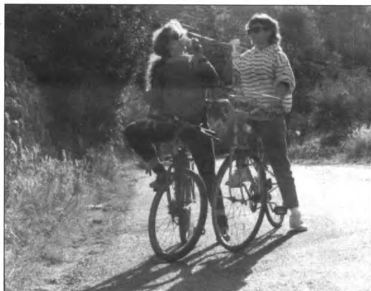
El cicloturisme, esport relaxant i sense presses...

Precedits de la Guàrdia Civil de Sóller (magnífica