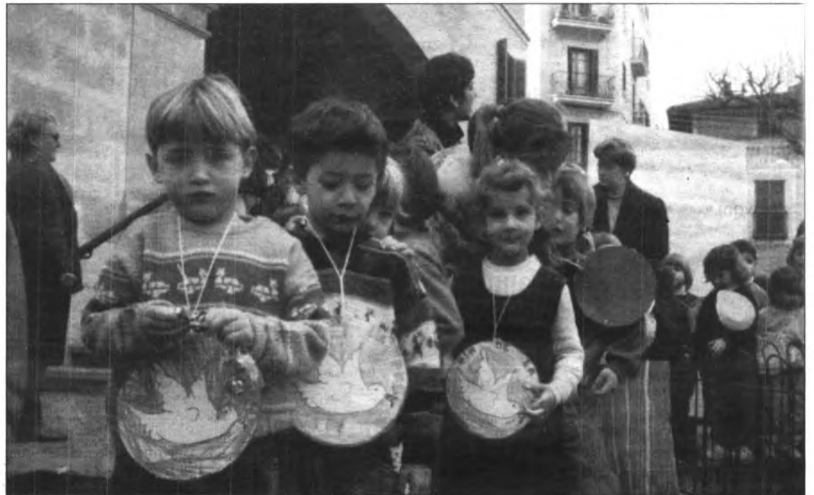
Els Centres Escolars de la comarca renoven aquests dies la seva composició.