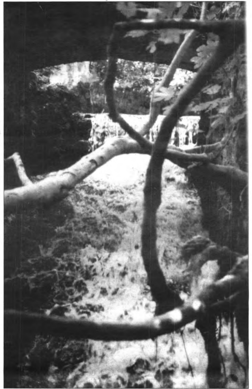
El projecte d'aprofitament de l'aigua de la font de sa Costera per al consum humà, sembla que duu camí de realitzar-se.

Davant la necessitat peremptòria d'aigua potable que precisa la capital i les zones turístiques dels voltants, agreujada per la sequera que pateix Mallorca els darrers anys, el consistori de Ciutat té en estudi un projecte de construcció d'una planta potabilitzadora d'aigua de la mar que vendria a pal·liar parcialment la demanda.