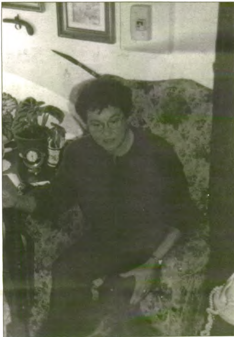
"Qualsevol cosa bona pel poble, vengui d'on vengui, la vull acceptar".

Per acabar la batlessa va voler fer una crida a tots els sollerics i demanar la seva confiança: "Es cert que un poble vol resultat i nosaltres pocs hem donam. Però feim molta feina i moltes gestions que no es veuen. Moltes hores dins despatxos per aconseguir res i tot això ho feim per Sóller. L'Ajuntament som tots i nosaltres feim feina per tots. Col·laboració, bona fe i enteniment és tot quan deman al meu poble."