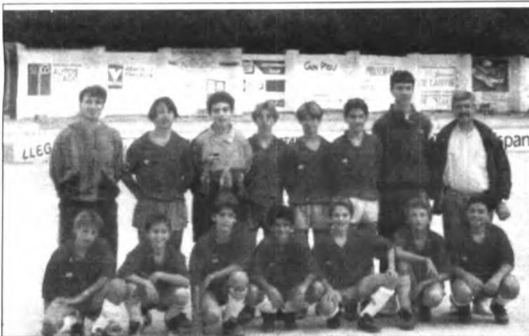
Un equip a tenir molt en compte.