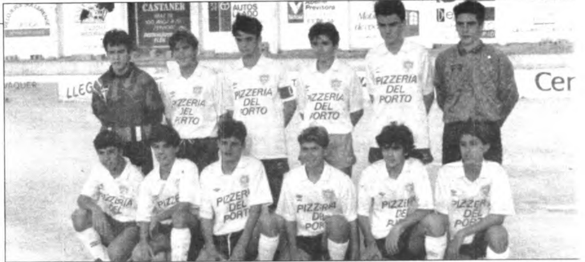
L'equip Cadet de la temporada 92-93.

golejar i es demostrà una altra vegada que el Sóller estarà pels llocs capdavanters.