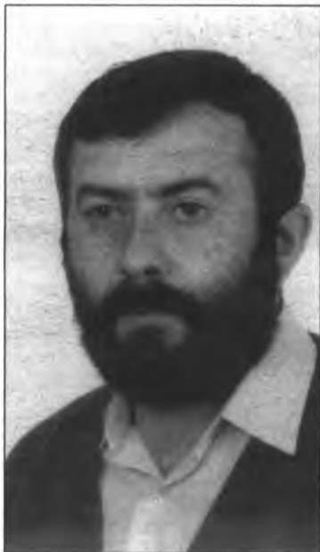
"Quinze dies després de la moció de censura, el centre de la Tercera Edat hagués pogut estar obert".

El segon punt a negociar i aclarir era el del mobiliari. Resultava que hi havia un acord de Comissió de Govern fet a la legislatura anterior (quan l'actual president de la tercera edat era regidor de l'ajuntament), pel qual l'edifici del qual tractam passava a ser d'ús exclusiu dels socis de l'Associació de la Tercera Edat. Això implicava que una persona que no fos soci no podia utilitzar el local. La Conselleria de Sanitat, que és l'encarregada de dotar de mobiliari aquests centres, va imposar que per poder dur el mobiliari al local de Sóller, havia de quedar clara la possibilitat de poder utilitzar el local per qualsevol persona de la tercera edat . Això volia