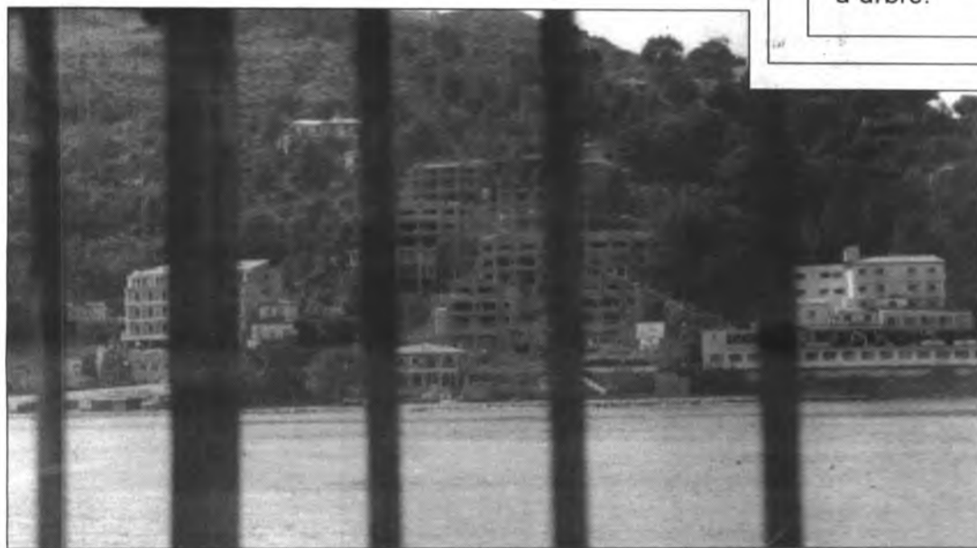
Les obres construcció del complex Platja Nord havien estat paralitzades durant l'estada del PSOE al front de l'àrea d'urbanisme.

Prengueren part a l'extinció de l'incendi la Policia Local de Sóller que, a més de contribuir a les tasques d'extinció, subministraren en tot moment queviures i begudes al personal que es traslladà a la zona. També col.laboraren la Guardia Civil, els Bombers, el guarda forestal i sobretot, es va comptar a l'ajut dels propietaris de les finques properes a la zona afectada.