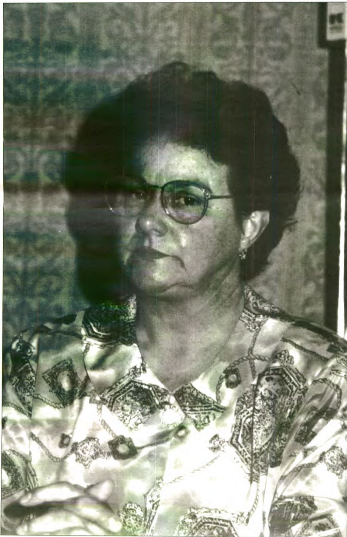
"L'Ajuntament és de tots els sollerics".