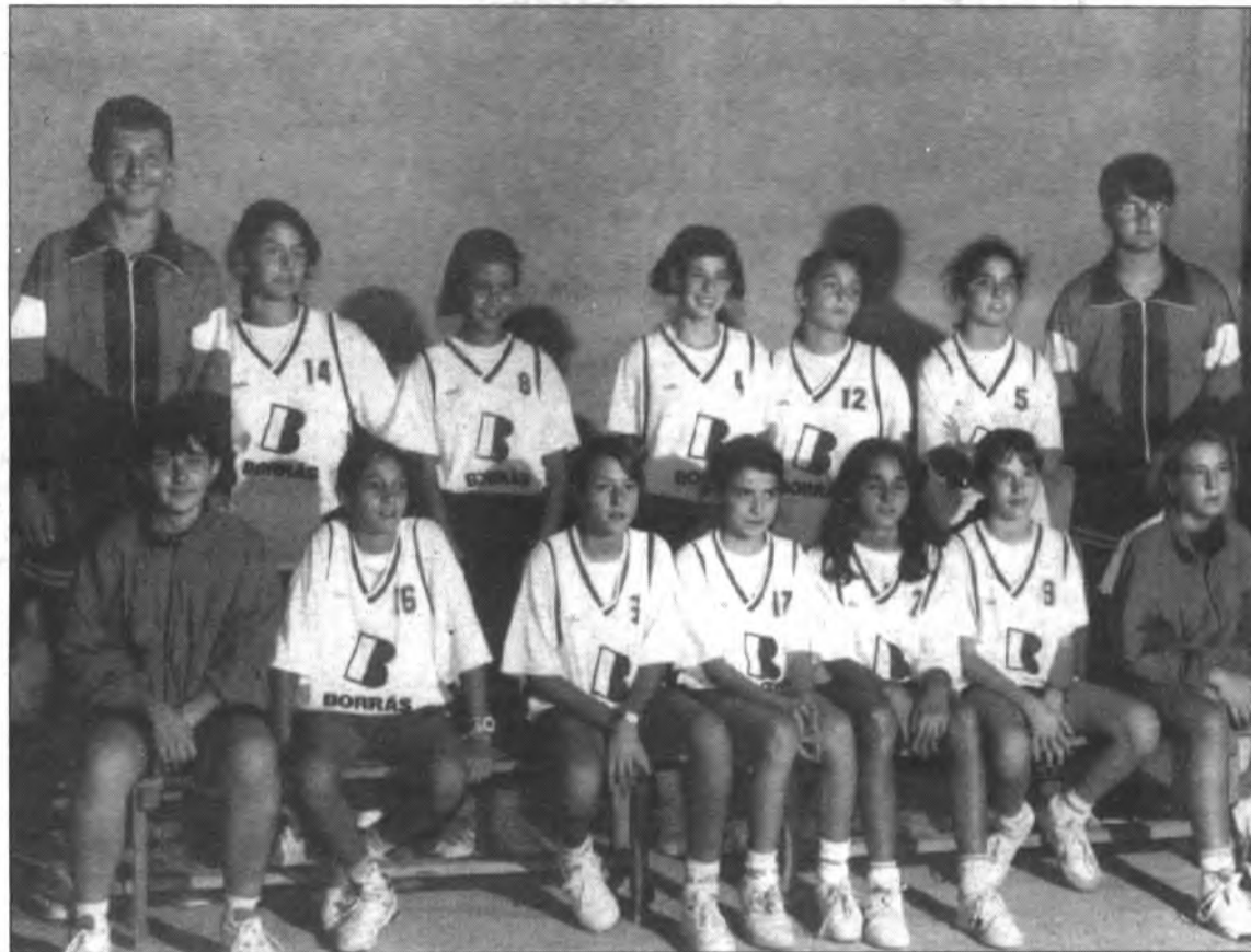
Implacable victòria de les Infantils.