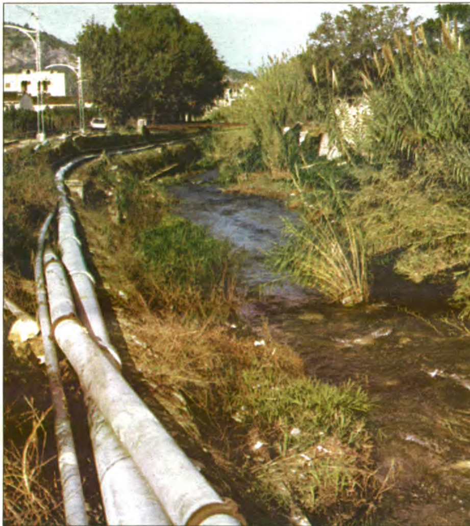
Les obres d'ampliació de la canonada que vessarà les aigües residuals de la depuradora a la síquia de la font de s'Olla estan molt avançades.

En segon lloc, estan a punt de concloure els treballs d'ampliació de la canonada que uneix la depuradora vella amb la síquia de regar, que ha vist augmentat el diàmetre dels 15 als