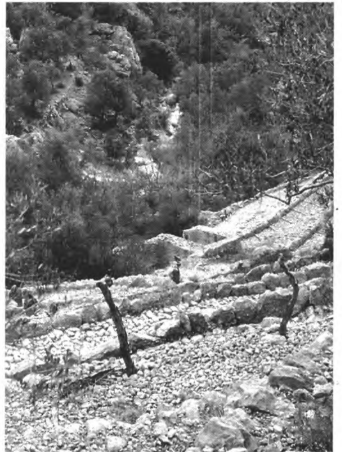
No és aquest el cas del camí del Barranc, però molts particulars intenten barrar el pas del públic pels antics camins rurals.

Els lladres utilitzaren el sistema denominat " butrón " per introduir-se a l'establiment, consistent en foradar la paret de