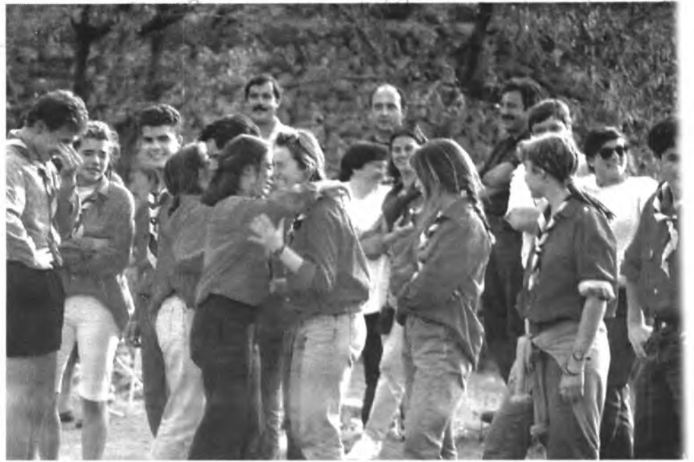
L'emotivitat i l'afecte a l'hora de deixar, per uns moments, els records viscuts entre amics: el pas de pioners/caravel·les a Ruta.

Aquesta quantitat serà retornada a l'Ajuntament perquè l'havia cotitzat de més en aquell exercici anual. Ara, aquests milions aniran a parar a l'apartat de majors ingressos i seran destinats a pal·liar alguna de les moltes mancances econòmiques de les Cases de la Vila.