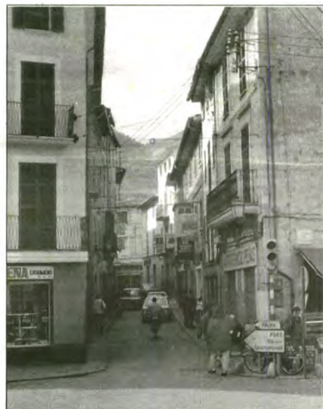
La majoria de comerciants estan d'acord en associar-se, però molts punts de discòrdia els separen.

Per a l'UGT, la causa principal és que el govern municipal va passar del tema i se'n va recordar de sol·licitar massa tard, tot i que la Sra. batlesa, abans de cobrar del POBLE, també s'havia d'inscriure cada any a l'INEM.