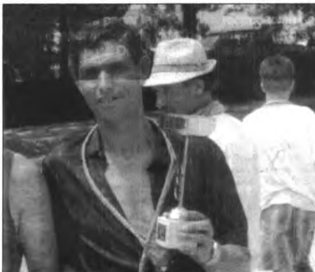
El solleric es troba classificat actualment en el lloc quart del Campionat de Mallorca.