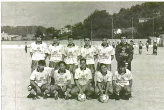
Equip juvenil 92/93