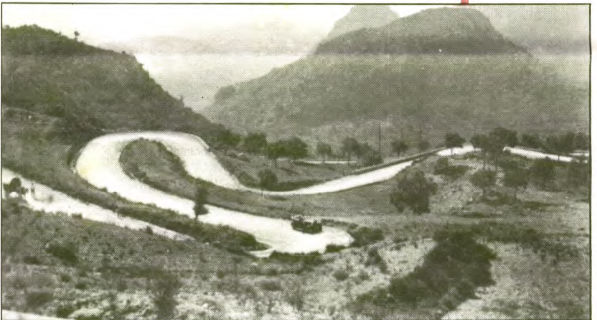
Foto Truyol, famós fotògraf de Ciutat que a principis de segle revolucionà el món de la imatge.

Des de dalt, la ciutat es presenta com una muntanya al revés. Comença la bai- xada i ja quasi puc desxifrar l'enrenou de la ràdio. El cotxe s'espolsa un poc la son, se retura, i seguim de nou el viatge cap a la rutina. De totes bandes m'arriba el re- cord de qualque cosa perduda. Hem arri- bat a l'infern. Però bé, no hi ha cap infern en aquest món que no sigui al constat d'algún cel.