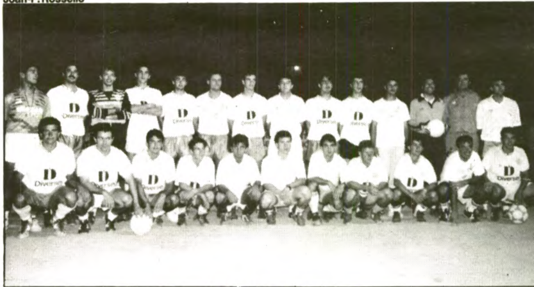
Plantilla del C.F. Sóller.