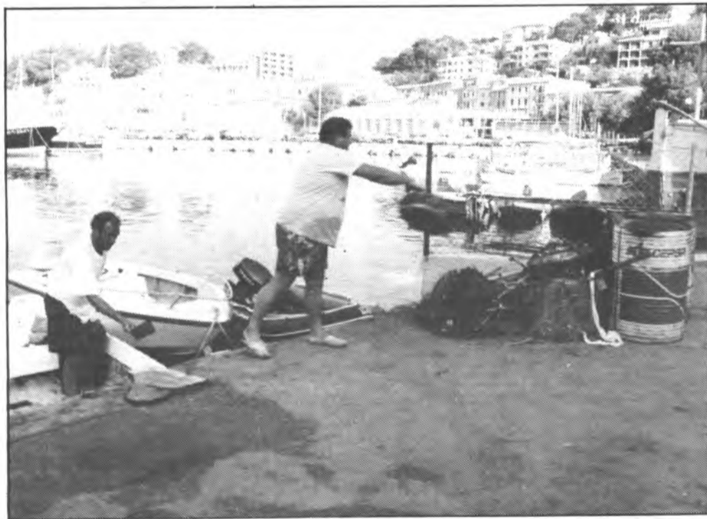
En quatre mesos, aquests dos homes han tret vàries tones de ferro, llauna, vidre i plàstic de la mar.

El nombre de sóllerics que han volat cap a Sevilla han estat molts. L'oferta de poder-hi anar era molta i variada. Des dels viatges de quatre-cinc dies on el nombre de passatgers ha sigut de cent cinquanta, als viatges de vint-i-quatre hores, que l'han aprofitat una cinquantena de sóllerics. Els viatges d'estudis o viatges organitzats, en grups, foren els qui feren més reserves amb un total de dos-cents cinquanta persones. Sens dubta podem dir que Sóller és una ciutat oberta al món.