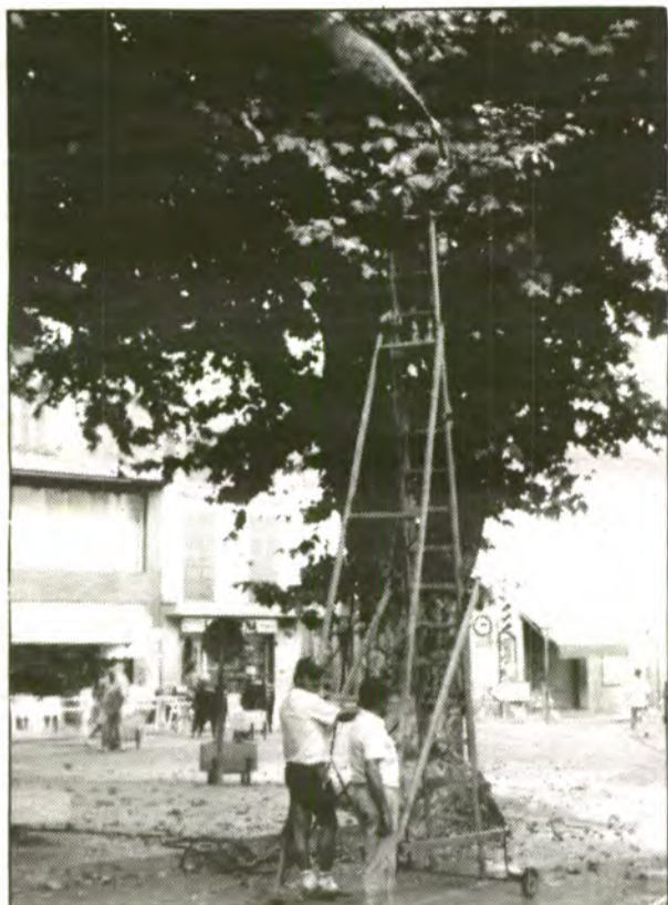
Dimarts passat, la brigada municipal inicià el tractament contra les malalties dels arbres de les vies públiques.