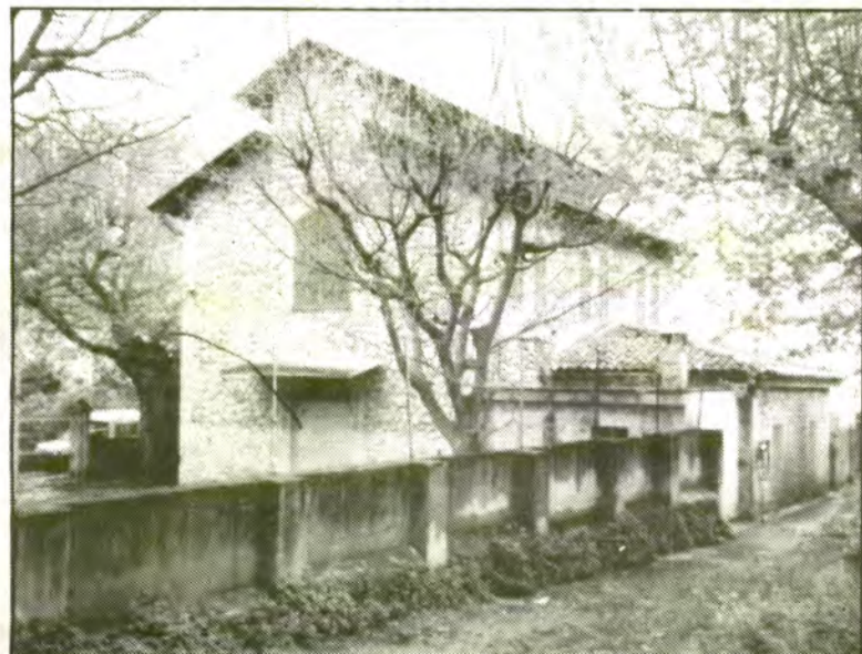
Sembla que l'escorxador municipal del camí de ses Fontanelles, finalment, es podrà recuperar.

Ara, davant l'evidència de la necessitat de comptar amb aquestes instal·lacions, l'Ajuntament va decidir encomenar un estudi de les modificacions necessàries i un pressupost. Aquest pressupost puja a quatre milions set-cents trenta mil pessetes , i tot i que l'Ajuntament ja ha decidit dur endavant l'obra, que ha d'estar llesta abans de finals del mes de setembre, encara no està clar d'on han de treure els doblers per pagar les obres.