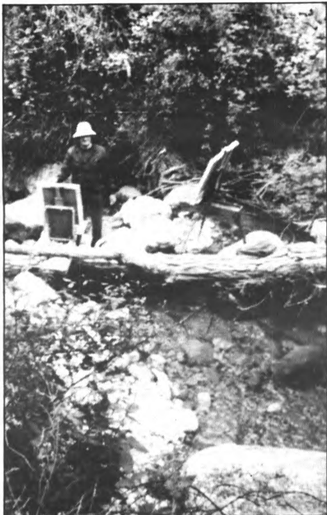
El Barranc de Biniaraix, un dels temes dels olis de Pere A. Frontera.