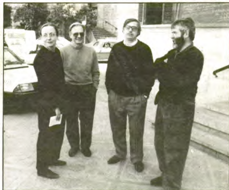
L'equip tècnic ha fet la seva proposta. Ara és el poble qui ha d'opinar sobre el seu futur urbanístic.

Serveix per estudiar la problemàtica de Sóller i per trobar-hi solucions.