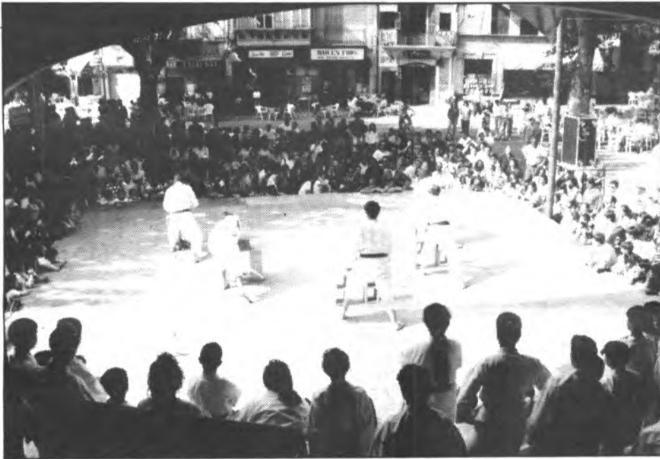
Demà, sis karateques sollerics intentaran superar els examens per ascendir de Cinturó.