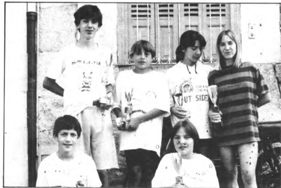
Malgrat tot, lluitaren amb totes les seves forces, deixant-nos un bon gust de boca.