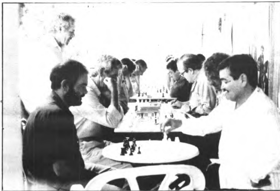
A pesar d'aquest revés la general segueix a favor del "Centro": Sóller, 7-Port de Sóller, 2.

Paral·lelament al torneig es disputaren bastantes par-