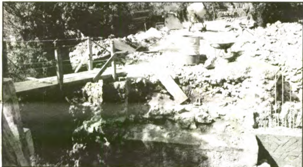
Segons els tècnics, el pontarró antic, construït amb volta de marès, perillava de caure. Ara se'n fa un de nou i més ample.