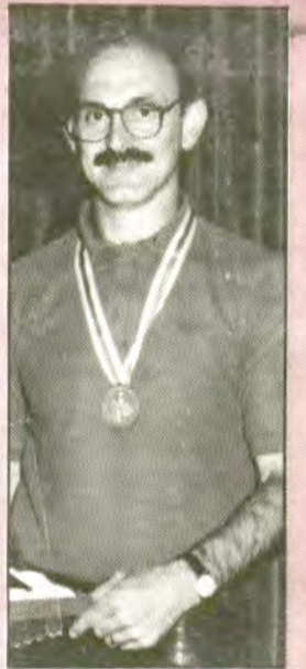
L'atleta solleric fou el banderer de la Selecció Espanyola.