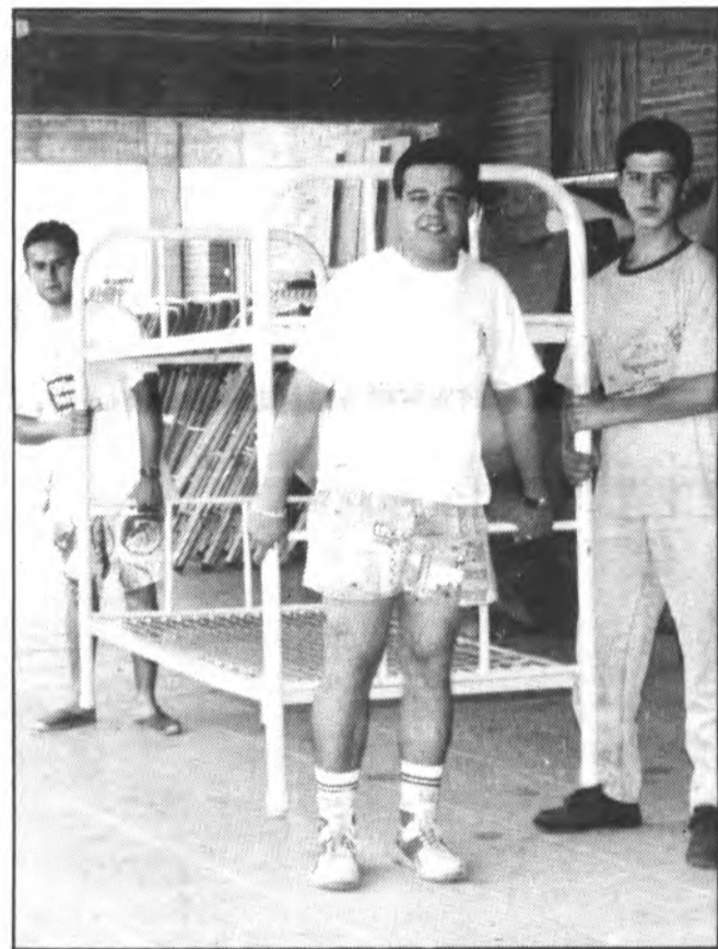
Les aules es converteixen en dormitoris. El canvi es fa amb l'ajuda de la brigada municipal i soldats del Puig Major.

La Mostra començarà el dimarts dia 14 de juliol a les 21'30 h. amb l'actuació de tots els grups participants i es clourà el diumenge dia 19 a les 18'30 h. amb la presència de les autoritats autonòmiques.