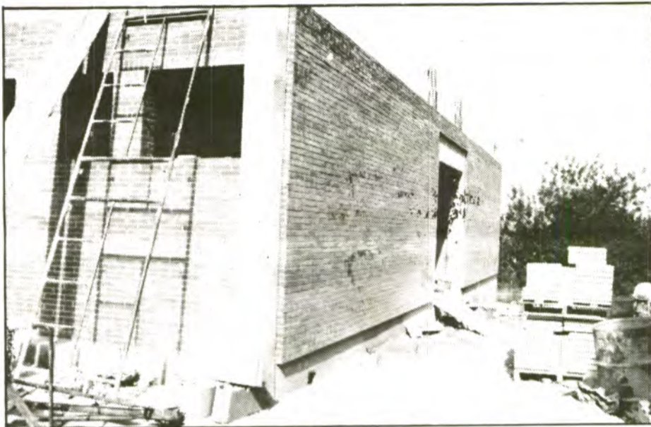
La construcció del segon pis del "xalet" costarà 36 milions de pessetes.

Es la segona fase de construcció de l'Institut de BUP que no bastarà per acollir tots els alumnes matriculats però alleujarà la massificació de les instal·lacions existents. L'obra, que costarà uns 36 milions de pessetes, consisteix en l'edificació d'un nou pis que estarà ocupat per quatre aules , una de les quals es dedicarà a laboratori de física. Aquesta segona fase també inclou la instal·lació de calefacció a l'edifici que evitarà, en part, l'humiditat soferta fins enguany. Durant els darrers mesos l'APA del BUP ha realitzat una campanya de captació de firmes de protesta entre els pares dels alumnes per l'estat de les instal·lacions i de sol·licitud d'ampliació del centre que, finalment, ha obtingut resposta positiva del Ministeri d'Educació.