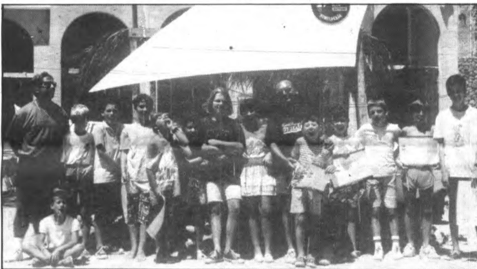
Professors i alguns dels alumnes del darrer curset escolar

Al finalitzar el citat curset, tots els alumnes que l'hagin aprofitat degudament, rebran un diploma acreditatiu de la Federació de Vela .