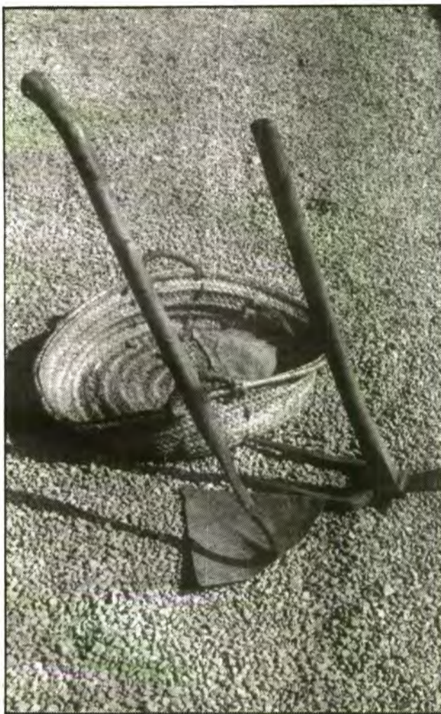
Terrossos vermells, ja torrats i encara calents s'esfloraven fent un esclafit omplint les meves cames, nues i suoses, de pols rogència i tèbia com una moixomia (...). Era un plaer que mai no he pogut oblidar.

El matí era clar, sense un nigulet. La mica de