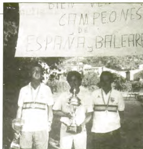
Els flamants nous Campions no paren. Ja pensaven amb el triomf del "Ciutat de Barcelona".

S'havia superat la primera dificultat, classificant-se pels octaus de final , juntament amb Barcelona-B,