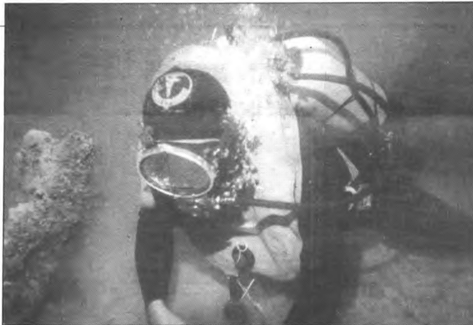
El termini de pre-inscripció acaba dilluns.

-Natació lliure. -Natació amb aletes, careta i tub. -Inmersió en apnea. -Salts amb equip lleuger. -Montar el regulador i equipar-se. -Inmersió amb escafandra. -Com emprar l'escafandra i el regulador. -Respirar en inmersió sense ulleres. -Respirar dos bussejadors amb el mateix regulador. -Salts amb equip complet. -Escap lliure. -Simulacre d'arrossegar un company defallit.