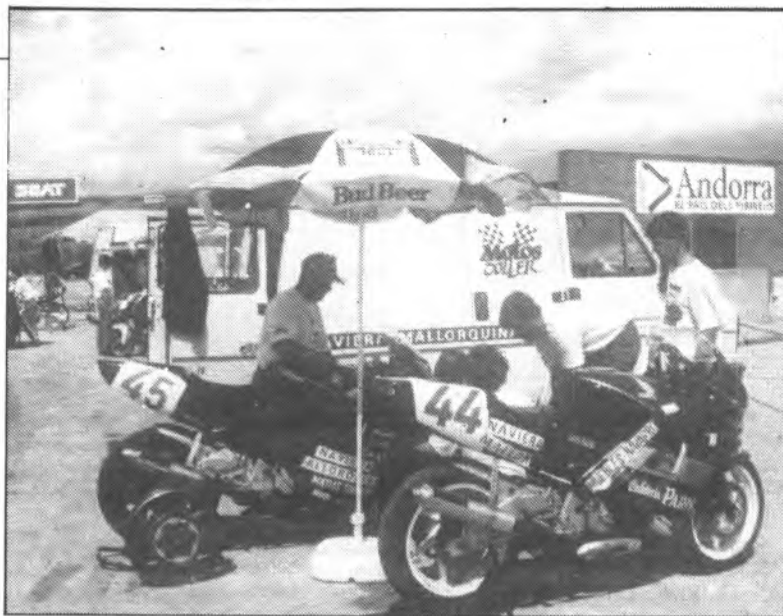
Els darrers preparatius abans de la sortida

rrer classificat per la cursa del diumenge, puntuable pel Campionat d'Espanya de Velocitat.