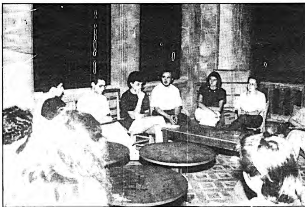
El moviment associatiu de Sóller (3)