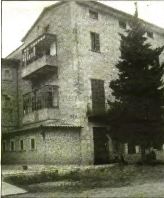
Amb les properes obres de reforma i ampliació, l'actual Centre Sanitari es convertirà en Centre de Salut.