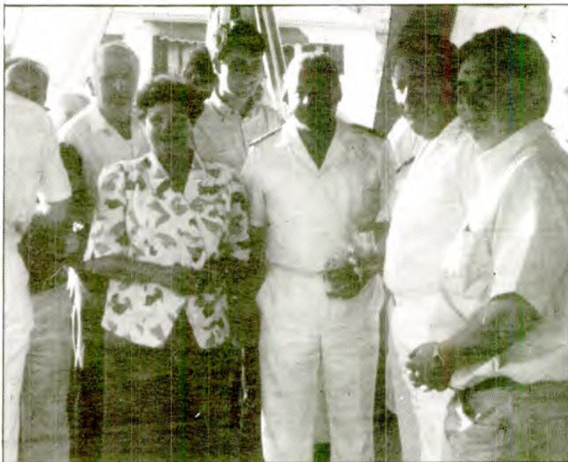
La tripulació es compon de 12 mariners, quasi tots oficials, que descansaren uns dies al Port de Sòller.

La tripulació, composta per dotze persones, es trobava descansant a Mallorca durant uns dies i, en la seva estada a Sòller, volgueren donar l'oportunitat a les autoritats locals de conèixer com és un remolcador.