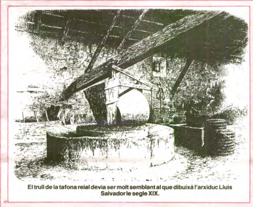
El trull de la tafona reial devia ser molt semblant al que dibuixà l'arxiduc Lluís Salvador le segle XIX.

Als voltants de l'any 1446, el celler estava "descubert e desruit", l'hostal tenia goteres i la tafona necessitava adobar. Així és que, el mes d'octubre d'aquell any, el Lloctinent General envia a Sóller al seu delegat personal, el jurista Gabriel Castanyer , perquè procedeixi a dirigir les obres de restauració. Bona part dels albarans de les despeses realitzades a les obres, que costaren 44,5 lliures, han arribat fins a nosaltres i ens propor-