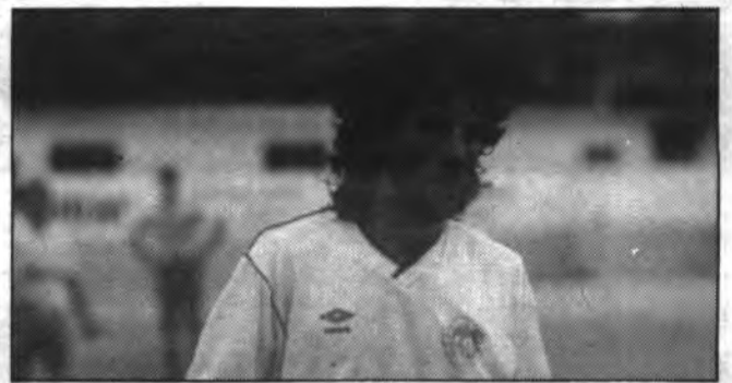
Tudurí, tres gols com a tres sols.

la història, degut a haver perdut, els sollerics, 8 punts seguits. El C.F. Sóller ha quedat a les portes de jugar la Copa del Rei.