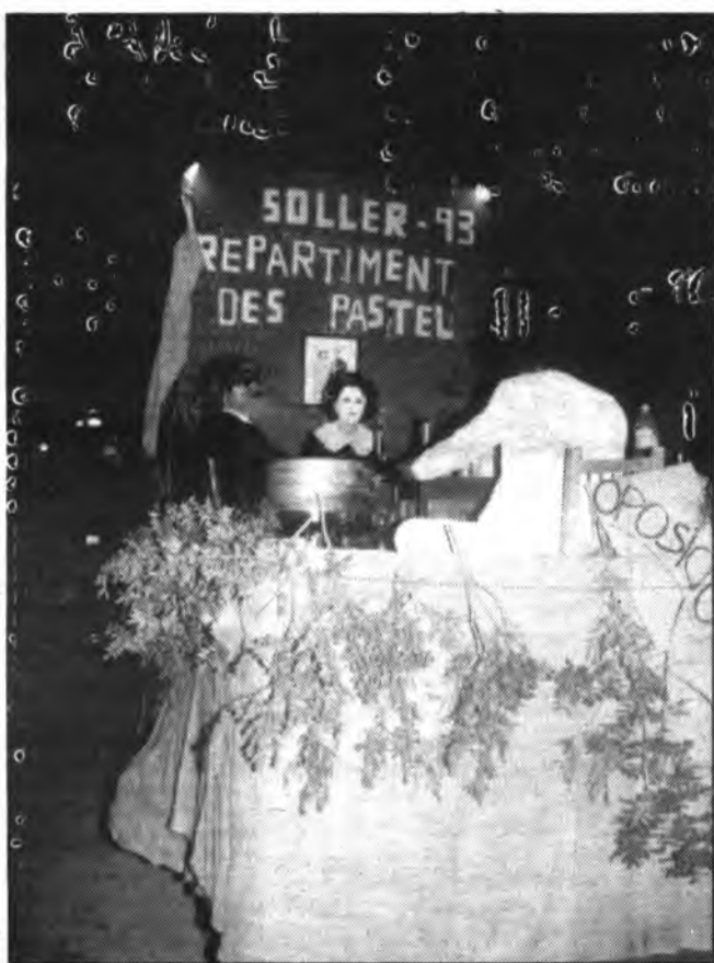
A la desfilada de carrosses no faltaren les al·lusions a l'actual situació política del nostre Ajuntament.