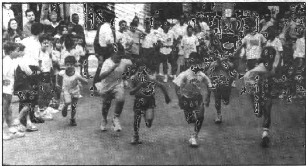
Els al.lots, com de costum, disfrutaren de debò.