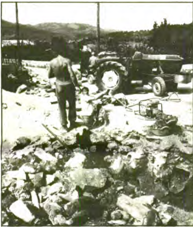
Biniaraix i els seus voltants ben aviat comptarà amb servei municipal d'aigua potable i clavagueram.

VS. - Com estan les gestions amb l'Estació Naval?