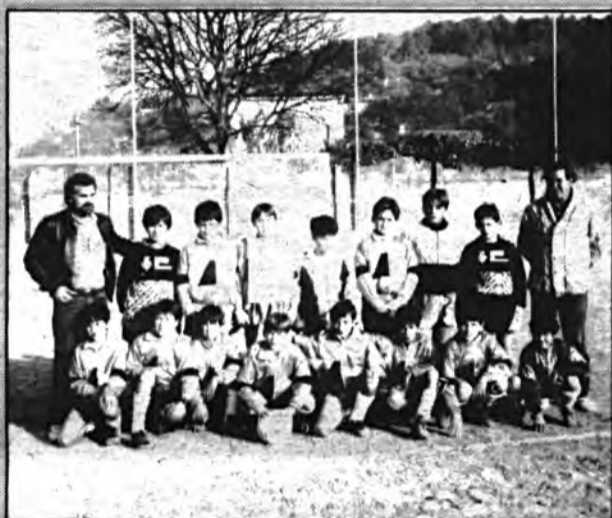
Equip benjami Sollerense.

Comentari: Fou un partit que es duia bé fins als darrers moments. La cosa es va descomposar i en deu minuts els de Son Sardina varen ficar tres gols, en certa manera podríem dir que és un resultat força