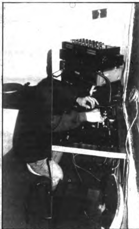
L'autor de la carta convida a la clandestinitat.