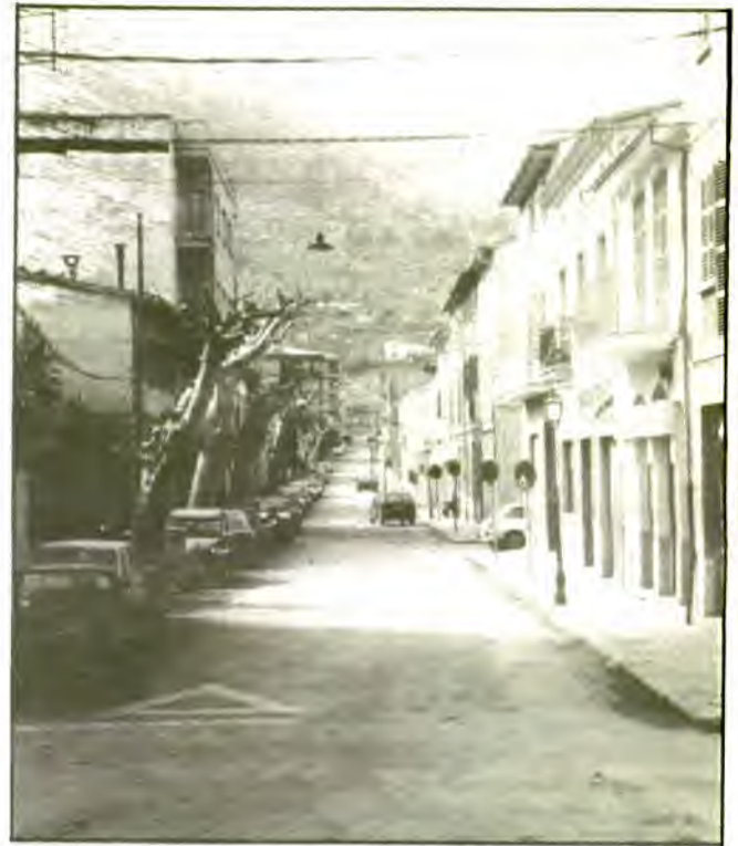
La reforma circulatoria ha permès descongestionar bona part del centre de la ciutat. Els arbres dels carrers han estat exsecallats per la Brigada d'Obres.

JA. - Aquí sí que la nostra gestió ha estat molt important. El projecte de sanejament d'aigua potable i clavagueram de Biniaraix s'ha revisat totalment i s'ha millorat moltíssim, de tal manera que durant l'hivern les aigües sobrants de les fonts de Cas