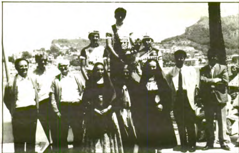
El flamant nou Campió, acompanyat de les Valentes Dones, Regidora de l'Ajuntament de Sóller, President de la F.T.B.C. i President del C.C.D.S.

El control dins els primers llocs és aixafant. Es preveu ja una dura lluita, sense clemència.