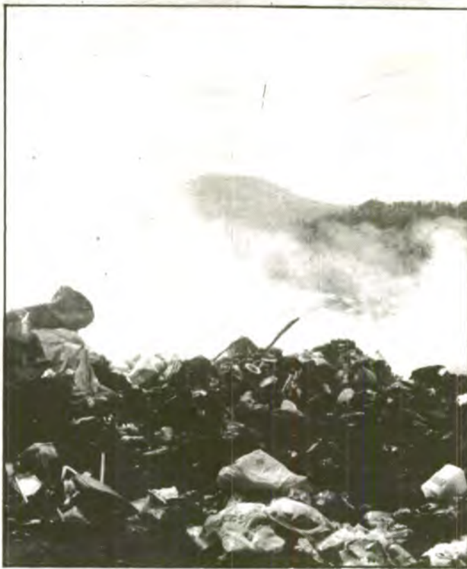
Aquesta imatge ha deixat d'existir. L'abocador de Sa Figuera ja no crema. Ara el fons es transporta a Son Reus on és eliminat.