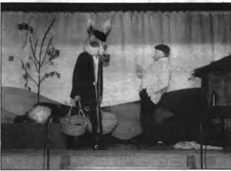
El diàleg obert de l'obra proporcionà una vetllada divertida, animada i entretinguda.

En definitiva, una vetllada divertida, animada i entretinguda per una nit de Fires i Festes amb el grup de Teatre de Bunyola; un grup que farà que no ens perdem la pròxima comèdia que molt prest duran a escena.