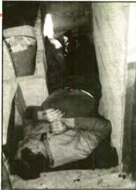
El matrimoni suïcida eren dos estrangers poc coneguts a la nostra Vall, que solien tenir freqüents discussions entre ells però mai crearen gaire problemes.

junts. El tercer donava tota una sèrie de directrius a seguir per la persona o persones que els trobassin.