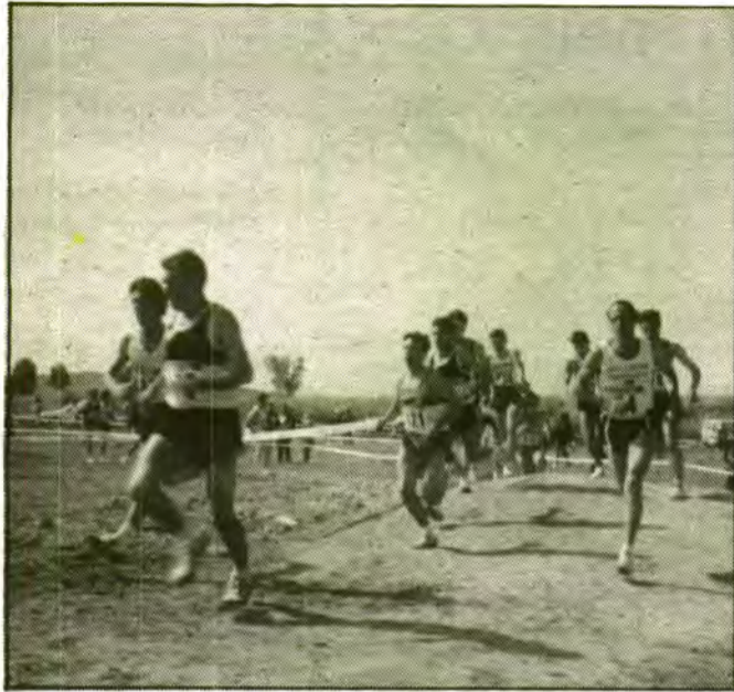
El salleric -en tercer lloc- en aquesta bella instantània del nostre enviat especial.

El C.A. Palma, cinquè classificat al Campionat d'Espanya de Cross