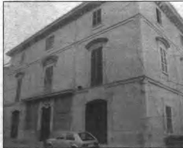
Ben aviat es firmarà un conveni de col.laboració entre l'ASCP i l'Ajuntament de Söller.

D'aquesta quantitat manquen a tornar 4.335.000 ptes. que foren avançades pels socis en forma d' aportacions voluntàries de 5.000 ptes. En total es varen subscriure 867 aportacions, vint de les quals foren amortitzades en el transcurs de la mateixa assemblea, i es va aprovar pel 1992 un pressupost amb superàvit per tal de seguir tornant als socis el valor de les aportacions que