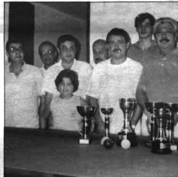
Gran rivalitat dins els primers llocs

partides. disputades, d'aquest Torneig que està previst finalitzi dia 1 de febrer, són les següents: