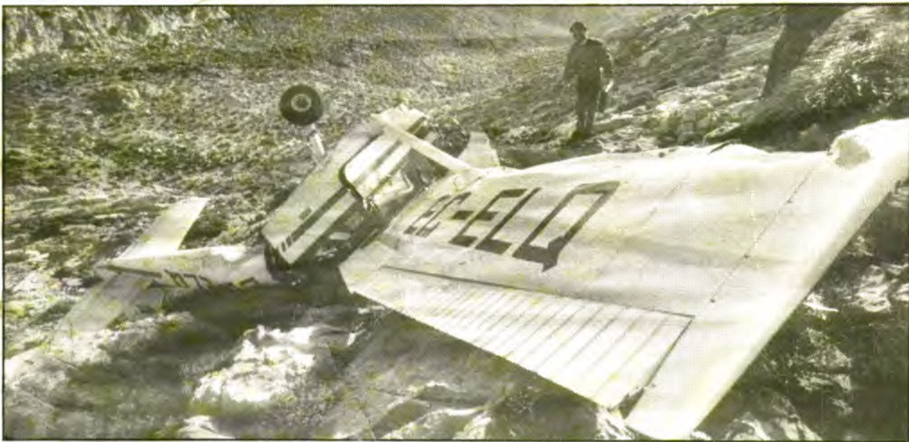
L'avioneta caigué a les muntanyes de Cúber i quedà totalment destrossada. (Foto Diari de Mallorca).

Els soldats del Puig Major i la Creu Roja, dignes d'una medalla.