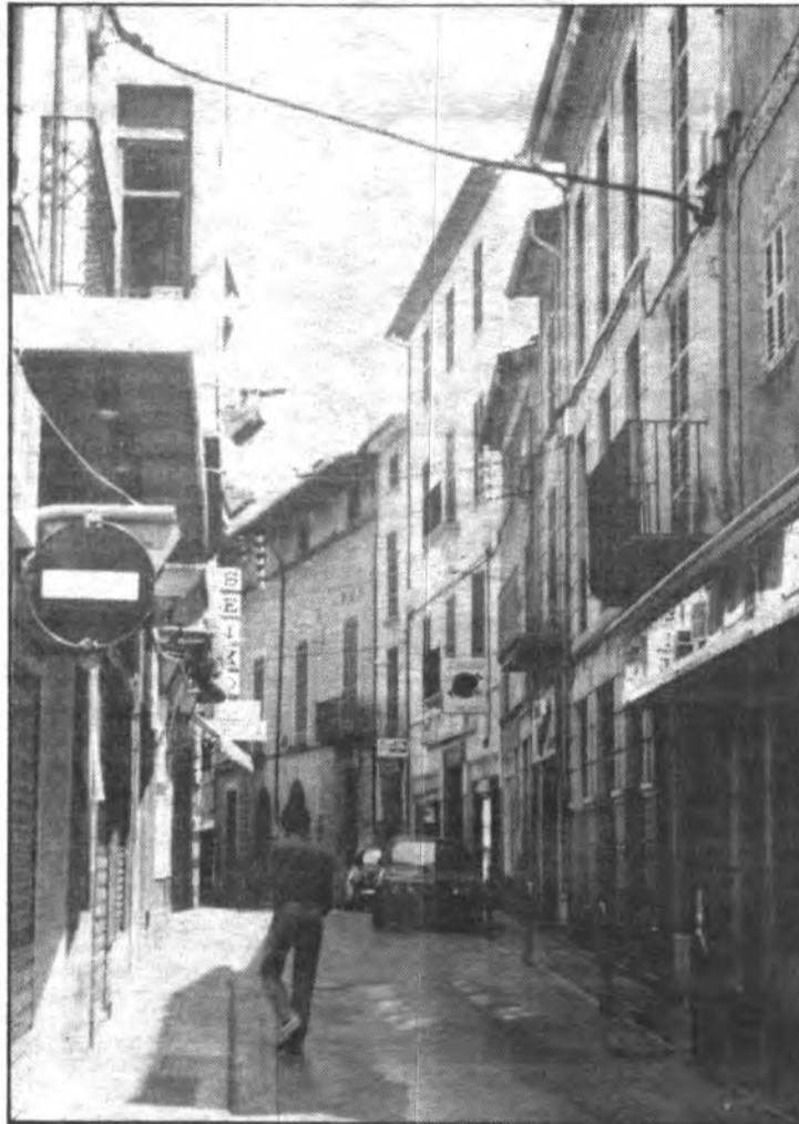
L'aplicació de l'impost sobre activitats econòmiques permetrà créixer els ingressos uns 20 milions.

Veü de Sóller ofereix a continuació una anàlisi pormenoritzada de les quantitats que figuren en el pressupost d'enguany, en la que cal tenir en compte que les xifres que s'ofereixen han estat arrodonides per a una millor comprensió del lector.