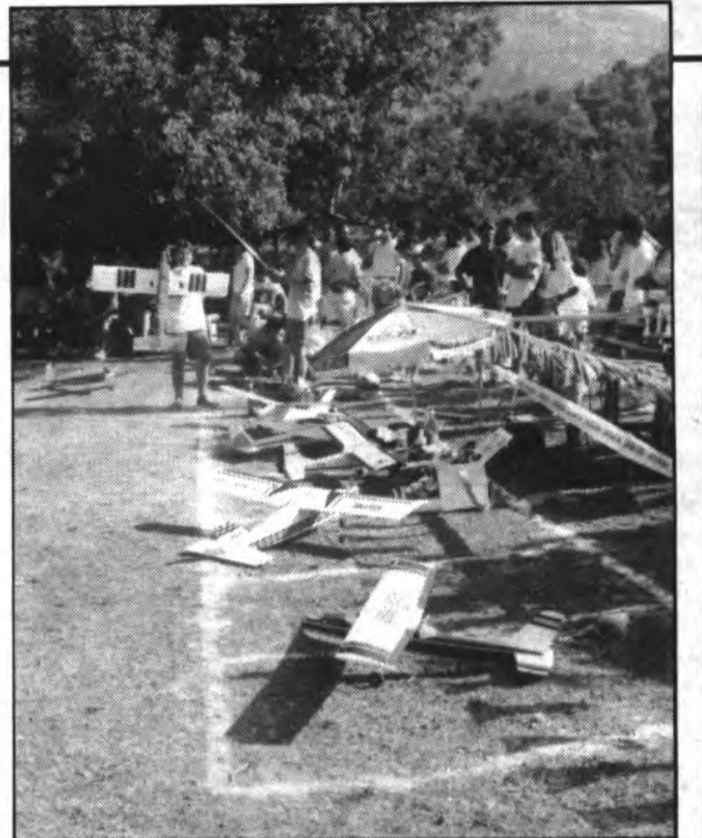
Els organitzadors, contents amb la participació, destacaren la bona disponibilitat i la paciència dels veïns de la zona.