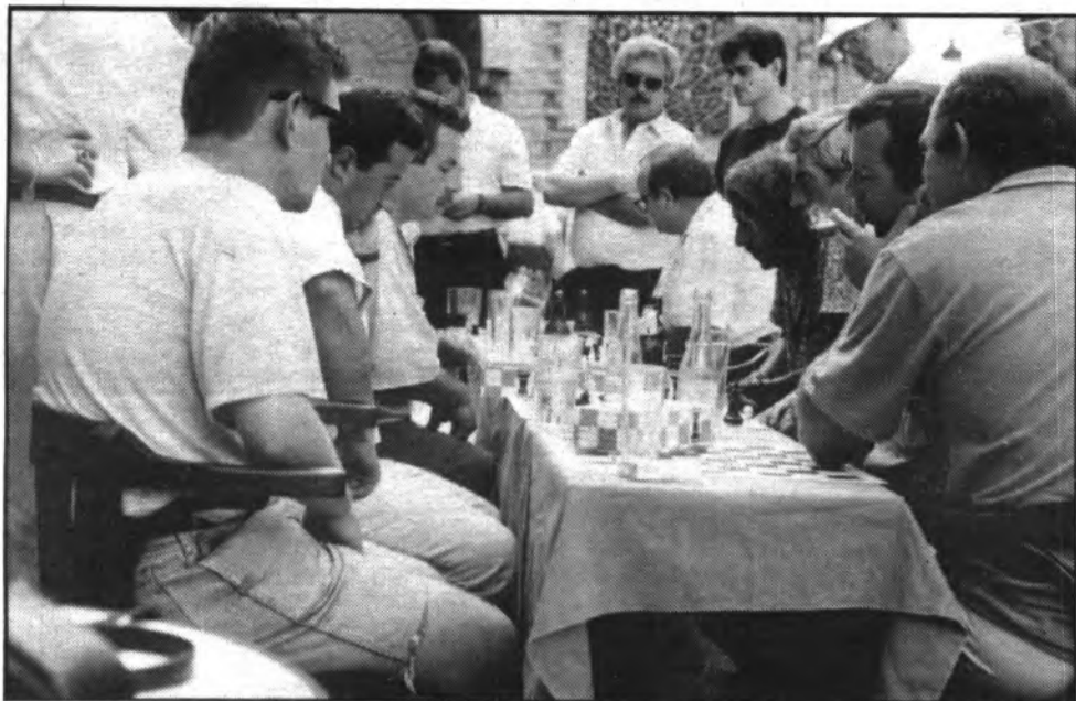
Les confrontacions d'escacs han comptat sempre amb gran número de seguidors.