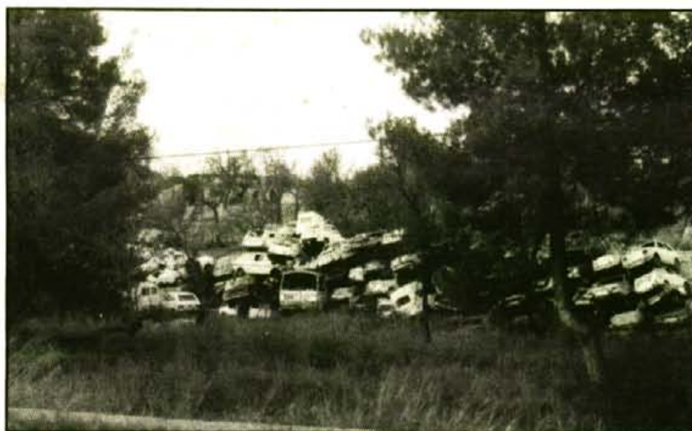
Aquesta terrenys, fins ara utilitzats com a cementiri de cotxes, es poden convertir en un magatzem de bombones de gas butà.

Aquesta iniciativa del llibre i de la rosa ha arrelat a països tan allunyats de la nostra cultura com el Japó i la diada del llibre s'ha convertit en una de les dates de promoció editorial més importants.