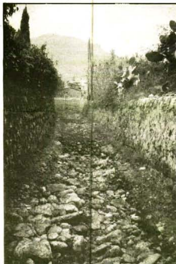
S'està encimentant el tros on el torrent i el camí de Can Creueta coincideixen, però el camí no s'acabarà d'asfaltar.