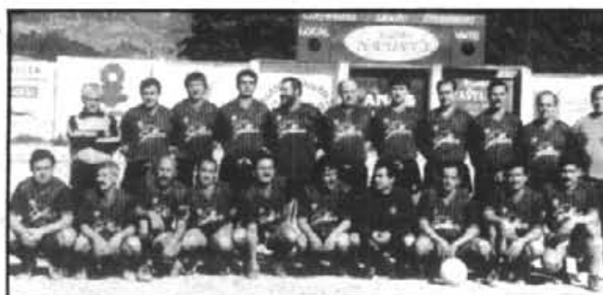
VETERANS PORT DE SOLLER, compleix vuit anys. Per tal motiu, dissabte passat va celebrar un encontre davant els veterans del R. Mallorca, amb resultat final d'empat a quatre gols. Tant el partit com els actes complementaris, resultaren un total èxit. Desde "Veu de Sóller" desitjam molts d'anys de vida esportiva al simpàtic club de la zona marítima. A destacar igualment el nou vestuari donat per "Viages Sóller" i estrenat el mateix dia de la commemoració.

Dilluns a vespre es jugà aquest partit que en el seu dia fou ajornat per les plujes. Magnífic triomf del Sollerense basat en un joc de conjunt. El gol fou marcat per Jordi Bauzá, de córner directe, en el minut 5 de la segona part. Amb aquest triomf, el Sollerense confirma la seva bona posició a la taula, amb 23 punts, per damunt d'un caramull d'equips. Entre els destacats, gairabé tots, però el porter Mèl Carbonell fou la figura.