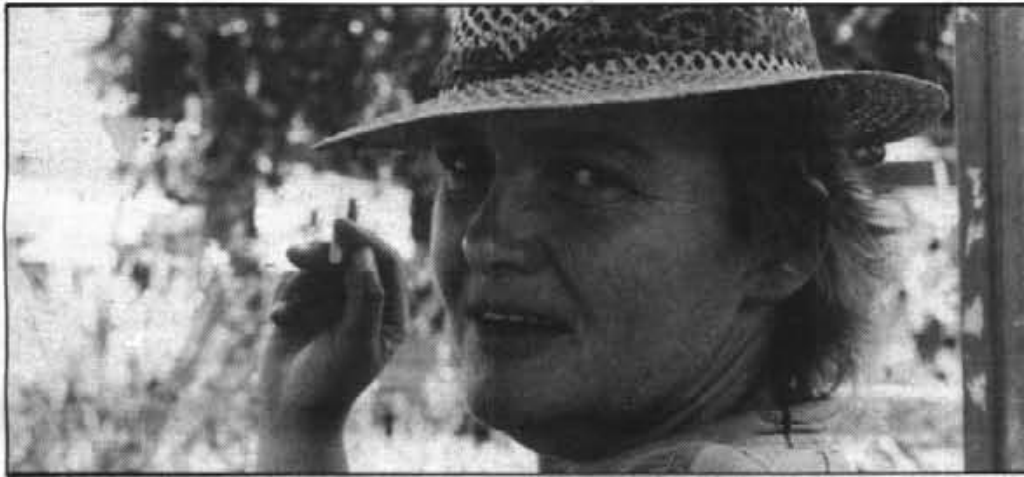
"La gente que hace espejos conoce el misterio. No se hace un espejo a la vista del humano, sino que se sitúa a la gente enfrente del espejo".