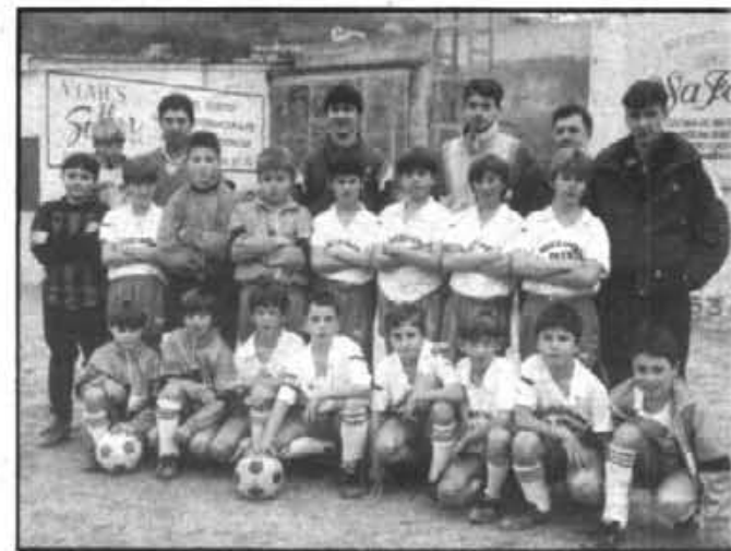
Equip Benjami del C.F. Sóller, en que hi neixen futures figures. Alguns d'aquest el·lots (10-11 anys), arribaran al primer equip als voltants de l'any 2.000.