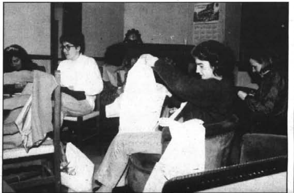
Aprenen a manejar l'agulla i la màquina de cosir, confeccionant peces de roba senzilla.

No es tracta d'un curs on es facin patrons, sino que es passa directament a la pràctica de fer roba útil i senzilla: pijames, faldes, bluses... i també aprenen a manejar la màquina de cosir.