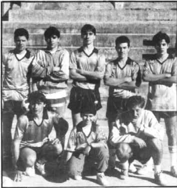
Fortuna, l'estrella de la jornada, i també del torneig del Victòria.