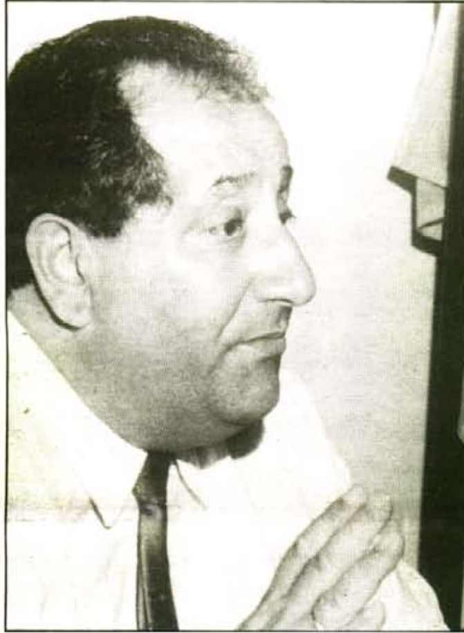
"Mai renunciaré a la plaça de Secretari de l'Ajuntament de Sóller".

Fins un determinant moment, va ser alabat per l'actual Batle com una persona extraordinària; però, un bon dia, la truita es va capgirar i quasi arribaren a les mans. El menyspreu i la rancúnia varen fer acte de presència fins al punt d'arribar a l'humiliació personal i a ser-li obert d'un expedient disciplinari per part del Batle, al·legant que no compareixia al seu lloc de treball.