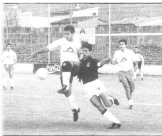
El "tractor" Bestard tornà esser l'amo. Dos tirs al pal i un penal clar no assenyalat. El seu liderat al Trofeu CAMEL no es una casualitat.