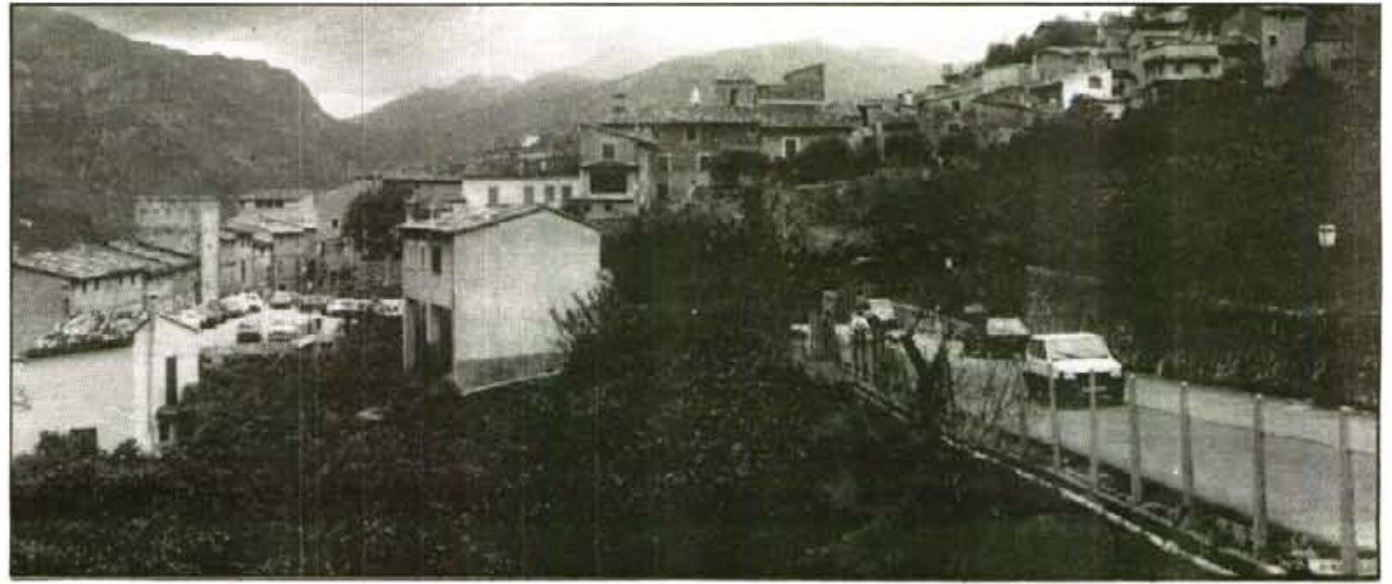
Poliesportiu de Sa Rutllana, Xarxa de clavaguera i aigua potable, Ajuda a Domicili, Pla d'Acció Social, i Millorament de Façanes són les inversions que preveuen els pressuposts d'enguany.

Finalment, cal destacar que és la primera vegada en molt temps que l'Ajuntament haurà de fer front a l'endeutament econòmic, motivat per un préstec de quasi nou milions de pessetes.