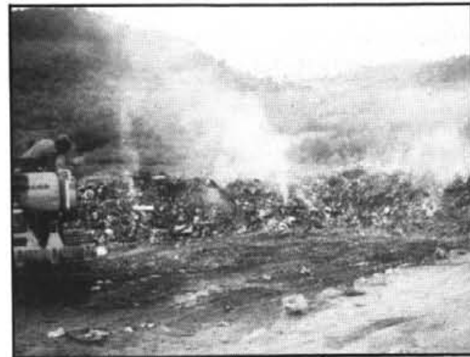
Sin un ocell travessa un nivell de gas clòric mor al cap de pocs minuts.

Per tal de mesurar l'abast del problema a la nostra vall (que afecta tant els éssers humans com el bestiar), seria molt