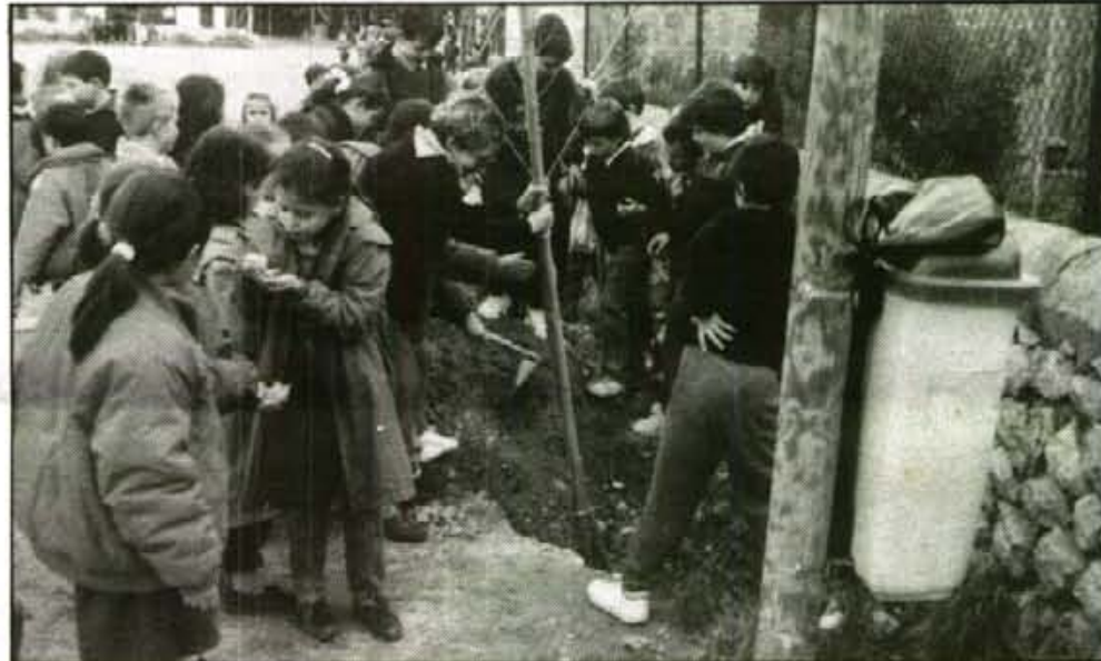
S'han sembrat polls i xiprers. (Foto: Xesc Amorós).

més dels 25 polls que varen sembrar els alumnes assistents a l'acte, també s'han sembrat 50 xiprers dins cossols per transplantar-los, quan sia el moment, als voltants de la nova depuradora per tal de tapar un poc i amortiguar l'efecte pantalla que produeix, sobretot venint de Deià.