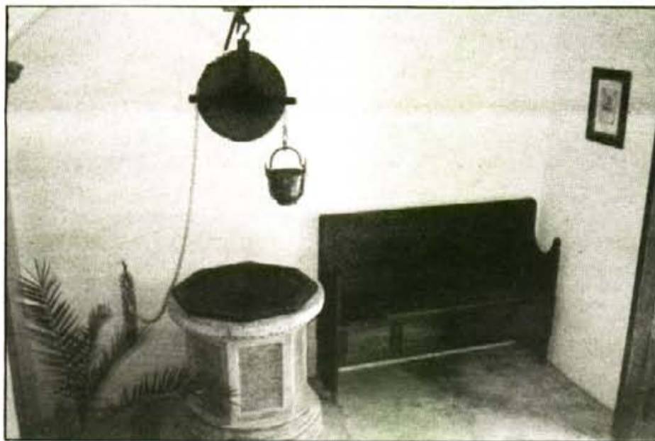
També a l'entrada, s'ha conservat el coll pou. El Museu Parroquial, també conté elements populars