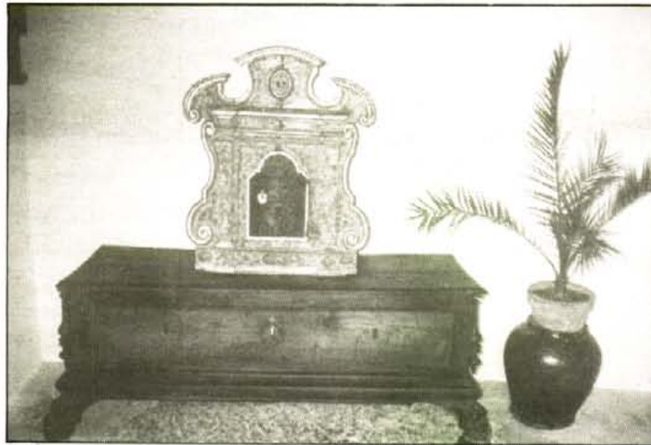
Sobre un antiga caixa, un sagrari, està exposat a l'entrada del museu

S'han recuperades moltes obres que estaven abandonades pels racons