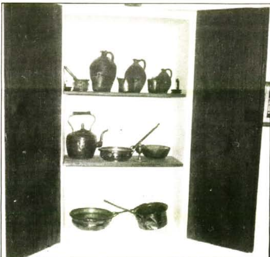
En un armari, una col·lecció de peces d'aram, a la primera sala del primer pis de la parròquia