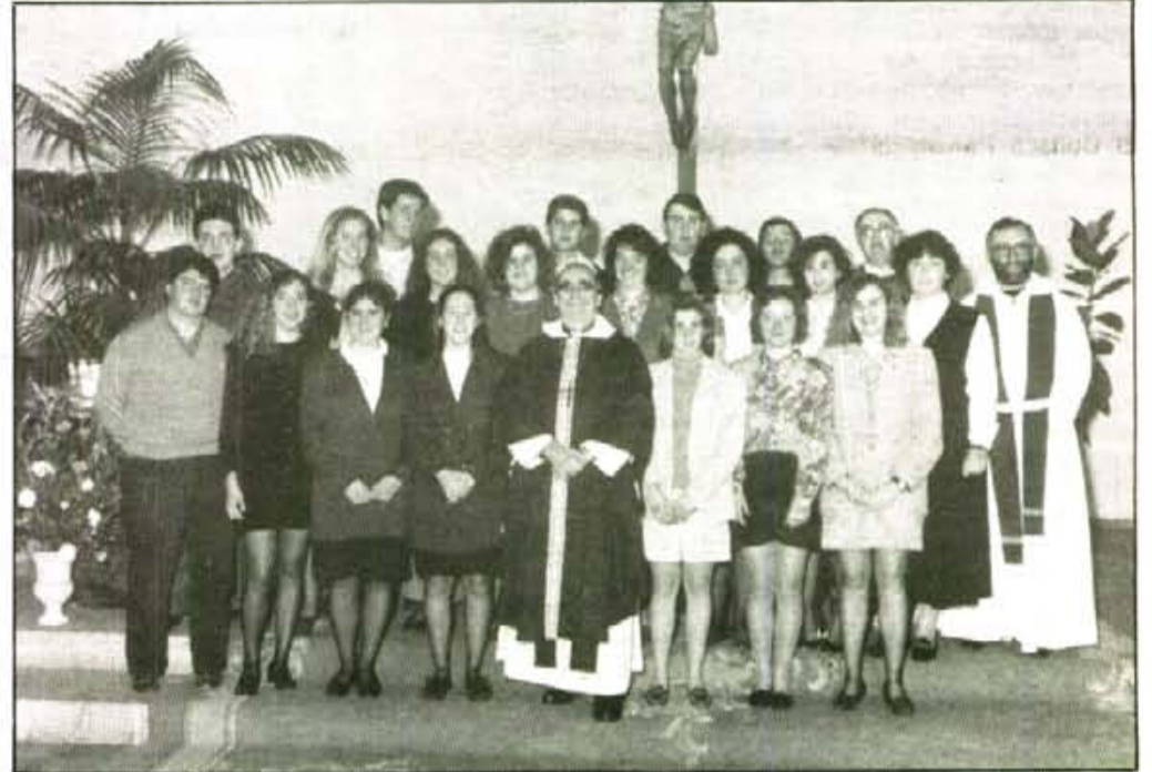
Durant la visita pastoral, el bisbe de Mallorca confirmà 120 joves sollerics. A la fotografia tenim els confirmats al Port