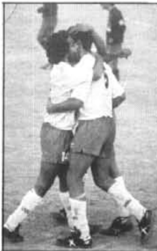
Aquesta escena es repetí dues vegades.