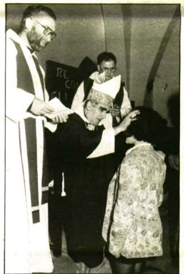
Els joves, agenollats davant el bisbe, rebien així el do de l'esperit