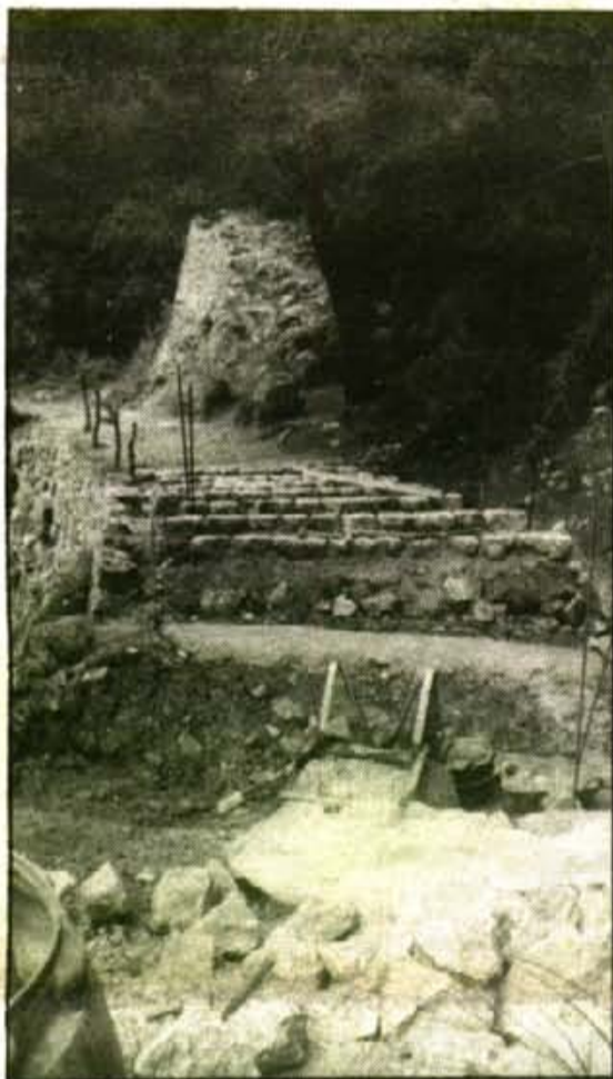
Amb els escalons de cinc cm. d'alt, podran baixar cotxets d'infants, minusvàlids, i els vehicles encarregats de la neteja

Aquella iniciativa va ser avortada per la suspensió del planejament urbanístic decretada pel Govern Autònom i per la posterior entrada en vigor de les Normes Subsidiàries, el maig del 1990, que decretaven un major grau de protecció per aquells terrenys. El Catàleg d'Espais Naturals, recentment aprovat pel Parlament Balear, ha fet possible la construcció d'aquests xalets a Sa Talaia, tot i que els grups del PSM i del PSOE proposaren que no s'hi pogués construir res.