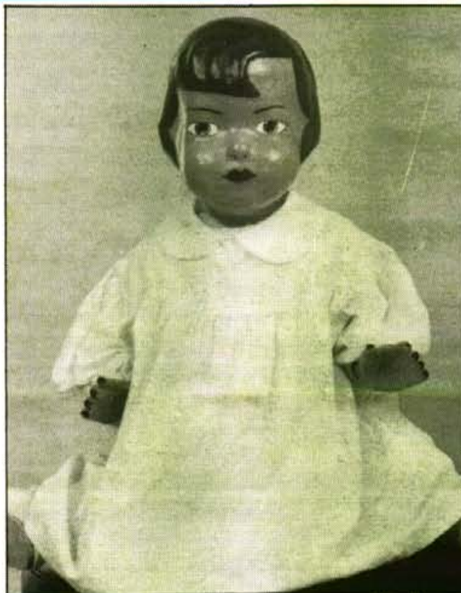
"Hi havia cinc motllos de pepes diferents, de tamany i forma"