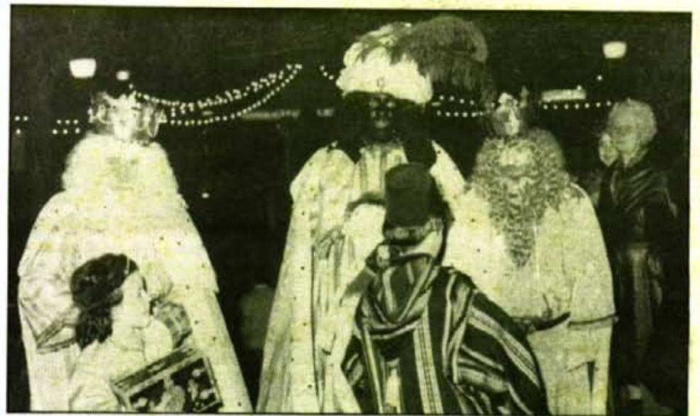
Arribaran al Port a les quatre i mitja del capvespre i seran a Sóller a les set i mitja.