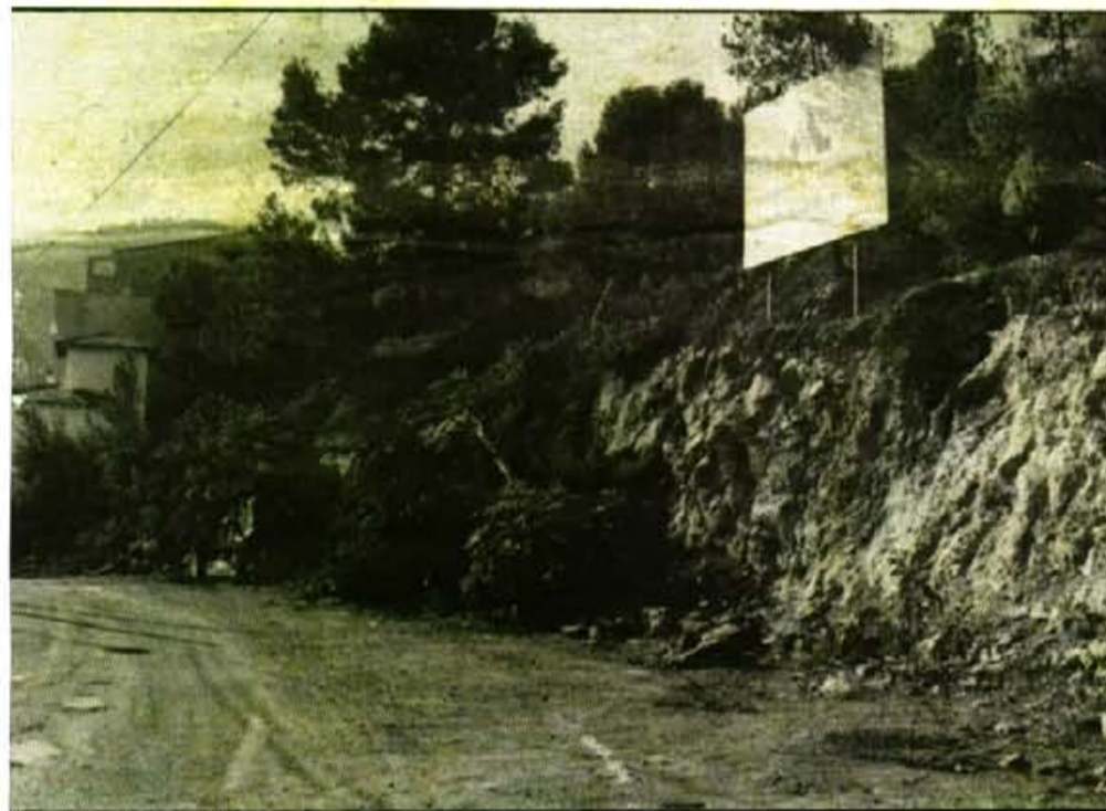
La S.A. Platja Nord pretén construir un complex d'edificis destinats a vivenda

Fins i tot sembla existir un document notarial que confirma aquest extrem.