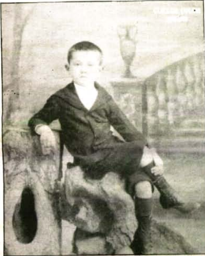
La Conselleria de Cultura ha dedicat íntegrament el número 35 de la revista "Estudis Balearics" al poeta sòller.

El passat dia 24 de desembre es commemorava el centenari del neixament del poeta, traductor i dramaturg sòller Guillem Colom i Ferrà, últim representant de l'Escola Mallorquina. Per celebrar aquesta fita, la Conselleria de Cultura del Govern Balear va dedicar un número íntegre de la revista Estudis Balearics al poeta sòller, sota el títol Guillem Colom. 1890-1990 . La revista conté una part ben representativa d'articles, estudis i entrevistes relatives al poeta a més d'algunes biografies i notes bibliogràfiques.