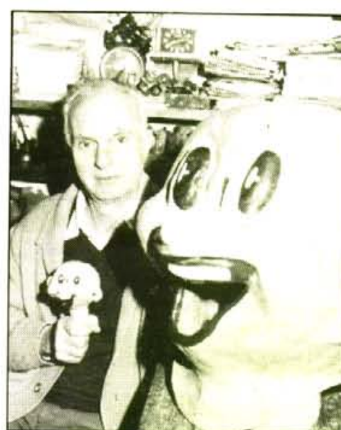
"Amb paper i pasta feta amb farina omplia els motllos de les cares"

"Vaig arreglar els antics caparrots de l'ajuntament, i també el personatge-cuiner de Can Generós"