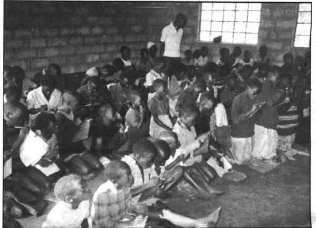
Els infants de l'escola de Maramuya (Burundi) reben les primeres lletres agenollats en terra.

Esperam que el bon sentit de l'humor dels sollerics contribuís a cercar i trobar, en el seu moment, totes aquestes informacions.