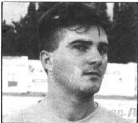
Suasi, intentarà que no es compleixi el pronòstic.

El Sóller ha de rompre d'una vegada l'increïble ratxa negativa de camp contrari. Mai és fàcil dins Alaró, però enguany si que podriem dir allò de "o ara, o mai". Es la gran ocasió.