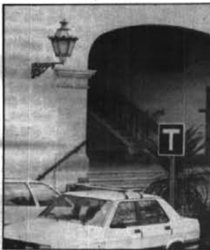
La nova llei perjudica als taxistes sollerics que sols poden prendre clients de dins el municipi.

A més d'això, la implantació d'aquesta llei s'ha realitzat sense reconversió de cap tipus i sense complir la disposició segons la qual els "coches de alquiler con conductor" han de ser vehicles de gran luxe i han de disposar de garatge propi".