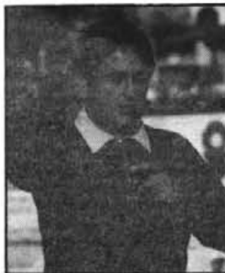
Aquest bergant empenyà tot Déu.