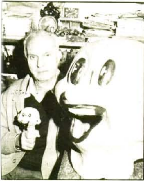
"Na Mari-Lo era la pepa més coneguda per les nines de Sóller"

"Vaig deixar de construir juguetes quan aparegué el plàstic"