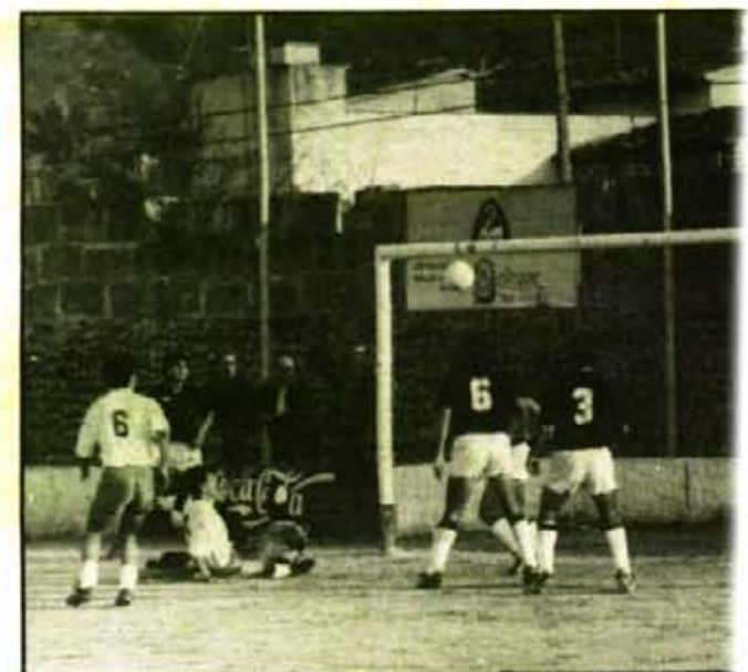
L'onze de Nico López va fer mèrits sobrats per derrotar el líder. Martín rematà al travessar al minut 14.

La segona volta comença aquest diumenge de Reis, amb un Alaró-Sóller del tot esperançador. L'equip de la Vall, que viatjarà acompanyat de molts seguidors, és el favorit per pot bé que rodin les coses. Arbitrarà el bunyolí Cabot Payeras.