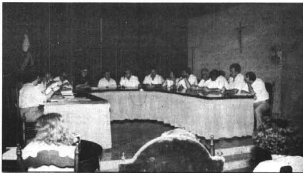
Amb un altre préstec de 20 milions, l'endeutament municipal arribarà enguany al 20%.