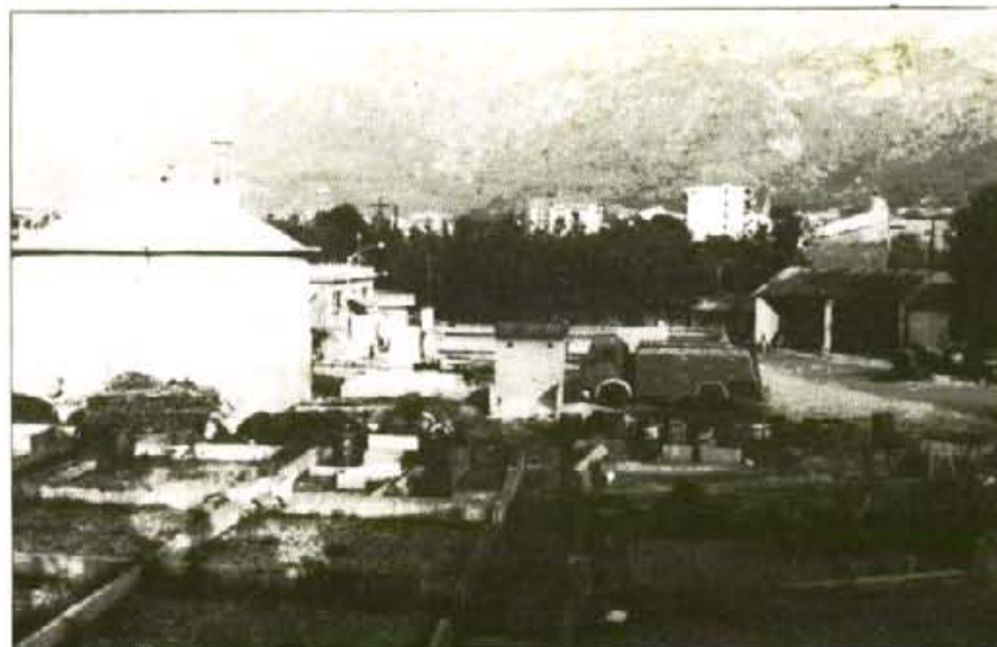
Fornalutx decidí a solucionar el problema de les seves aigües brutes, duquent-les cap a Sóller

En conseqüència, en el Ple ordinari del dia 4 de juny el Consistori fornalutxenc acordà, per unanimitat, sol·licitar el punt de vista de l'Ajuntament de Sóller respecte a la possibilitat de connectar les aigües brutes a la futura xarxa de Biniraix i, d'aquí, conduir-les directament a la depuradora que s'ha de començar a construir. En el cas que les negociacions ambassin a bon port, s'hauria de signar un conveni de col·laboració entre els dos Ajuntaments, amb la finalitat que Fornalutx contribuís a la financiació de la nova depuradora i a la seva conservació i manteniment.