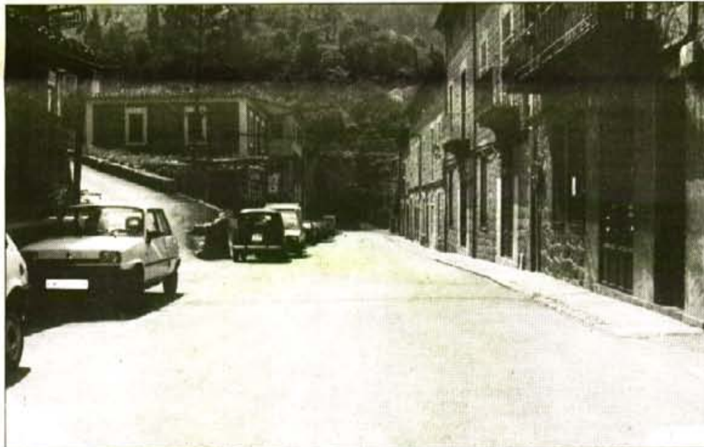
S'han de diversificar les zones de serveis (comerços, bars...) per evitar que Deia sigui sols el boci de carretera.

dre el pèl. Els turistes venen en autocar, i no és lògic prohibir la seva presència taxativament. P. —Però els autocars venien per un assumpte molt concret, no? R. —Sí, el fet és que dos hotels de Deia han sortit a seqüències d'una sèrie de televisió alemana, "Paradise", i aquí s'ha d'afegir que segurament les companyies que exploten aquests hotels segurament hauran cobrat lo seu. P. —Que ens vols dir amb això? R. —Simplement que no es pot treure la gent defora, involucrant al consistori. L'Ajuntament no se pot "vendre" a dues companyies hoteleres. Aquest tema és motiu de Moció de Censura . P. —I els problemes de circulació dins els casc urbà? R. —En primer lloc hi ha déficit d'aparcaments però no