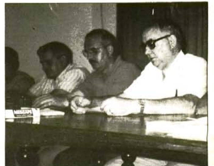
El Sóller pot ser l'únic club sense déficit de la Tercera Balear.