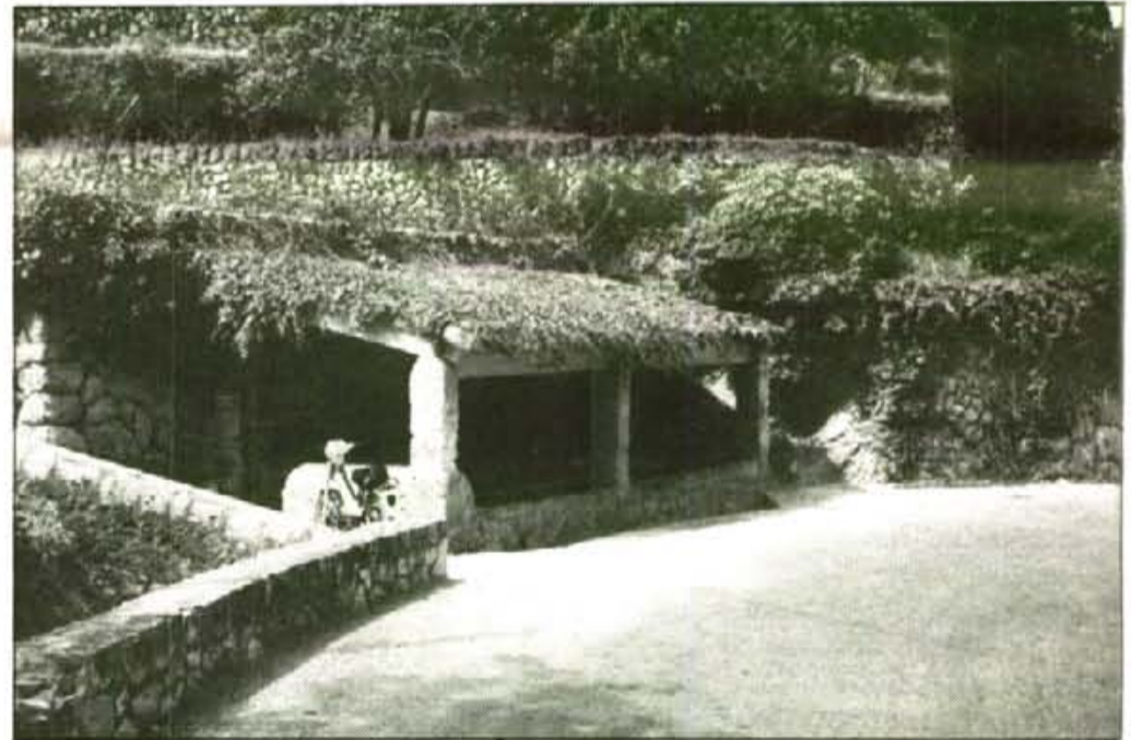
Molt d'edificis i construccions del terme municipal s'haurien de catal·logar.

R. —Veig una política pseudo-proteccionista, on no es veu cap dur per a les zones naturals . No s'ajuda a les finques i es provoquen dues coses: s'abandonen o s'especulen amb elles. Hi hauria d'haver fondos de compensació, i a