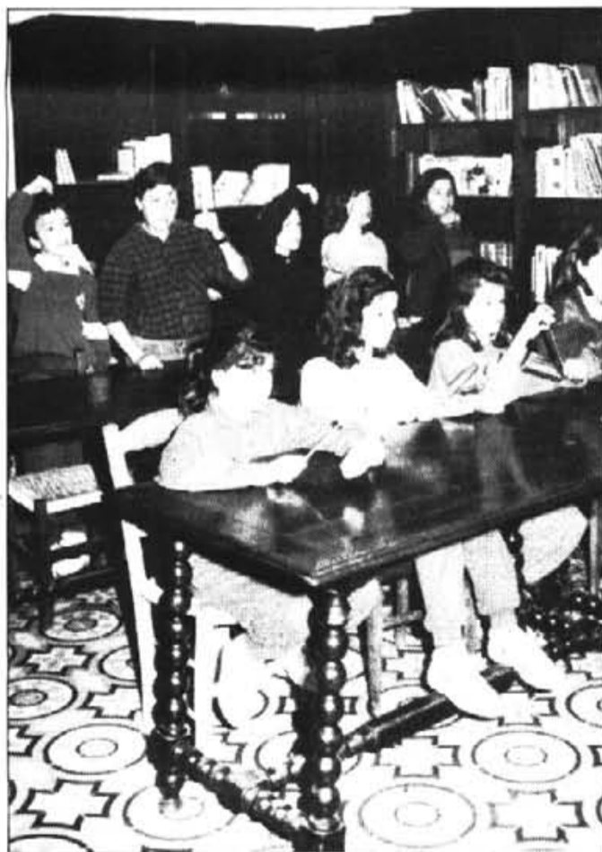
El concert serà a les set de l'horabaixa

Per una part servirà per poder combinar millors els horaris de l'escola, i per l'altra servirà per poder deixar estudiar als alumnes que a casa seva no disposen d'aquest costós instruments.