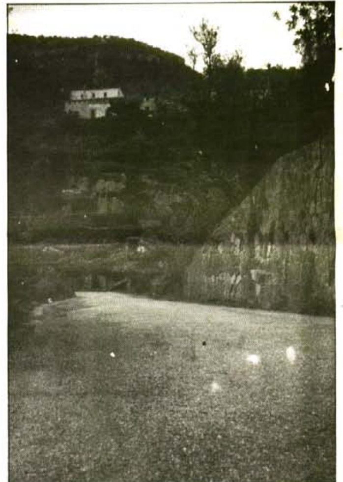
Els sollerics han de lluitar per la carretera Deia Sóller. Les animalades més grosses es fan dins el seu terme