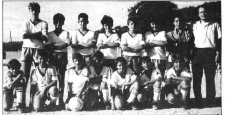
La bona tècnica individual del Sollerense, el més destacat.