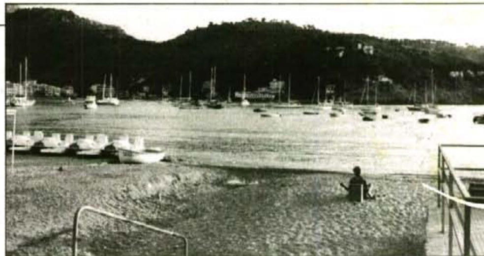
La Comunitat Autònoma vol participar en l'execució d'un nou projecte d'embelliment de les nostres platges

El conseller afegí que la Comunitat Autònoma donarà prioritat a l'execució d'aquest nou projecte "dins allò que el Parlament ha considerat el