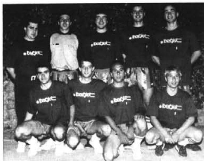
Viajes Sóller equip guanyador amb molta diferència