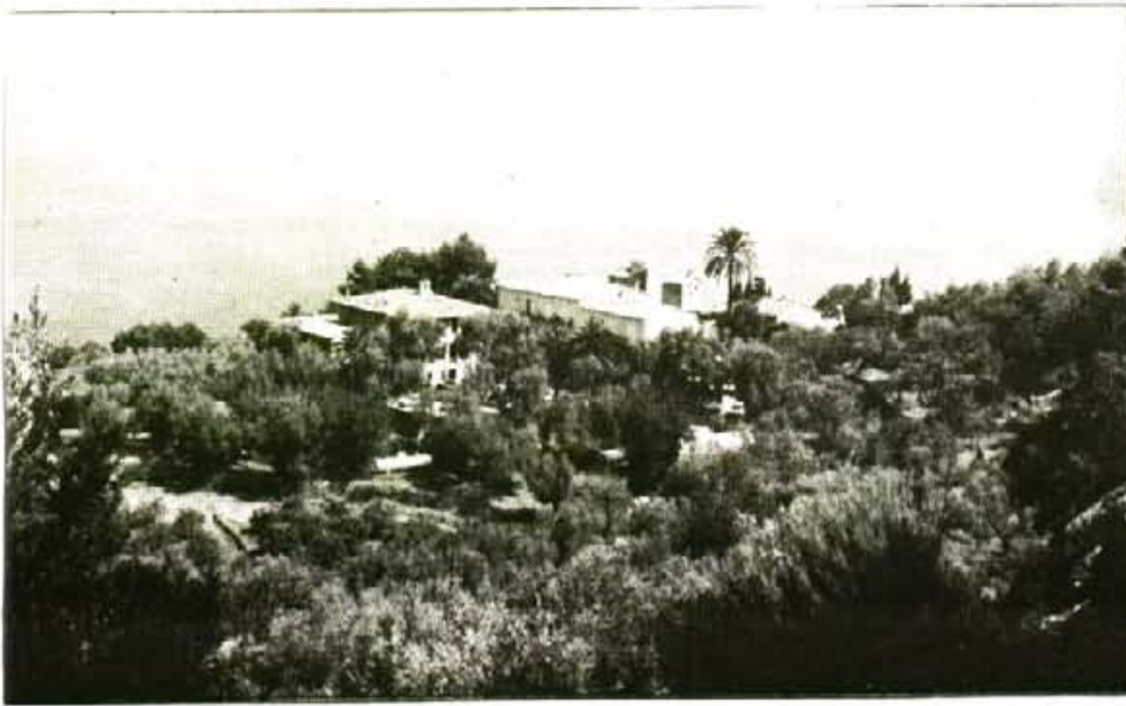
Si el consistori hagués volgut, el camí de pas cap al Canyaret ja seria públic.

tres alternatives de tipus turístic, com el foment del "turista de bota", de caminar.