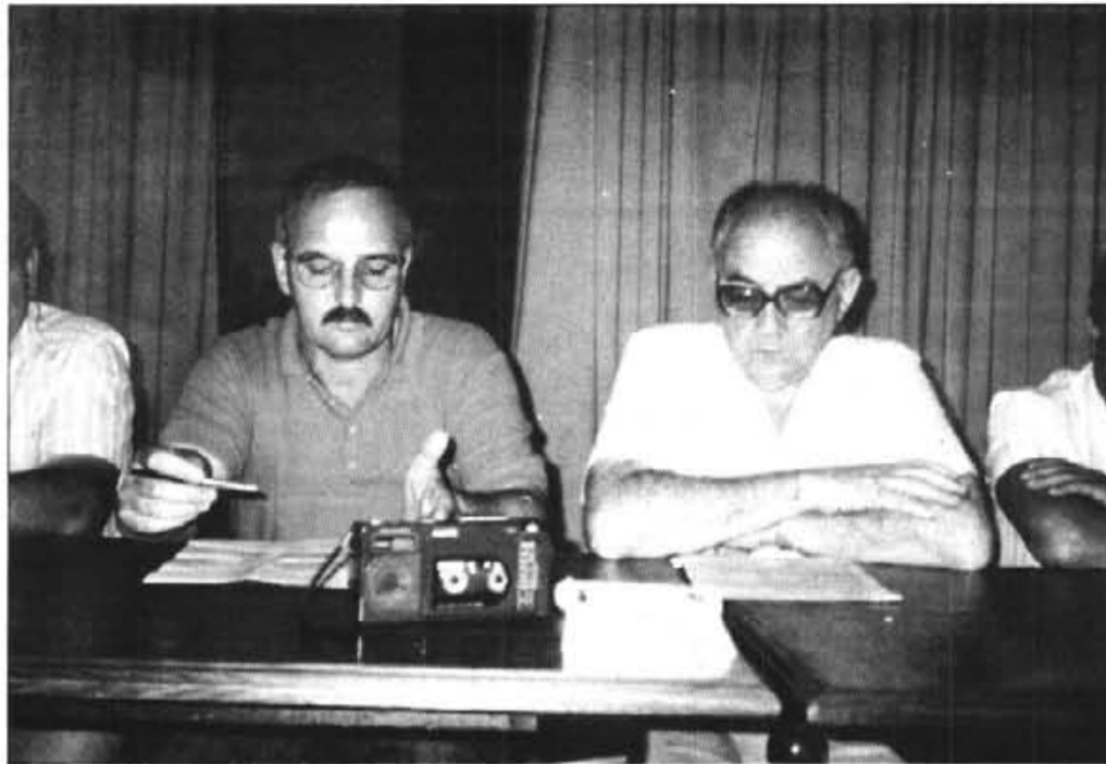
SALUT ECONOMICA. Amb un C.F. Sóller sanejat, s'obri un futur plé d'il·lusions i d'esperances. L'iminent temporada 90-91 pot significar l'enlairament esportiu de la primera entitat futbolística de la Vall. (Foto T.O.).

El motor d'un club, l'economia, reneix sanejada després d'un grapat d'anys en el C.F. Sóller. Amb la base financera virtualment a zero, es possible invertir a un pressupost rècord (uns 14 milions), i construir un conjunt notablement ambiciós. Aquest exercici a punt de finalitzar, i tenguent amb compte que es va partir amb un dèficit clar, s'ha equilibrat la partida, amb gairabé dotze "quilos" de pagaments complimentats. Pel demés, un compàs d'espera en el tema de fitxatges. A partir del dia 30 de juny, hi haurà notícies concretes.