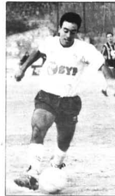
Edu diu convençut: "Estoy encantado en Sóller. No habrá problemas para renovar".