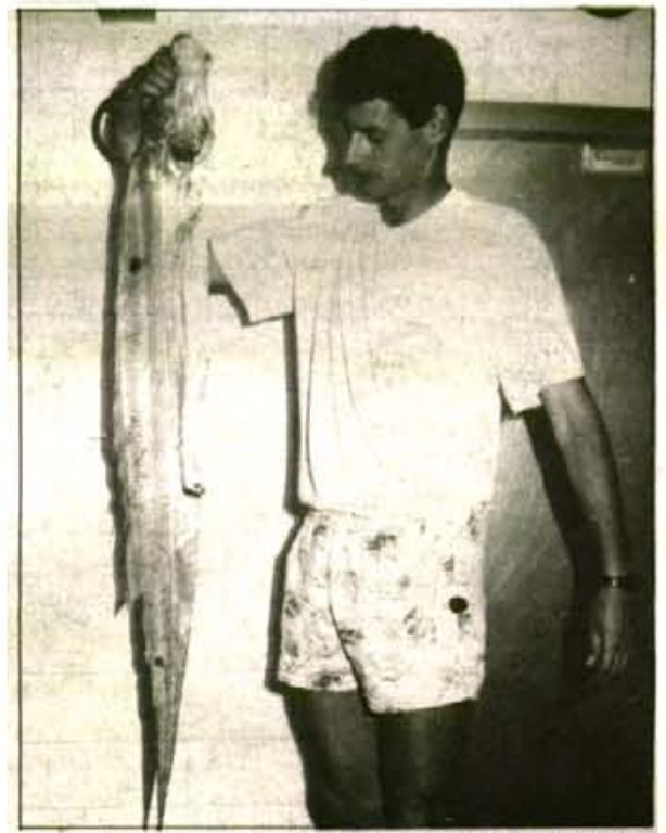
Fou pescat amb La Pascuala. Té un metre i mig de longitud i sols pesa un quilògram.

L'exemplar pescat, i que tenim a la fotografia, té una longitud d'un metre i mig i tan sols pesà un quilògram.