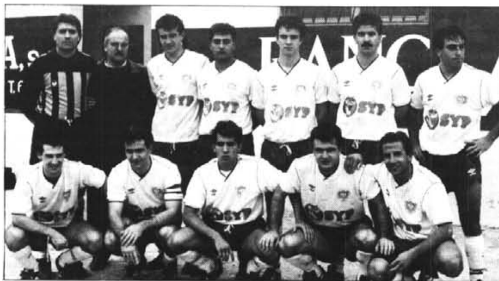
UN ANY MES A TERCERA. Molt més aviat del que es podia pensar fa unes setmanes, el C.F. Sóller, després del 1-0 de diumenge, seguirà militant a la Divisió Nacional. Ha estat una temporada plena d'entrebancs, però al final s'ha pogut esquivar el sempre fatidic descens. Enhorabona a tots, i cara al futur, que les coses es planifiquin millor. De les lliçons, sempre s'ha de aprendre. (Foto Sampedro).

El primer apropament perillós, el protagonitzar Lozano qual sol davant Bernat no aprofità l'ocasió el porter sollerica va ser molt portu allunyant la pilota amb les ams.