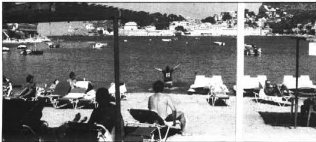
El problema més greu que han d'afrontar els hotelers és el de la renou de les màquines excavadores i picadores.