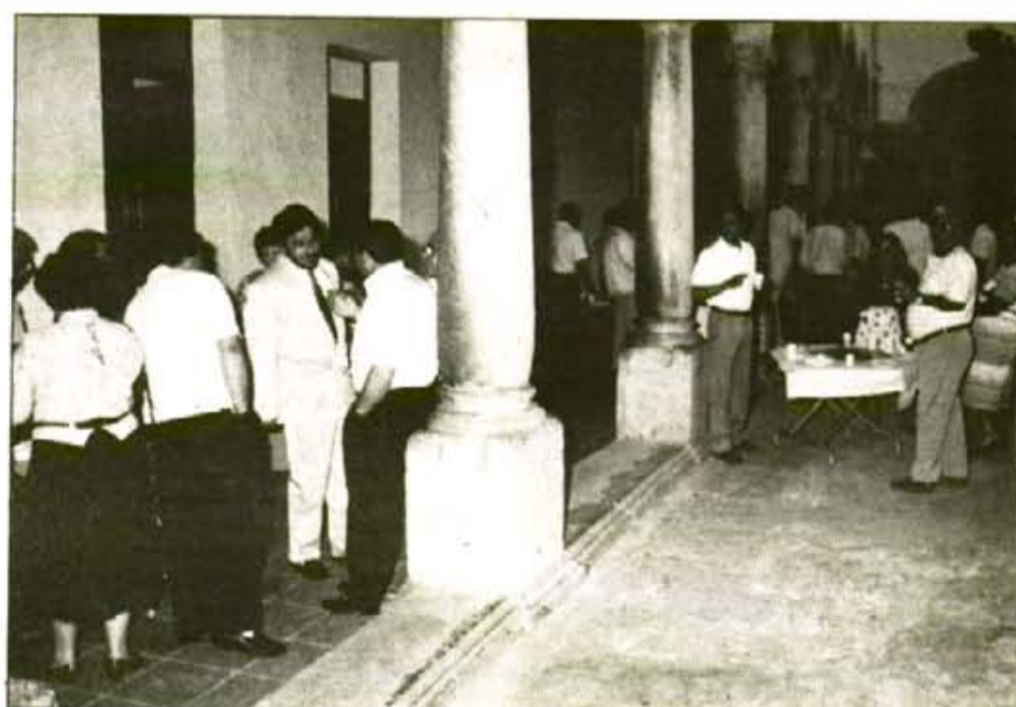
El vi espanyol es celebrà al claustre del Convent

A principis de maig del 1989 es constituí a Sóller la Comunitat de Béns "Premsa Lliure", formada per quatre antics col.laboradors del Setmanari "SOLLER", ben aviat reduïts a tres, amb l'única finalitat d'editar un Setmanari Independent d'àmbit comarcal, que recollís l'actualitat dels municipis de Sóller, Deià, Fornalutx i Escorca , i amb dos objectius ben clars: