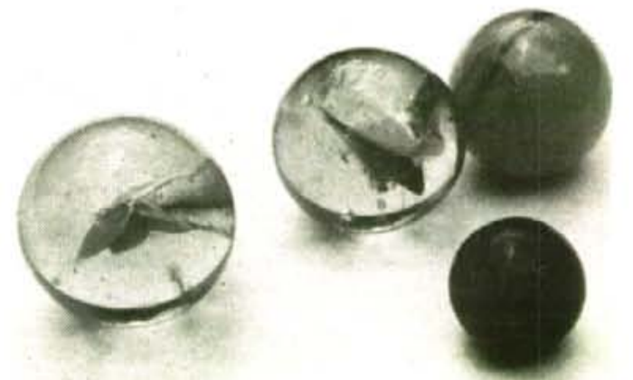
Ses vidrieres més grosses: bòtils, boriombos i coyotes.