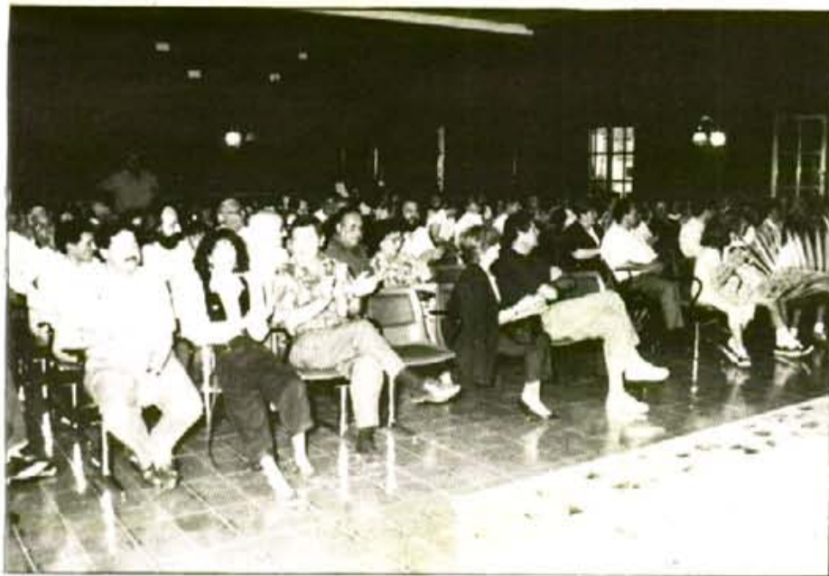
Públic molt divers acudí a l'acte celebrat als Sagrats Cors

Des d'aquí vull donar les gràcies a tots els que ajuden i formen l'equip de redacció. Moltes gràcies.