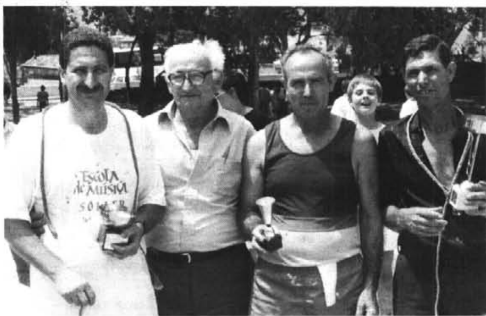
A més de les categories federades hi haurà una prova per els foners locals i una per els escolars.