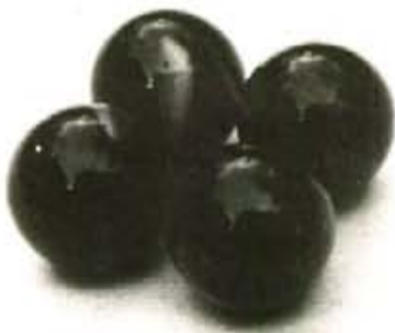
Ses vidrieres han substituït a ses bolles de fang

En aquets joc hi poden participar un mínim de dos jugadors i un màxim de vuit. S'ha de cercar un lloc pla, de terra o asfalt. Després de marcar es cap de joc amb un rotlo i una retxa, es jugadors estimben i per rigurós ordre se comença a jugar. Cada un sempre empra sa mateixa bolla per tirar. Aquesta no se guanya ni se perd, ses que sí ho fan són ses bolles que se col·loquen dins es rotlo. Es joc consisteix en tirar des de sa retxa cap en es rotlo i procurar treure a fora ses bolles que hi ha dins. Si se fa així, es jugador se queda amb ses bolles que ha tret. I segueix tirant fins que falla. Lo mateix faran ets altres jugadors. Si un, mentre tira, topa o fereix sa bolla d'una altre jugador, el mata, i se queda amb totes ses bolles que hi ha dins es rotlo, i així guanya es joc. (Des treball de Francisca M. Riera).