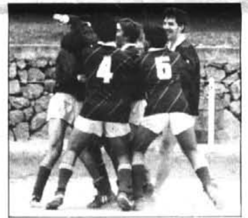
Una imagen que ya empieza a ser familiar.

De principio a fin del encuentro se notó la superioridad de los del Port, al descanso se llegó con un (0-1) para en la reanudación que- dar las cosas aun más claras.