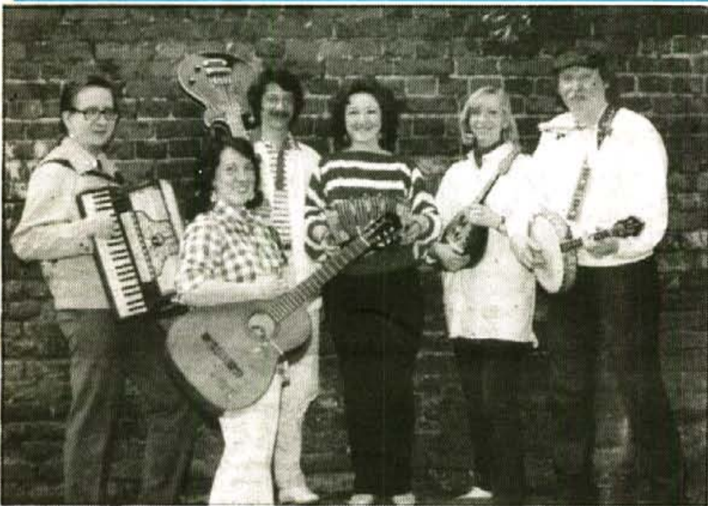
Realitzarà actuacions a Palma, Deià i Sóller