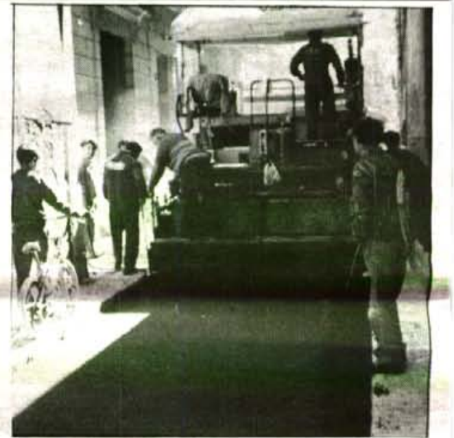
El que s'a fet es pujar les voreres, han asfaltat, s'han fet uns evaquadors d'aigües de pluja que van directament al torrent, i s'ha passat una línia d'electricitat per poder connectar uns semàfors.