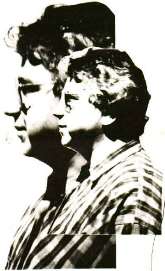
Voldria que el Museu de Ciències Naturals fos prest una realitat