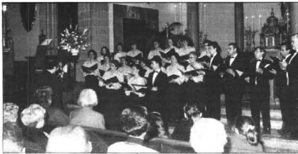
Les cantants de la Coral mostraren el nou vestuari.