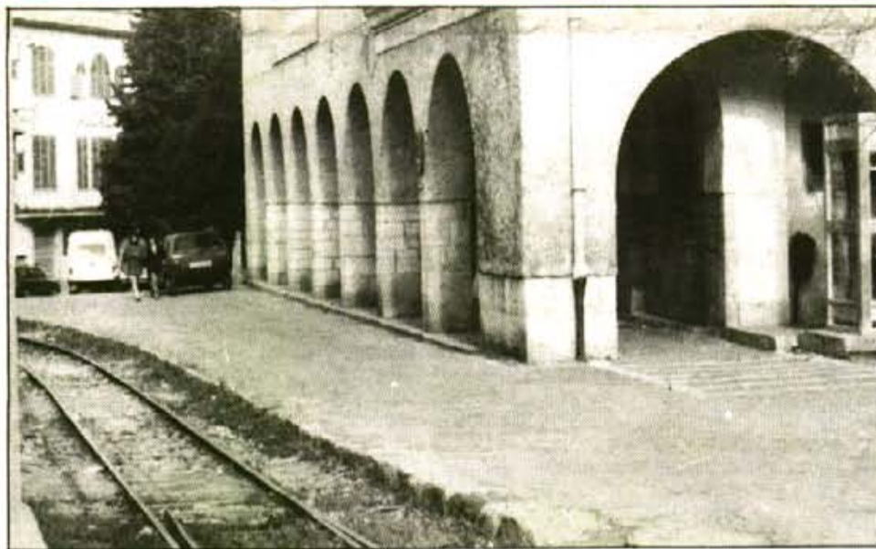
La nivellació del trispol del carrer amb la via evitarà nombrosos accidents.