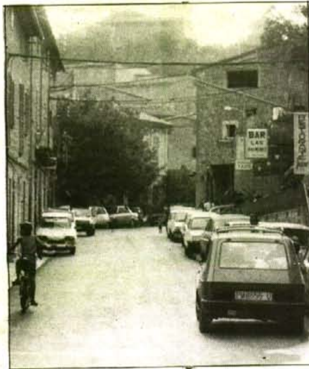
Problemes amb els autocars en els carrers de Deià.

Seguin amb el mateix tema, el Batle digué que estava disposat a aplicar les sancions administratives màximes que li atorguen les noves normes de circulació. "Senyalitzarem convenientment la via pública -ens digué Salas- amb nous discs que prohibeixen l'aparcament, i aplicarem sancions que poden arribar a les 50.000 ptes."