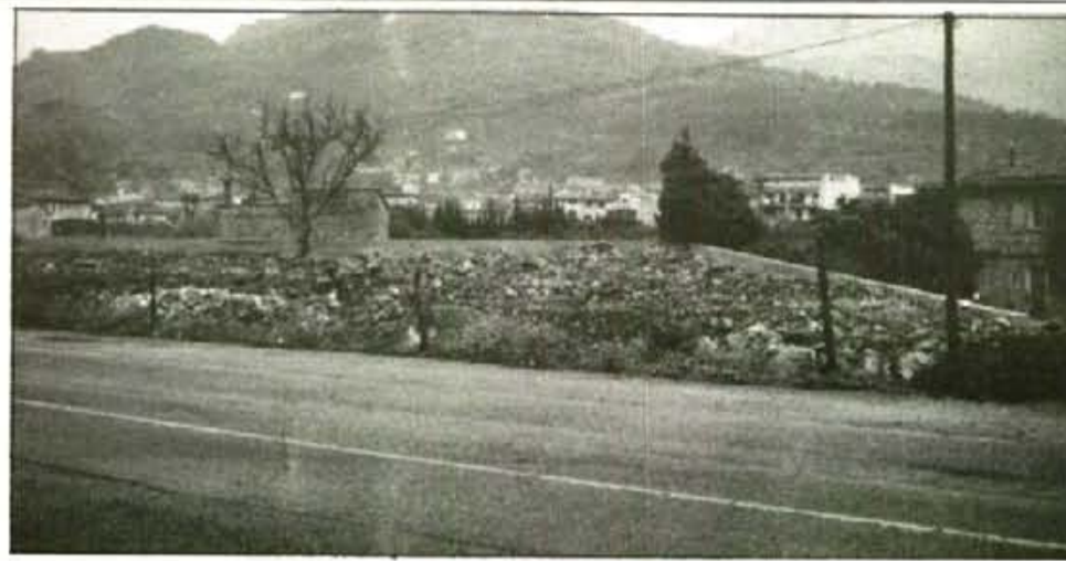
Les obres de la benzineria hauran d'esperar que es revisi el Pla d'Ordenació.