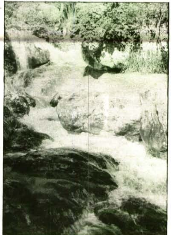
El torrent tema segur dels artistes

Dia sis es lliuraran i entregaran els premis i fins el 15 de maig estaran a la capella de Ses Escolàpies, perquè durant tota la setmana de Sa Fira puguin ser motiu de la visita dels interessats.