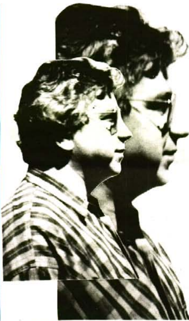
Estudia el càncer de colon, dins l'àmbit de Mallorca