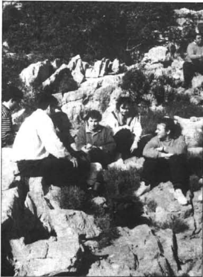
Molta gent s'apuntà a la darrera excursió al Puig Roig.