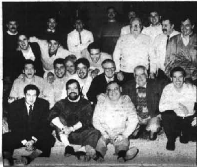
Tots els companys de treball volgueren estar presents a l'homenatge.

Per tal motiu, el proper diumenge el C.F. Sòller li retrà un homenatge en el transcurs del qual tant el club com "Veu de Sòller" li faran entrega de sengles plaques commemoratives, en consideració a la seva tasca informativa.