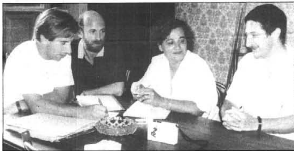
La gent del Esport Escolar treballa intensament