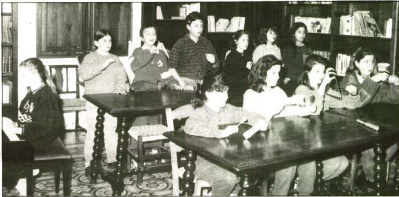
La I Trobada d'Instrumentistes Infants es farà demà a Sóller