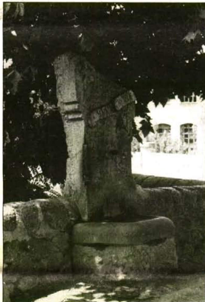
Les fonts públiques i els grifons de les cases podrien deixar de rajar si continua la sequera: el Port en seria el primer perjudicat.

■ Més diner per a l'educació , i manco per armes i banquers.