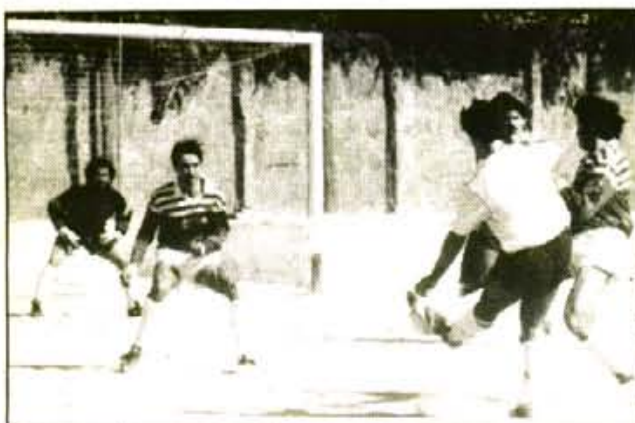
Tota l'emoció que proporciona el futbol, serà present a Can Maiol en l'apassionant Sóller - Poblense.