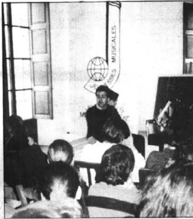
Els concertistes donaren bones explicacions als joves estudiants.