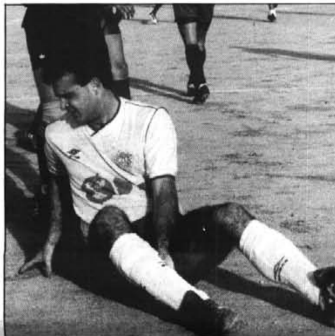
Com és possible que Caballero no assenyalés un penal tan clar com el que feren a Miralles?

Amb un gol a favor, i amb un equip que tanca molt bé els espais, el Cala Millor ja havia fet lo importat: obrir la barraca contrària abans del descans. Això li va permetre jugar a lo pràctic, sense arriscar, tot al contrari del Sóller que va haver d'obrir línees, deixant lògicament forats, un d'ells aprofitats per G. Riera al rematar de cap al segon pal. El partit semblava decidit. Dues magnífiques aturades de Pep Bernat. Una clara opció de Bus-si i una treteta de falta a l'interior de l'àrea, desaprovechada pel