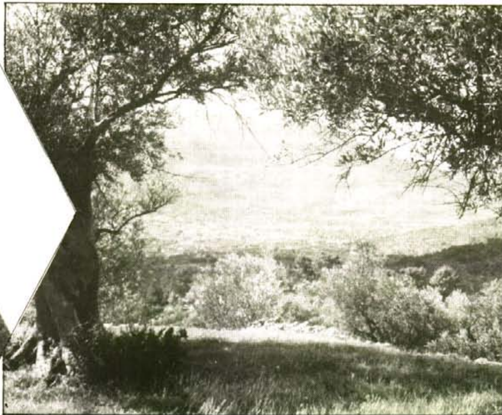
Si no s'aproven mesures urbanístiques restrictives, veig difícil que permetin conservar l'entorn