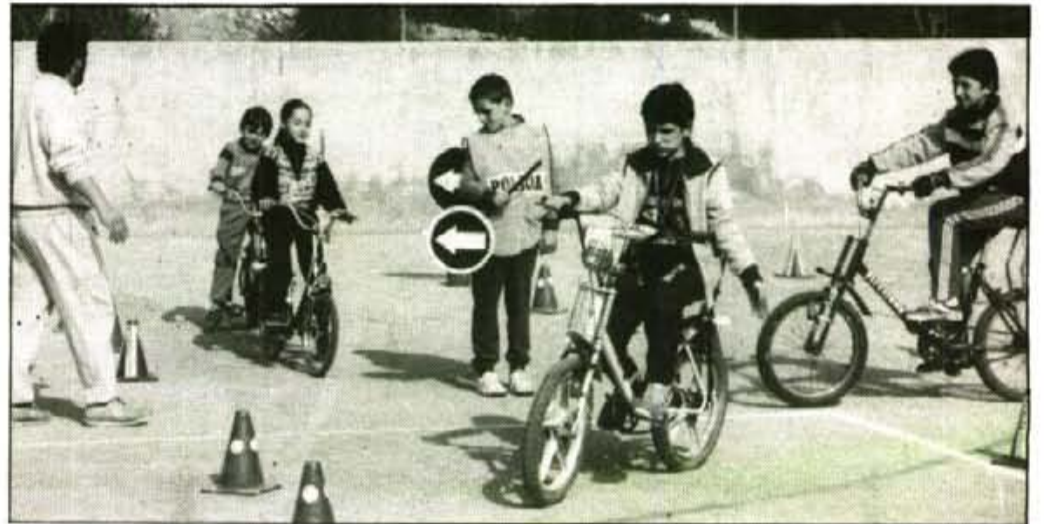
La Policia Municipal ha rebut una subvenció per organitzar curssets informatius

Tota l'organització d'aquestes activitats està realitzada per al Policia Municipal que entre d'altres fites, preten educar en els aspectes bàsics per al desenvolupament dels nins d'avui i homes del demà.