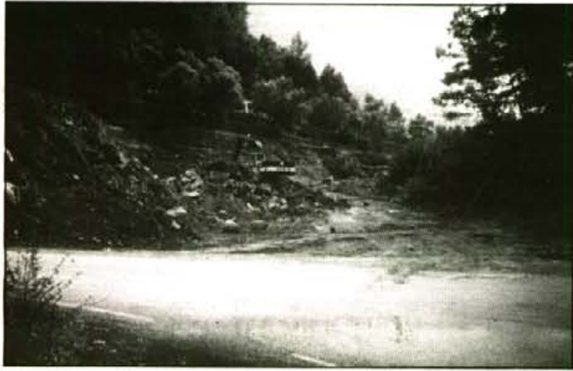
Des del dia que fou cremada una de les màquines, uns guardes contractats vigilen dia i nit les obres a la banda de Sòller.

L'Ajuntament ingressaria uns 40 milions de pessetes