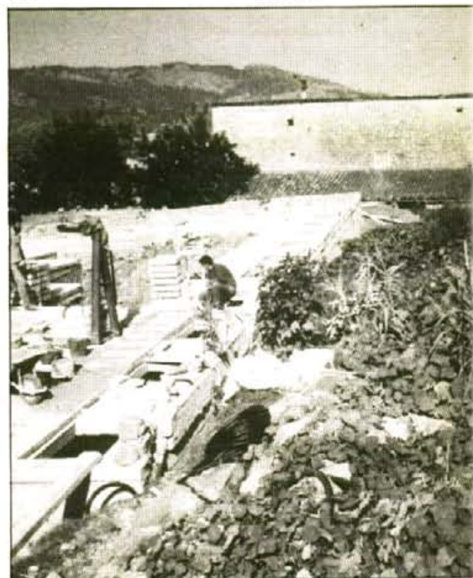
Aquest és l'estat actual de les obres del Cementiri. A la dreta es veu el tros de solar on es construiran els nous nínxols.

Així les coses, sembla que l'Ajuntament acceptarà la proposta del contractista subscriurà un conveni amb el per tal de fixar les contrapartides, que bàsicament consistiran en retenir-ne la titularitat municipal i limitar el preu màxim de venda de les noves sepultures, que es situarà al voltant dels dos milions de pessetes.