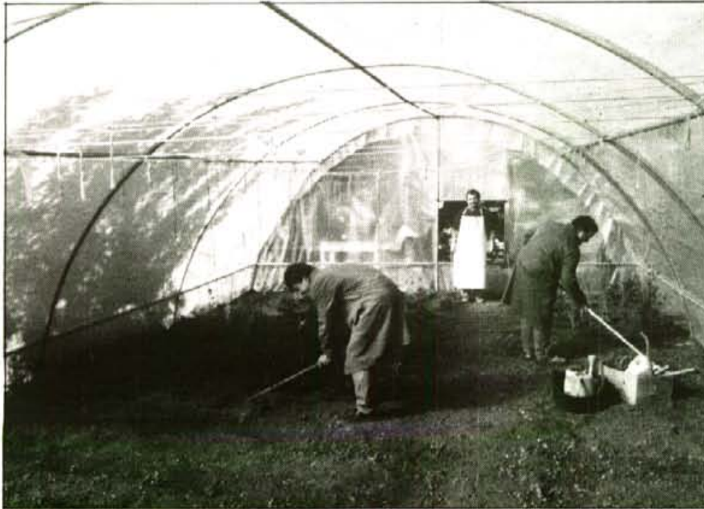
Els minusvàlids treballen i estan ben atesos. Malgrat això, hi ha famílies que no accepten dur-hi els seus fills.

R. - La idea del centre és fomentar hàbits de treball i de comportament que facilitin la integració social del minusvàlid. Per aconseguir, actuam en dos camps: teràpia ocupacional (reeducació a través del treball), socialització i culturalització.