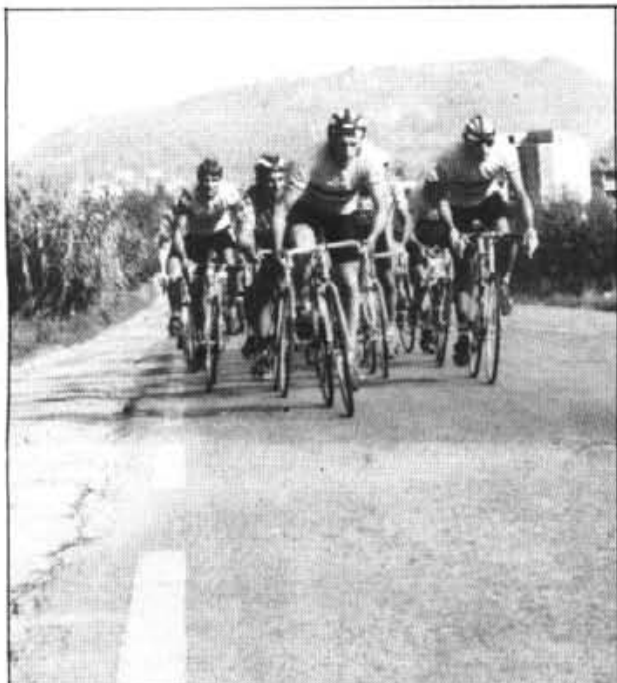
Clar domini austriac a la segona cursa de la temporada