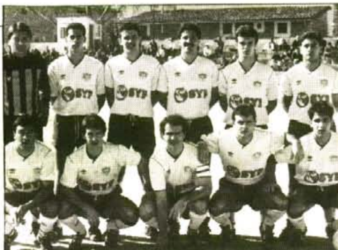
L'onze inicial, probablement serà el mateix que va golejar fa dues setmanes al Lloseta.