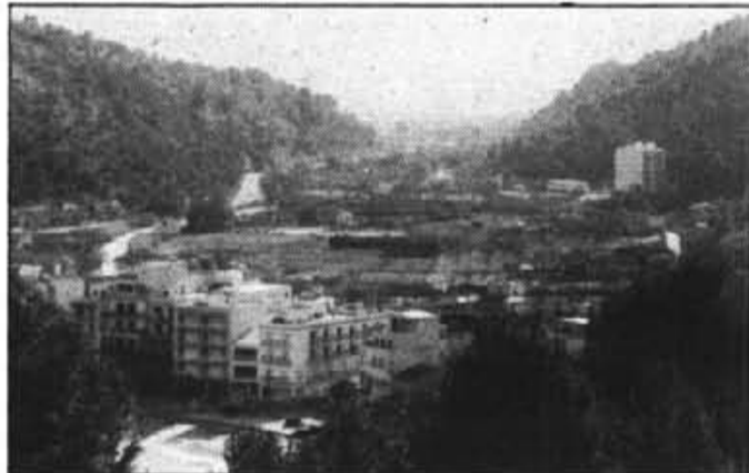
Darrera la línia d'hotels de la platja es construirà un vial. La resta no serà urbanitzable, però ¿No Programat?, ¿Agrícola-ramadera?

■ Des de la urbanització Costa Brava de Muleta i la urbanització Can Joy, en línia recta cap a les cases de Muleta Gran, fins a la línia de la urbanització dels Béns d'Avall, incloent tota la costa des del torrent de s'Argentera cap al Cap Gros fins a Alconàsser.