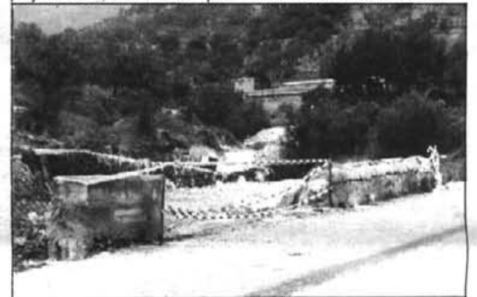
El túnel, proper tema des verds.

Estau convidats a participar—hi tant dones, com homes, joves i joves, especialment tota persona sensibilitzada no tant sols pel pacifisme i l'ecologia, sinó especialment per una major i millor qualitat de vida, tant del medi ambient i consum, com de les relacions humanes.