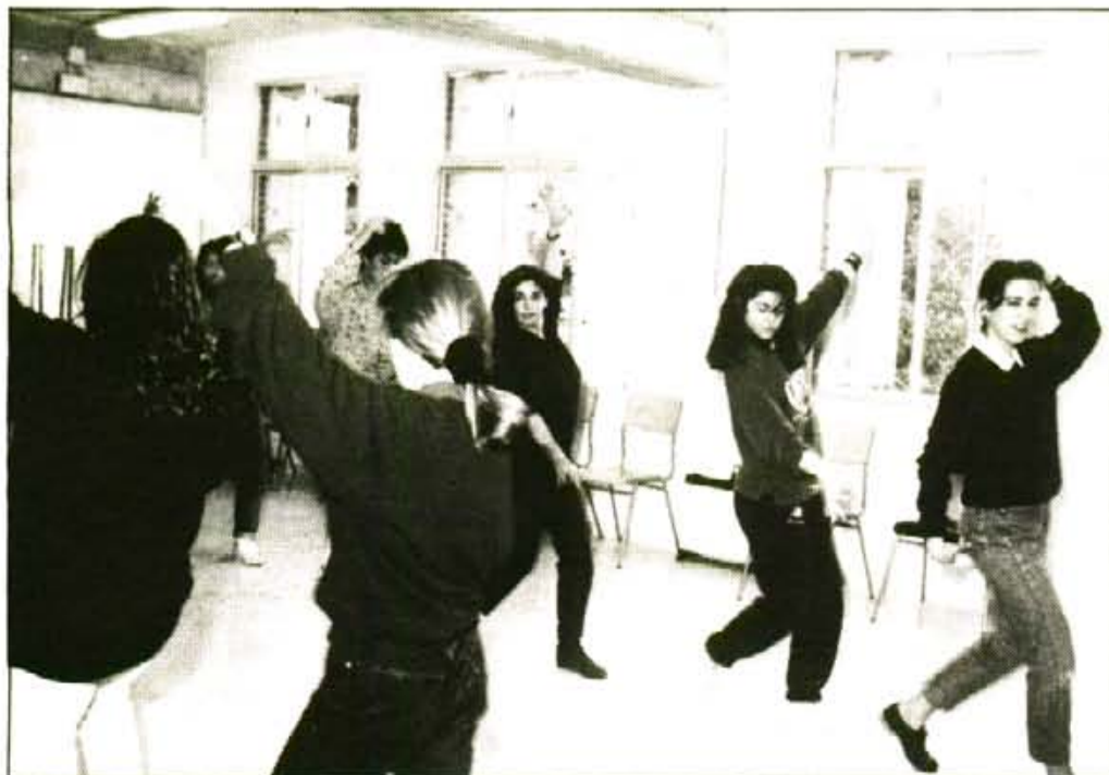
Alegria, sevillanes, moments de ball i esbarjo.