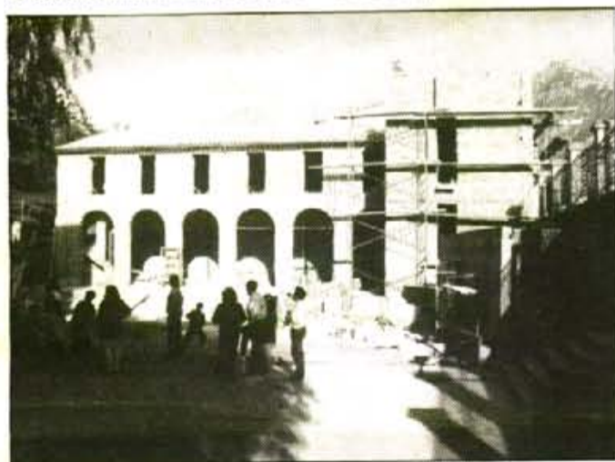
Les obres han avançat a un ritme lent, però s'espera que a finals d'any es puguin inaugurar.

La calefacció serà instal·lada per l'empresa Juan Mora Alberti, i comptarà amb una caldera de gasoil de la casa ROCA, model GO-50/35T, amb un dipòsit de 3.000 litres i un total de 186 elements de calefacció que alimentaran un total de 18 radiadors. El seu cost aproximat serà de 1.200.000 ptes.