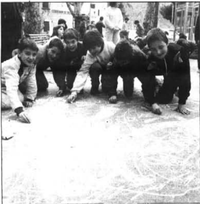
Els infants, receptius als drets humans.

Al demana als joves i professors interessats a rebre informació sobre la xarxa d'apellants i/o sobre la guia didàctica que s'adreça als grups d'Al, carrer Sant Guillem 26, Palma, o a l'apartat de correus 50.318 de Madrid.