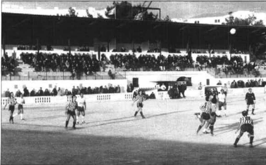
La presió solletrica a la segona part, fou asfixiant. Es pot veure una magnífica tribuna del camp de "Los Pinos". Si les previsions no fallen (ni l'Ajuntament tampoc), a Can Maiol hi haurà la temporada que ve, una instal·lació molt similar.

Cal dir en primer lloc, que l'Alaior ens va causar com a conjunt, una magnífica impressió. Jugades començades des de darrera, al primer toc, per les ales, amb notable tècnica individual, i