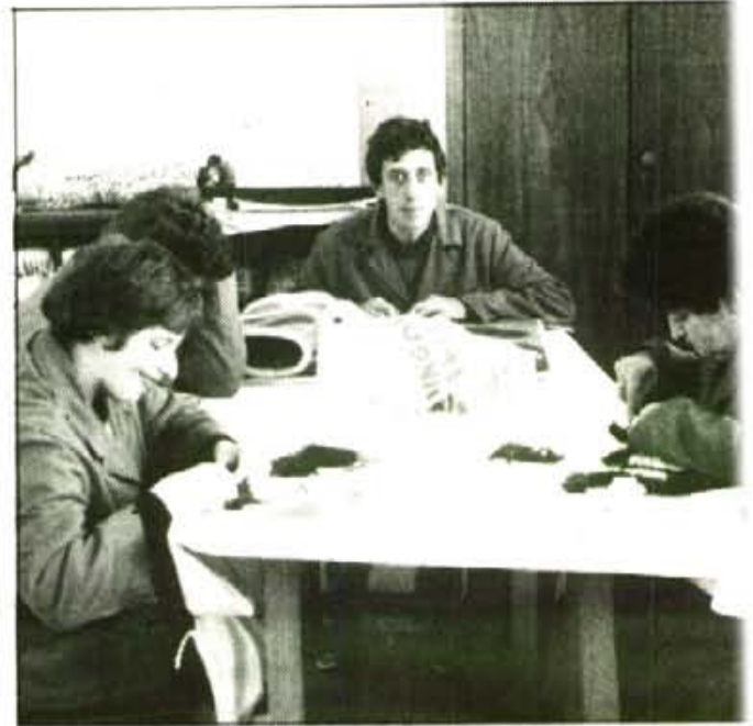
La Comunitat Autònoma, INSERSO, l'Ajuntament, Sa Nostra, el CIM i els socis d'ASANIDESO, financien el taller.

R. - Si, per exemple, han confeccionat capells i trompetes per l'empresa Eurocamavales. Fan servilletes encarregades per la fàbrica Mayol, i durant un temps omplien capses petites de material que s'havia de comptar (endolls, taxbes...) per la ferreteria Bernat.