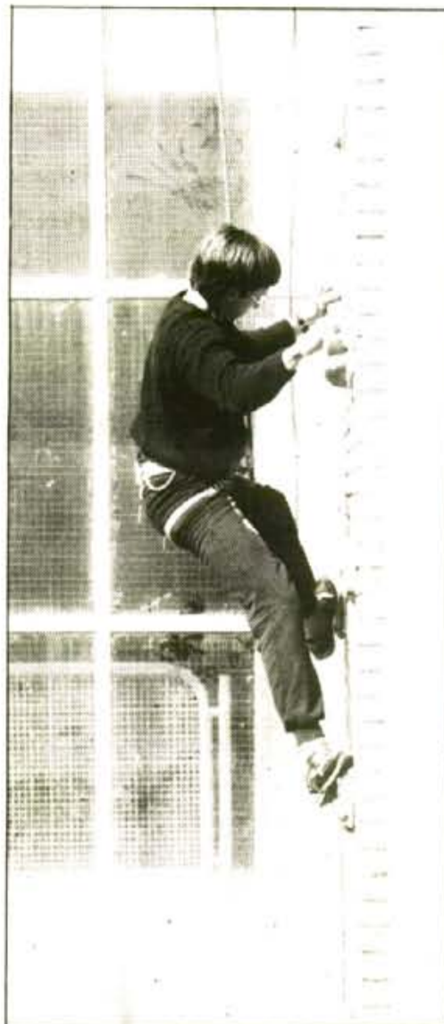
Espectacular imatges d'escalada, a les parets de l'institut.