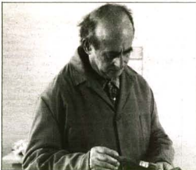
Molt prest es renovarà tot el mobiliari del local de Ses Marjades.

R. - No gaire, no. Necessitam una extensió de terra, amb aigua per regar, que podria deixar-nos el Ajuntament o arribar a un acord amb qualsevol propietari. Llavors, podrem elaborar un projecte que la CA i INSERSO hauran d'aprovar i subvencionar.