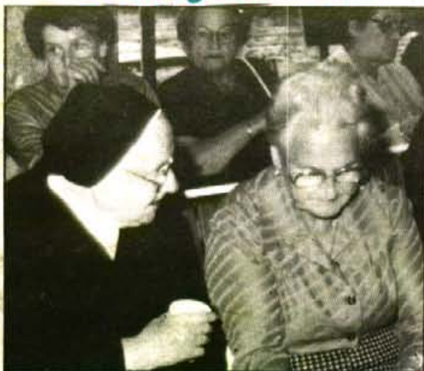
Les pensions mínimes de jubilació oscil·len entre les 44.655 i les 33.115 ptes. mensuals.