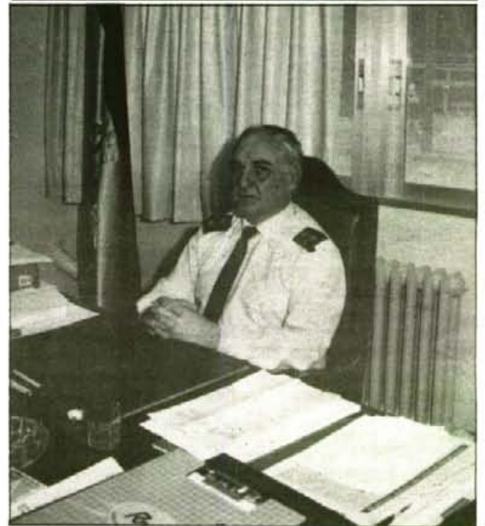
Allà dalt a Ses Bolles sembrà romaní i amistats