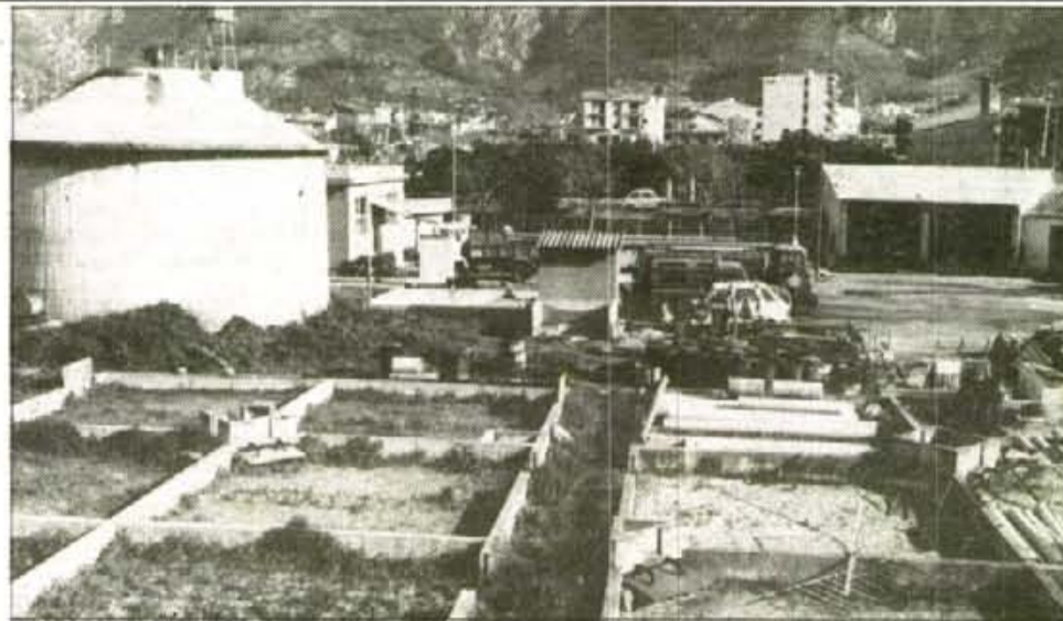
La vella depuradora haurà de seguir funcionant com a mínim dos anys més.