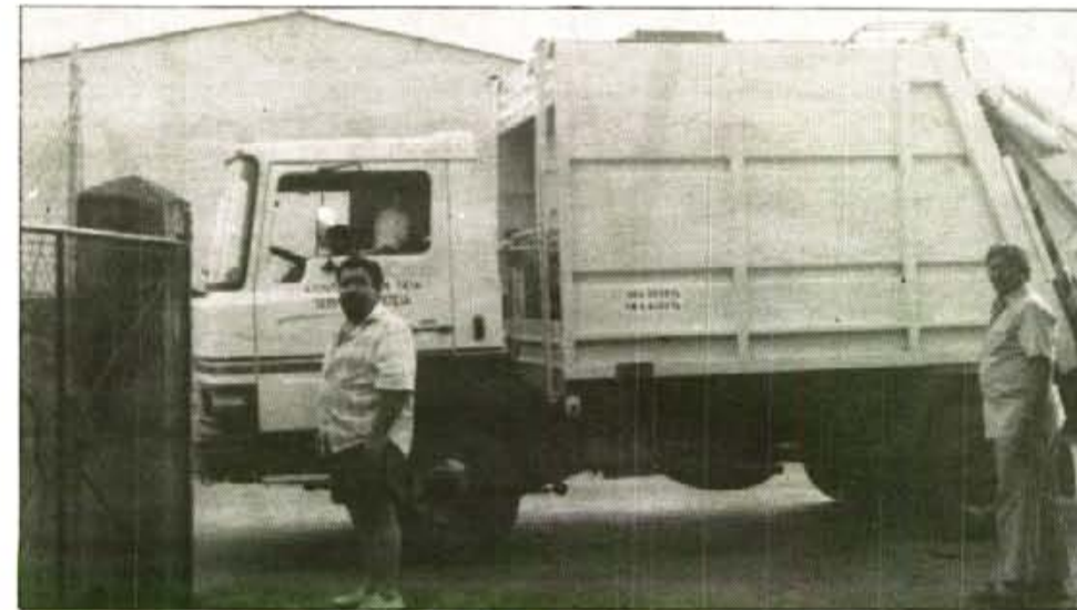
Es urgent l'adquisició de nous camions de fems. El de la foto, en bon estat, perteneix a Deia i s'empra a Sóller.

■ La figura del responsable seria una persona dedicada a la gestió del servei: proposaria idees per augmentar la qualitat del servei, faria complir els acords del consell del qual en seria el representant administratiu, dirigiria i inspeccionaria el servei, ordenaria els pagaments contemplats en els pressuposts... De fet seria la