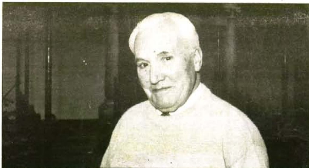
El "Hermano", quasi 50 anys entre els sollerics.

Els Amics de l'Entorn de Sóller ja tenen en mà les primeres trenta adhesions d'entitats comarcals que rebutgen el Port Esportiu d'en Quart. Entre elles cal destacar l'Ajuntament de Deià, el Ferrocarril de Sóller i agències de viatges, com la de Neckerman. També nombrosos claudres de professors, entitats socials i culturals s'hi sumen; i tot s'afegeix a les firmes dels sollerics particulars. Diumenge vespre hi ha assemblea dels Amics de l'Entorn i els nostres lectors poden ampliar informació a la pàgina onze, on s'hi troba un detallat comunicat del col·lectiu.