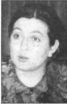
"A dins la primera fase, l'ajuntament ha de invertir set milions"

-Qui hi a de veritat en tot aquest tema?