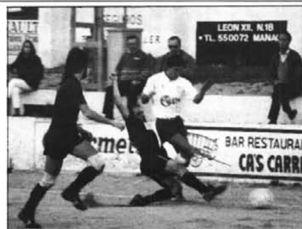
Voluntat, tota. Encert, mínim. Serà necessari millorar l'imatge a Cala d'Or, si no es vol tornar amb les mans buides.

Ara s'hi està a temps. Segons les darreres notícies, hi a la decisió de cercar dos o tres reforços. Realment, no queda més remei. A grans mals, grans remeis.