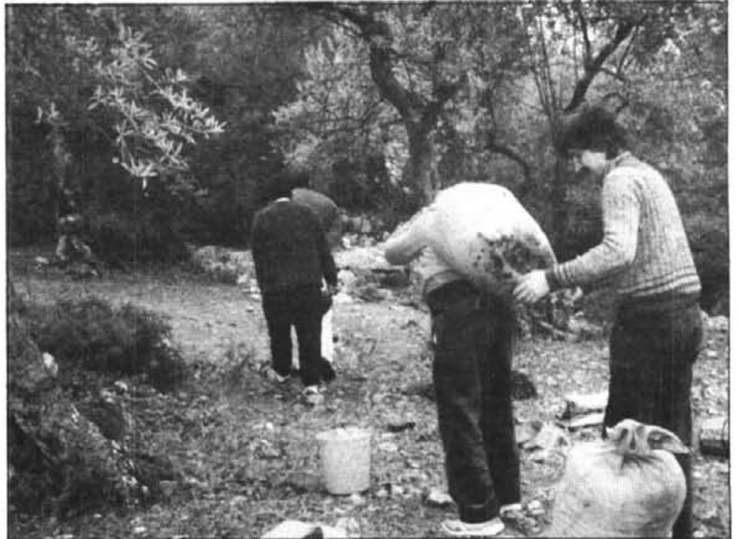
Es missatge carrega es sac a l'amo. Un i s'altre ja fan oli

Jaume ("Gent Menuda") o diumenge matí a les 8,30 h., ésser a Plaça disposats a fer moltes trullades.