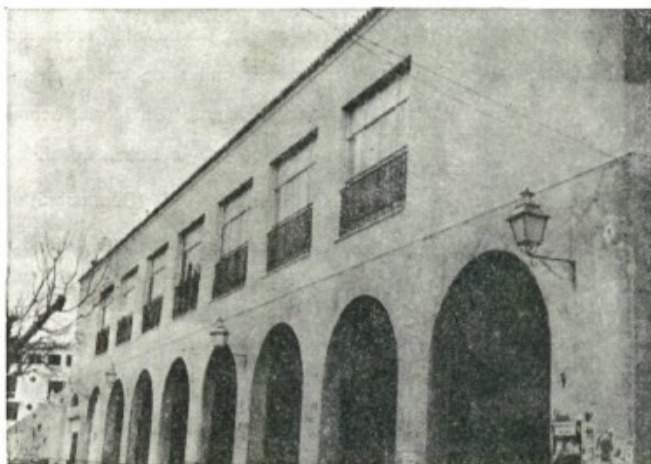
Hoy, estamos en un bonito edificio