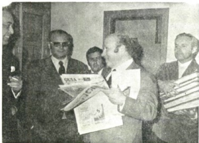
Una grata visita que nos obliga

Entre las muchas satisfacciones que ha recibido el Teleclub Piloto —nuestro y vuestro Teleclub Piloto— destaca este premio que acaban de concedernos desde Madrid.