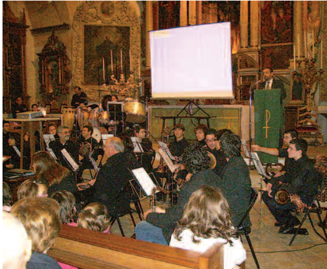
Els campaners han pogut gaudir d'un magnífic concert amb tota la família

Una altre cosa positiva ha estat la recuperació de persones que havien participat a la banda de música i que per diversos motius havien deixat de tocar. Ara han tornat a començar.