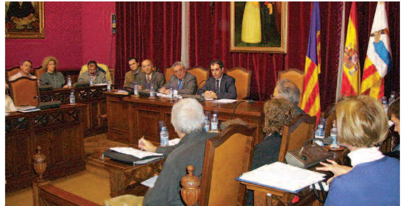
Ple de l'Ajuntament celebrat el 26 de novembre.