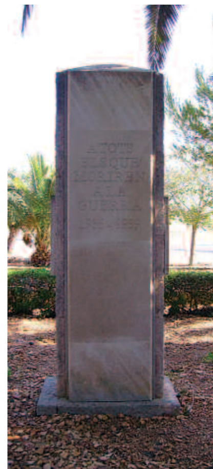
El monument als caiguts de Porreres va ser traslladat i modificat.