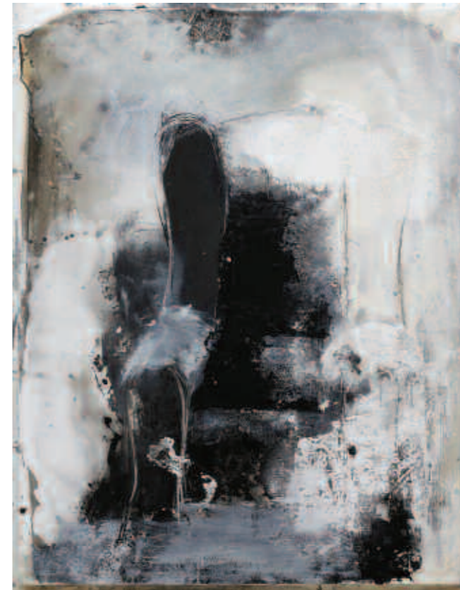
Això era i no era...150 x 118 cm. 2008