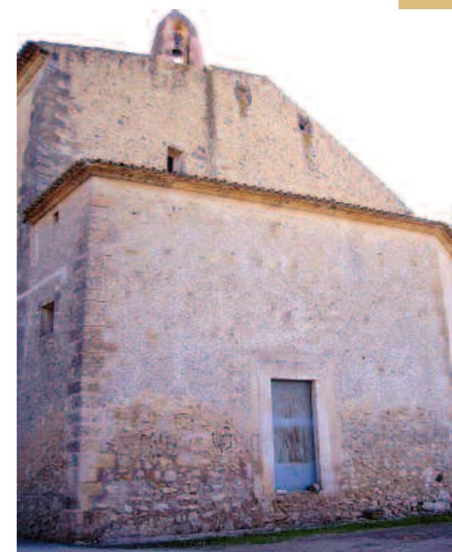
A la paret posterior de l'Oratori de la Creu es realitzaven els afusellaments

L'investigador Bartomeu Garí Salleras assenyala de l'existència d'un document que informa de la ubicació d'una fossa al municipi de Porreres. Es tracta d'una persona de Manacor que van matar en 1936 en el camí entre Porreres i Felanitx, el jutge que va fer l'aixecament del cadàver va descriure el lloc en el qual va ser enterrat al cementiri. L'antiga necròpolis de Porreres tenia quatre àrees connectades amb