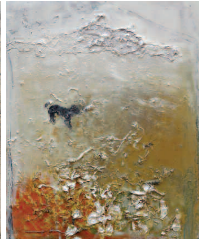
I un ca negre sense nas guardava un camp de flors. 48 x 39 cm. 2008