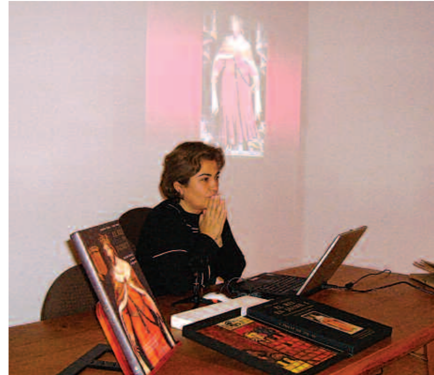
Valriu ha publicat molts d'articles i llibres de literatura infantil juvenil.

Organitzada per la Biblioteca Municipal de Campos