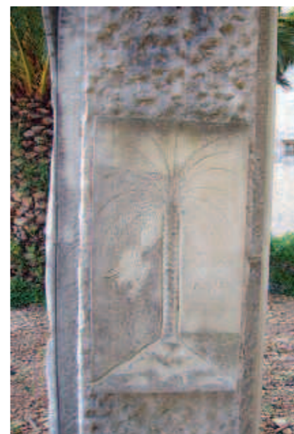
Detall del monument

tanta anys de transcorreguts els fets, l'Estat Espanyol no ha volgut o no ha pogut donar una resposta a la gent. Creiem que en temps de democràcia és una necessitat" va dir.