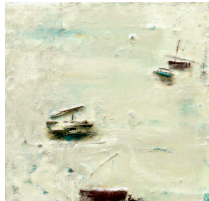
Hi havia barques a la ronsa. 39 x 39 cm. 2008

- Dels seus quadres destaquen molt el tractament de la llum i el color