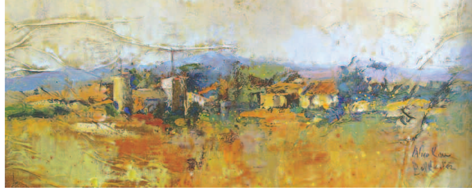
Paisatge del Pla. Tècnica mixta damunt tela. 30 x 15 cm. 1989

inspirat en la màgia dels personatges per fer els quadres. Aquesta exposició s'ha presentat a la Galeria Bennàssar de Pollença i al Casal de Ca'n Jaume Antoni de Santanyí. Dins la mostra hi ha títols molt suggestius com "I un ca negre sense nas guardava un camp de flors" o "La claror guanyà la foscor i sortí amb camisa blanca". L'any passat també vaig presentar l'exposició "Femení, singular" que reflectia les meves experiències com a dona. Les flors com a personatges que dialoguen són metàfores de persones i situacions.