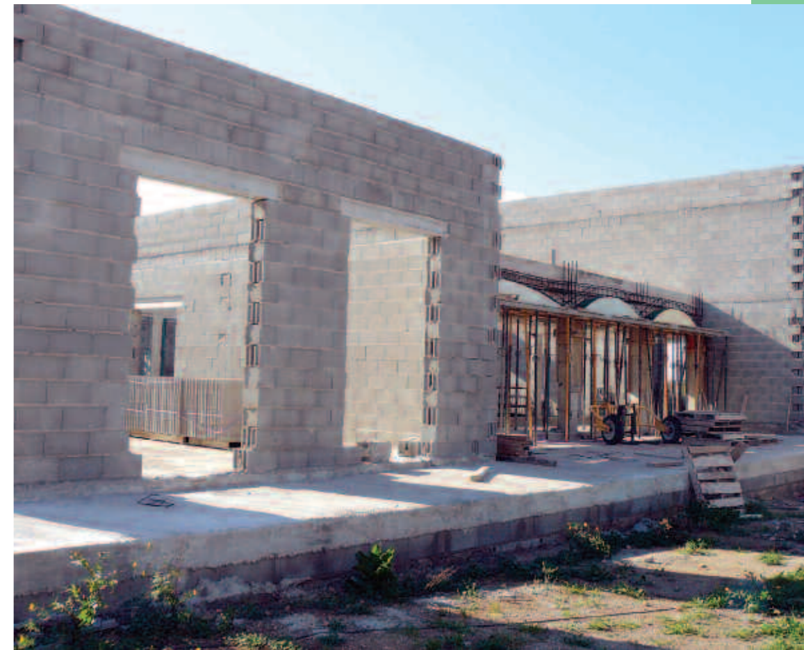
Les obres del Centre Cívic des Llombards han quedat aturades