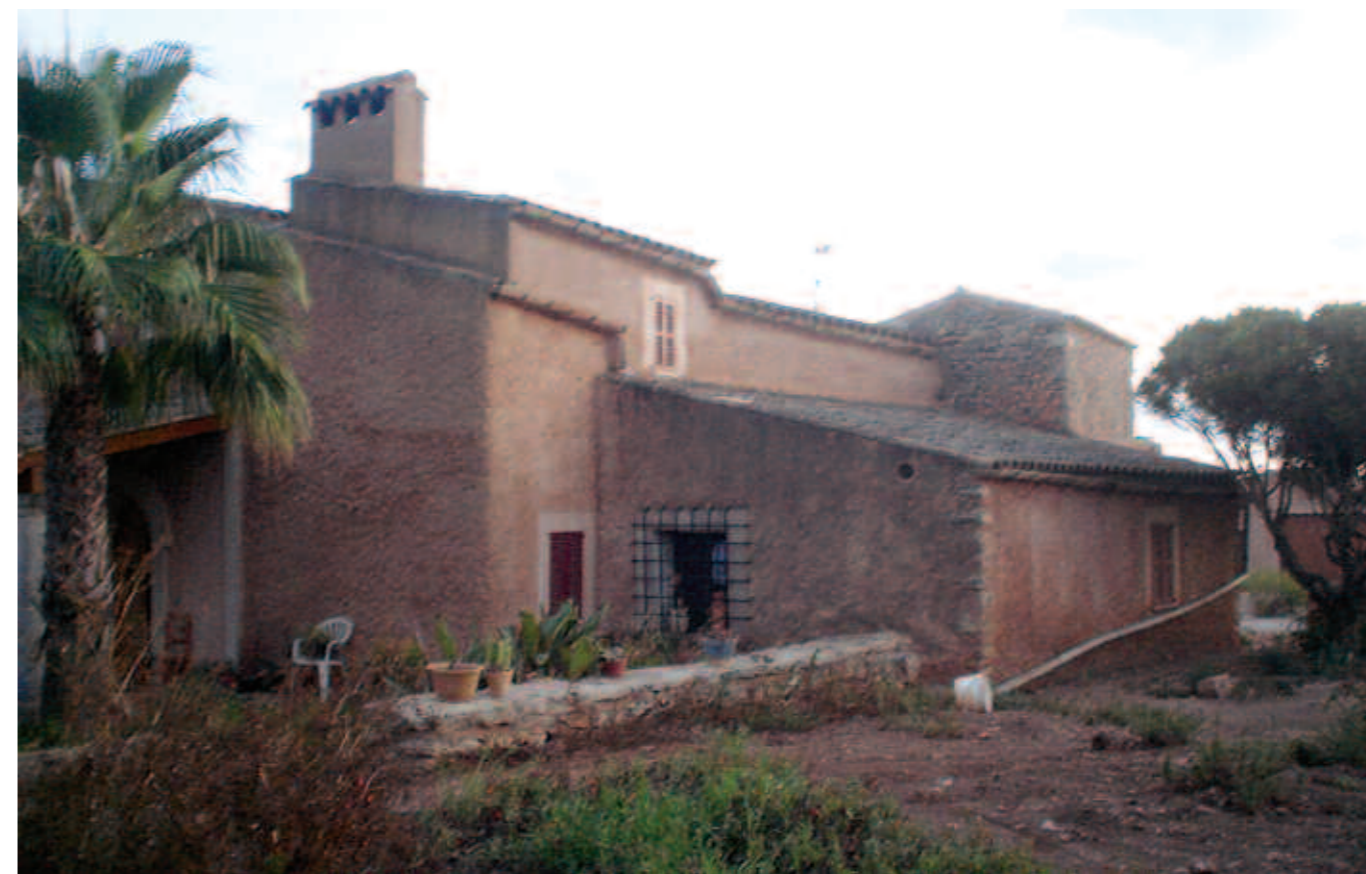
La seva distribució respon a la necessitat de defensar-se dels atacs de corsaris i pirates.