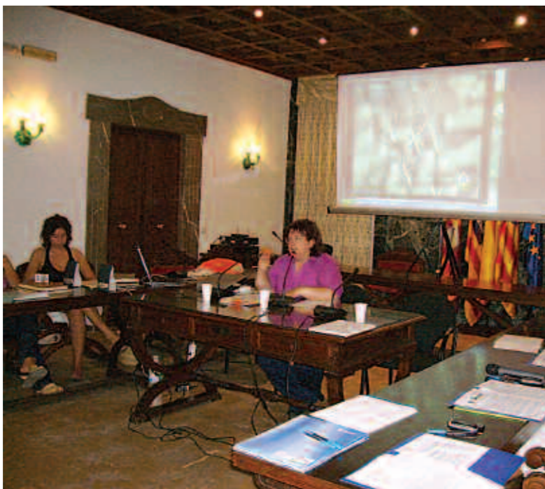
L'encontre va tenir lloc a la Sala de Plens de l'Ajuntament de Campos.

A mb l'objectiu de promoure el compromís de la comunitat educativa amb els fonaments de l'Agenda Local 21, valorar les experiències i definir les línies generals del pròxim curs, s'ha celebrat la IV a Jornada de Centres A21E. L'encontre va tenir lloc a la Sala de Plens de l'Ajuntament de Campos, al qual va assistir el conseller de Cooperació Local, Miquel Rosselló, i la directora insular