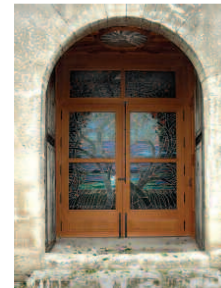
Els vitralls de l'Ermida de Sant Blai de Campos van ser realitzats per Eva Choung Fux

Holanda, Eslovàquia i Àustria. L'exposició original consta de 500 retrats fotogràfics de les víctimes de l'Holocaust, en blanc i negre acompanyats de textos. L'exposició ha estat presentada pel Ministeri d'Afers Estrangers d'Àustria a onze museus d'Holanda, Polònia, Eslovàquia, Croàcia, la Xina, Bòsnia i Àustria. I formarà part del museu dels màrtirs, el "Panstwowe Muzeum na Majdanku" (antic camp d'extermini) a Majdanek, Polònia.