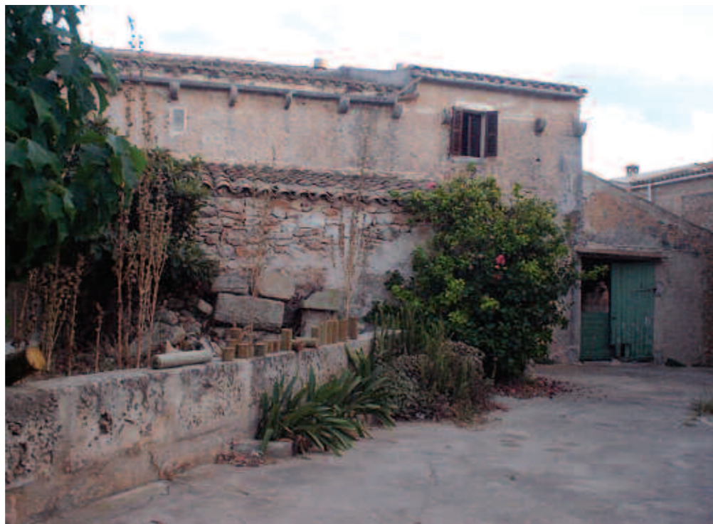
La tipologia arquitectònica d'aquestes cases és única a Mallorca.

Aquestes antigues edificacions de l'època medieval han estat catalogades pel Consell de Mallorca