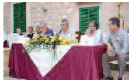
L'acte es va celebrar a la Casa de Cultura de Can Jaume Antoni.

tors van dedicar al públic un breu recital de poesia.