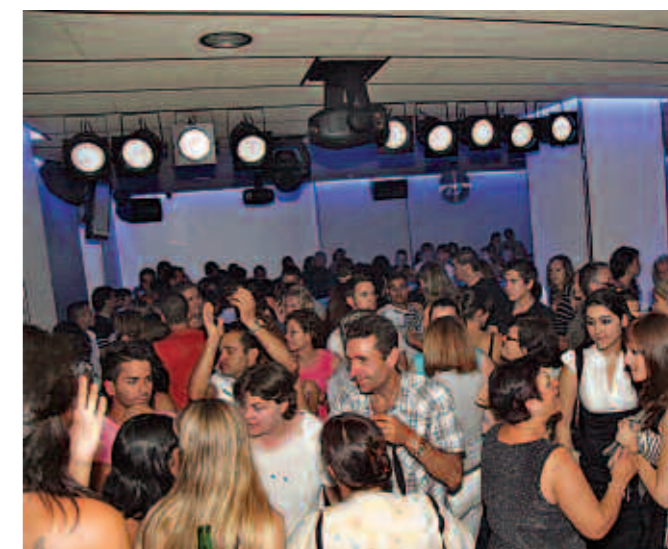
La festa es va allargar fins altes hores de la nit.