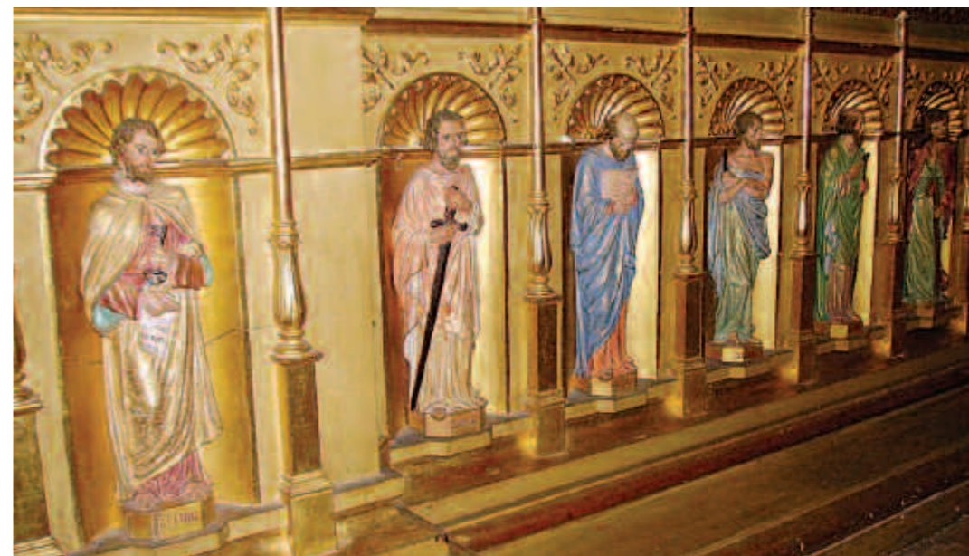
Detall dels apòstols fets de terracota.

Finalment, s'ha d'anotar que a Campos existeixen dues imatges de la Mare de Déu d'Agost i que l'altra es troba al Convent dels Mínims i que probablement sigui d'una cronologia artística més tardana (segle XVII). A Catalunya i al País Valencià també es celebra el misteri de l'assumpció. A València existeix la representació més antiga d'Europa.