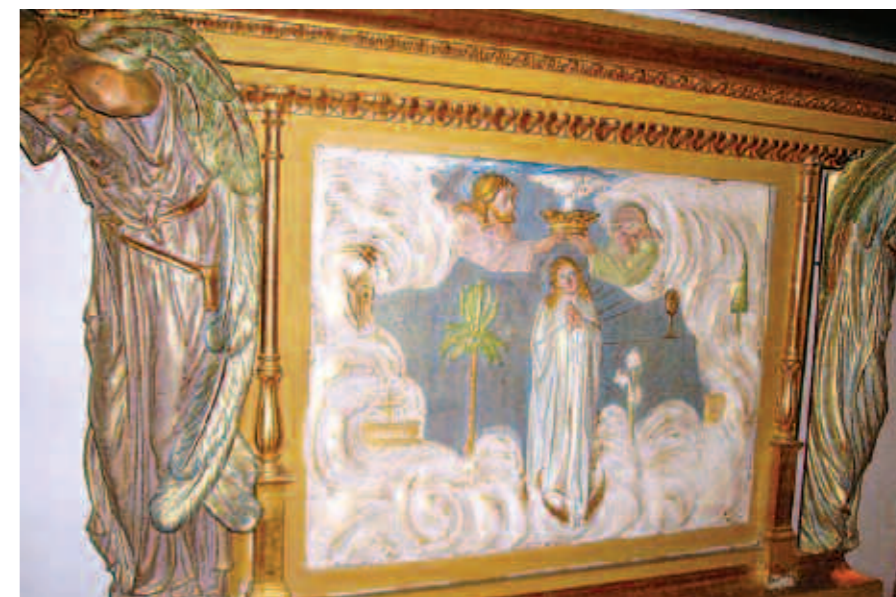
A la part inferior del túmul hi ha dos baixos relleus que representen la coronació i l'assumpció de la verge.

El tàlem de la Mare de Déu Morta (imatge jaçent) es situa en el primer terç de la nau de l'església parro-