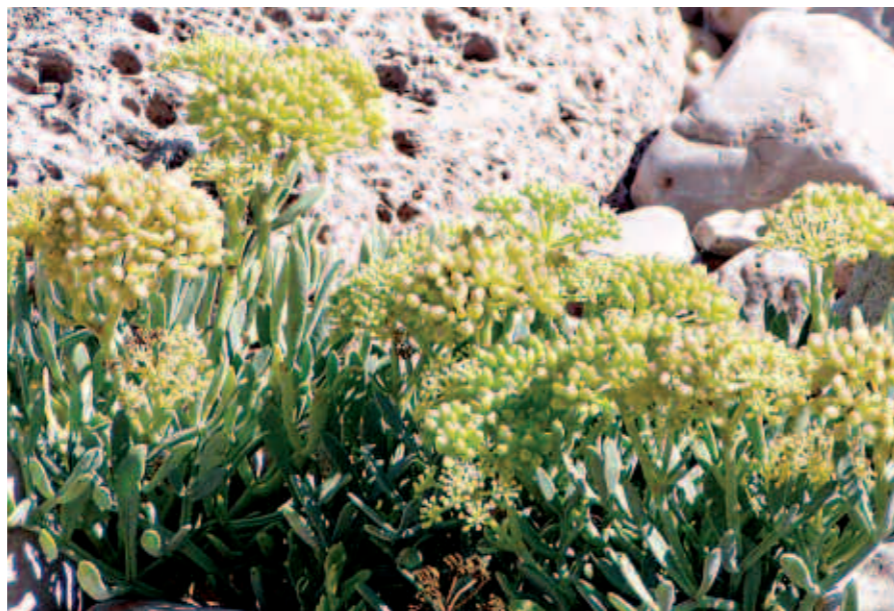
El fonoll marí dona un toc especial a les amanides i al nostre típic pamboli amb embotits

El fonoll marí pot atènyer uns 40 cms. d'alçària i és molt comú en els litorals rocosos, tant del Mediterrà-