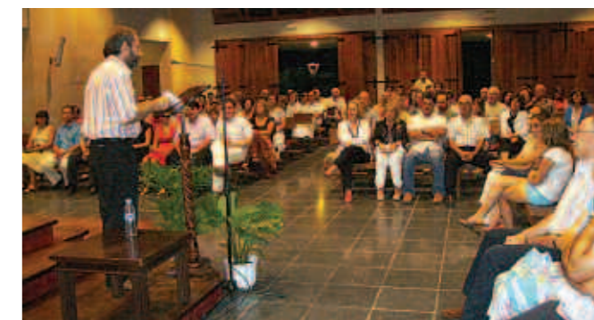
Aguiló va parlar de la toponímia de sa Ràpita.