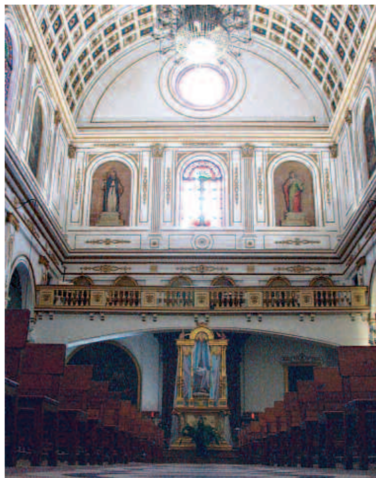
El muntatge del llit es realitza una vegada a l'any.

La primera referència oficial sobre l'Assumpció es troba en la litúrgia oriental. Al segle IV es celebrava la festa del Record de Maria, que commemorava la seva entrada al cel. Al segle VI, la festa va ser anomenada Dormició de Maria. L'emperador bizantí Maurici va decretar