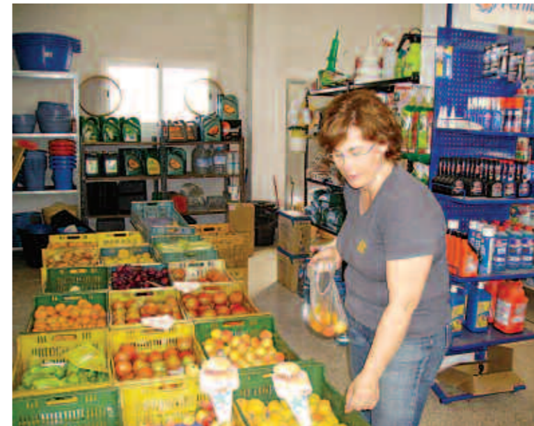
La principal preocupació dels agricultors és fomentar el nivell de varietats comercials