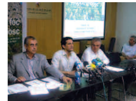
La campanya que es perllongarà durant juliol i agost va dirigida a residents i turistes.

L'objectiu d'aquesta campanya és reduir el nombre d'incendis forestals a la nostra Comunitat i conscienciar residents i turistes de la necessitat de prendre de mesures de prevenció del foc en els nostres bos-