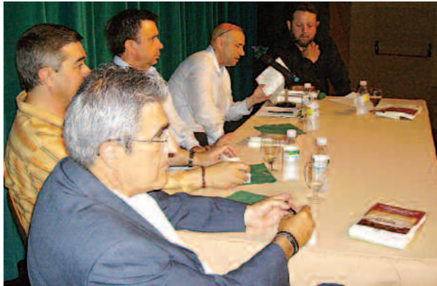
L'Editorial Heptaseven va publicar els llibres.