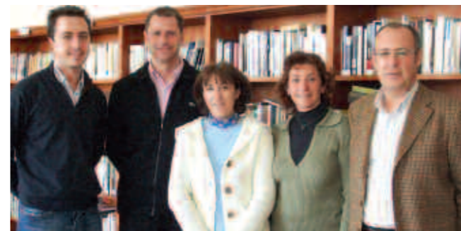
Les ajudes de l'Obra Social La Caixa es destinaran a la compra de llibres i a millorar l'espai de lectura

Finalment, el director general de Biodiversitat ha comentat als propietaris que s'estudiarà l'ampliació de la Xarxa de Refugis de les Illes Balears amb la incorporació d'instal·lacions del Parc Natural de Mondragó