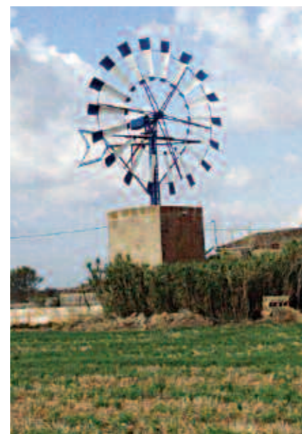
A Campos existeixen més de sis-cents molins de vent, dels quals s'han recuperat solament 54.

L'objectiu del projecte de transformació dels molins d'aigües del municipi de Campos, intentava reduir l'impacte visual i estètic negatiu dels deteriorats molins, restaurant la seva estructura i dotant-los d'una funció pràctica. L'energia eòlica que poguessin generar els mo-