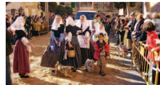
A Lluçmajor el poble es va bolcar en unes jornades molt participatives.

A Lluçmajor es va viure amb gran animació les festes celebrades els dies 12 i 13 de gener. El poble es va bolcar en unes jornades molt participatives, que es van iniciar a la placeta de s'Arraval amb jocs populars com la esquerdisa d'olles i ximbombades, dirigits als més petits. Durant dos dies es va revivir la tradi-