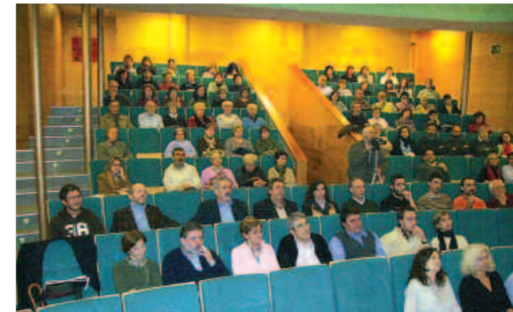
Grans aplaudiments del públic s'escoltaren durant el concert.

litzat concerts i recitals per quasi tota la geografia espanyola, així com als països de Portugal, Alemanya, Suïssa i Estats Units. Francisco García va obtenir el Premi Nacional de Violí Pablo Sarasate 2006, per una-