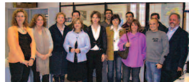
La consellera d'Agricultura amb personal de la delegació comarcal de Campos