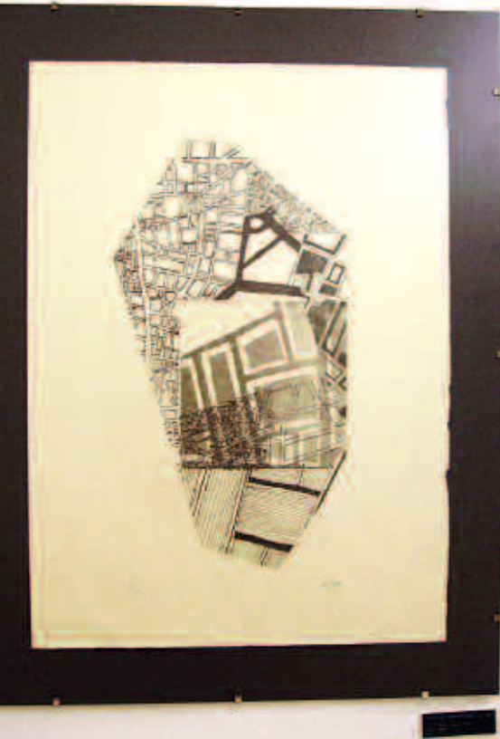
Per representar aquests recorreguts l'artista utilitza mapes.

La mostra incloïa 32 obres realitzades en diferents tècniques