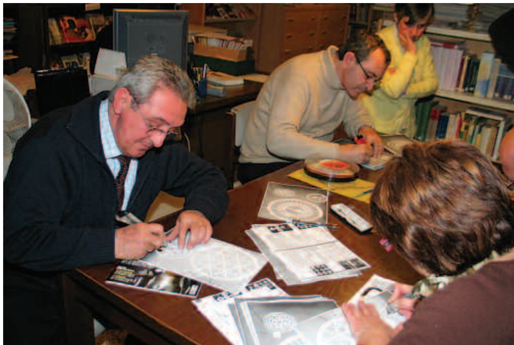
Joves i adults varen participar al taller de neules