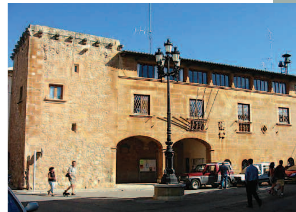
El certamen tindrà com a tema principal el municipi i els seus habitants.

El consistori atorgarà premis en metàl·lic de 1.000, 300, 200 i 100 euros per als guanyadors. El concurs es resoldrà per votació popular (50% de la puntuació) i per la valoració d'un jurat format per experts (50% restant). Les fotografies passaran a formar part de l'Arxiu fotogràfic de l'Ajuntament