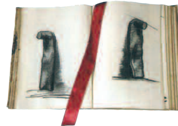
Mom pare, que és sa por, 2004. Dibuixos al carbó, llaç i rosa natural

cara que de vegades he hagut de robar hores a la meua família. M'he privat de moltes coses però ha valgut la pena tot l'esforç. Estic satisfeta amb el que he fet" ha destacat Vidal.