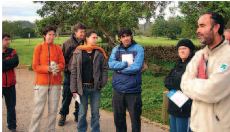
Els participants van prestar molta atenció durant el passeig explicatiu

L'afecció pels bolets ve de lluny i es van conèixer molt bé a nivell popular abans de fer-ho a nivell científic. Més de 275 classes de bolets tenen un nom popular o més d'un, segons les comarques. Els estudis de Micologia no es van iniciar fins co-