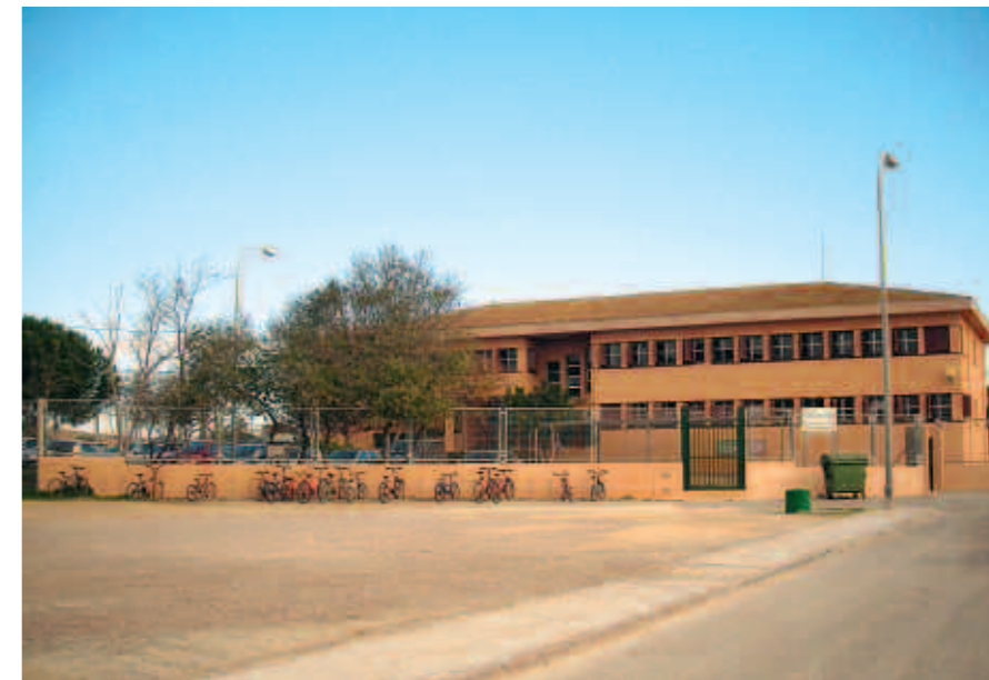
Col·legi públic de La Colònia de Sant Jordi

L'AMPA considera que la responsabilitat de l'educació dels seus fills i filles és una tasca que correspon per dret a les famílies, però que s'estén a l'àmbit dels centres educatius i institucions culturals, en aquest sentit és necessari proporcionar a les famílies ajuda, formació i mitjans que facilitin el desenvolupament educatiu. L'objectiu és col·laborar en la construcció d'una comunitat educativa plural, compromesa amb l'educació, en la que tot el món treballi colze a colze. En aquest sentit, els pares s'impliquen per a millorar l'educació dels seus fills i volen pressionar per que l'administració conegui totes les carencies observades i col·laborar en la seva millora. "El paper de pares i mares és fonamental per a aconseguir-ho, afegí una altra mare. Amb aquesta petició, només comencem la nostra pressió". L'associació de pares de Ses Salines i de La Colònia ha donat els primers passos per a