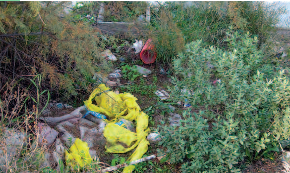
Es necessita un canvi i un impuls en la gestió de residus.

El regidor de Medi Ambient analitza les estratègies en la gestió de residus