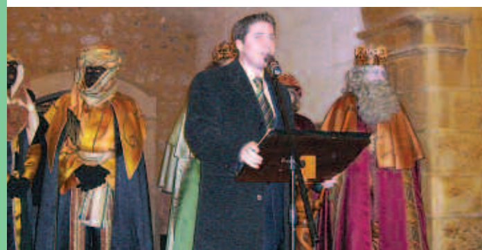
Les seves majestats els Reis de l'Orient van ser rebuts per membres del consistori.