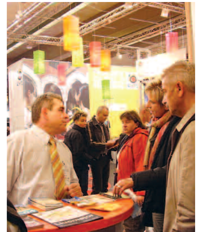
Stand de Lluçmajor a la CMT de Stuttgart (Alemanya)

rebé la visita de 180.000 persones. el 30 gener al 3 febrer anirà a FITUR (Madrid); del 14 al 18 de febrer a l'CBR de Munic (Alemanya); del 5 al 9 de març a ITB de Berlín (Alemanya); del 5 al 7 de setembre a l' Eurobike de Friedrichshafen (Alemanya); del 20 al 21 de setembre a IFMA Colònia (Alemanya); del 10 al 13 de novembre a l'World Travel Market de Londres (Anglaterra); i finalment del 27 al 30 de novembre a l' INTUR de Valladolid.