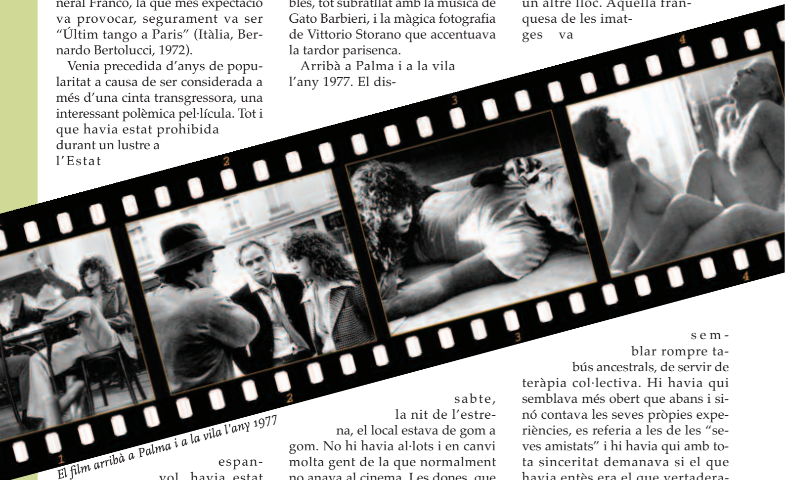
El film arribà a Palma i a la vila l'any 1977

Tothom l'havia vista, al poble o a un altre lloc. Aquella franquesa de les imatges va