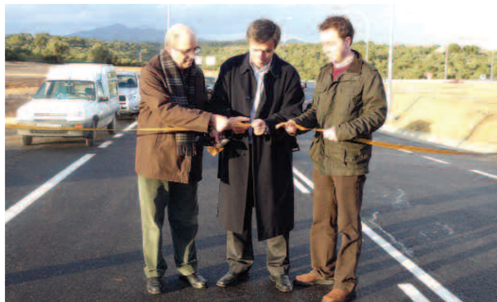
Les autoritats locals van inaugurar l'infraestructura.

construcció de dues rotondes, una a la carretera C-717 on s'inicia el tram cap a Cala d'Or i una altra en el camí cap a Cala Mondragó una vegada passat el sol urbà de Portopetro. A més a més s'ha