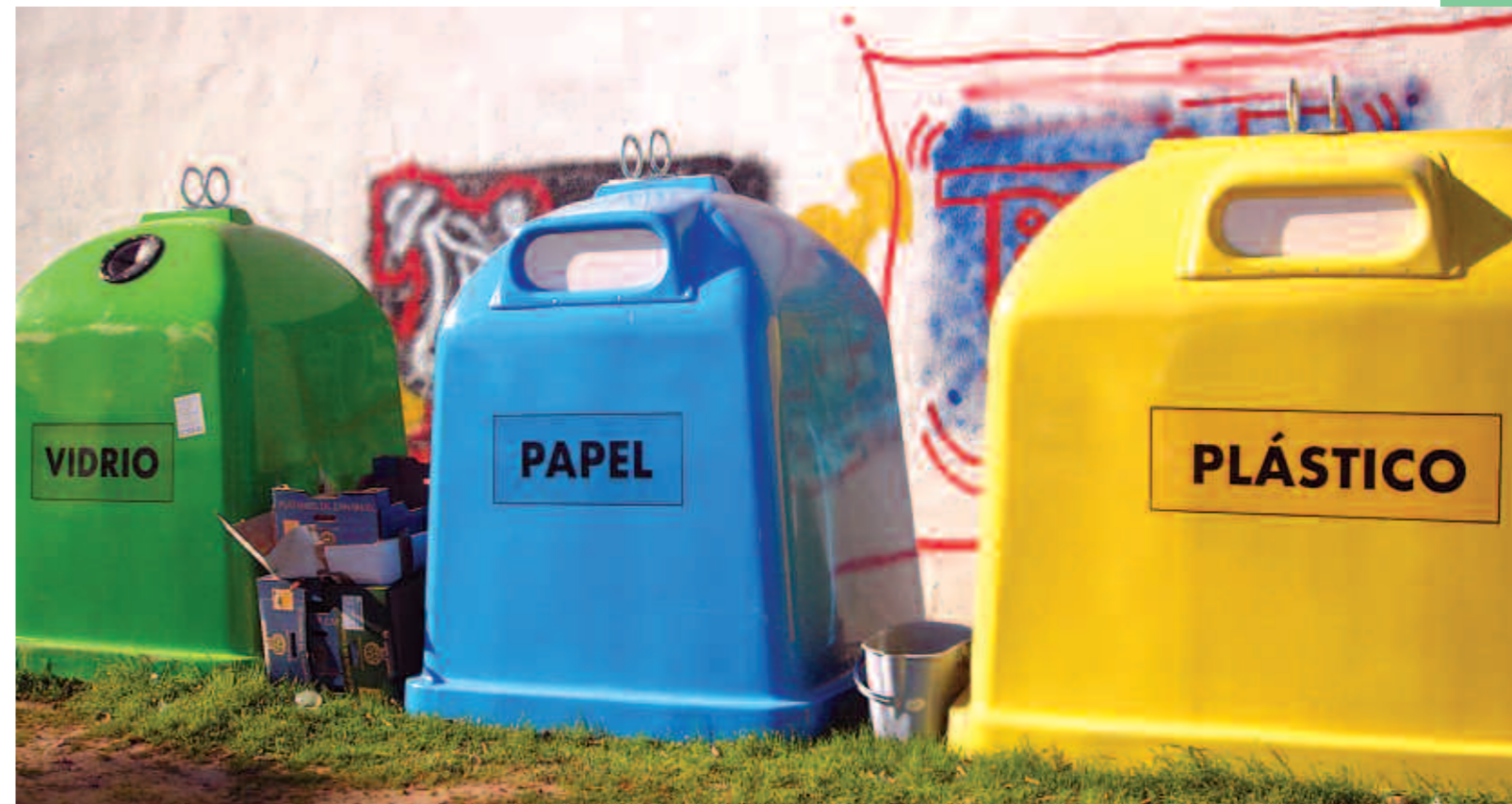
L'ajuntament ha comprat nous contenidors per a la recollida selectiva.

L'Ajuntament de Ses Salines firmà l'any 2006 acords amb els bars i restaurants de la localitat per a la recollida de vidre. Des