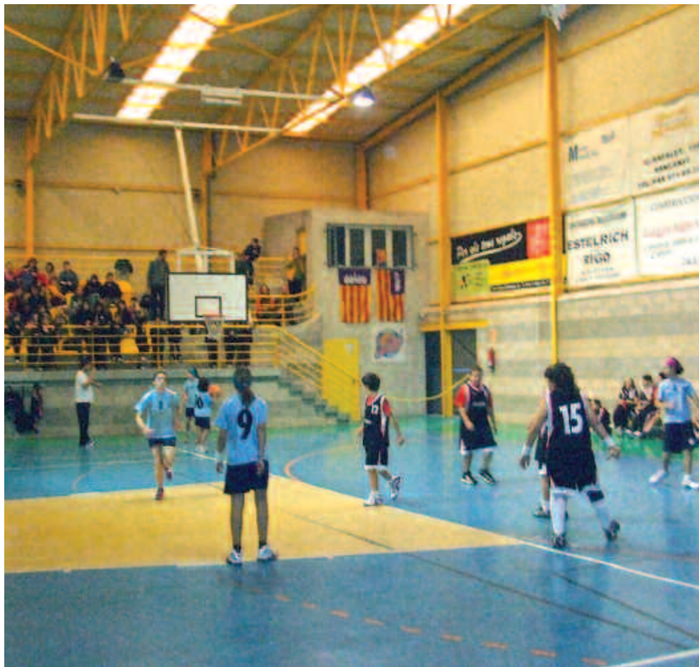
A la trobada hi van participar 18 equips de Llucmajor, Felanitx, Campos i Santanyí.

Els escolars jugaren entre ells durant tot el matí, encoratjats pels seus familiars que hi assistiren com a públic. L'Ajuntament de Santanyí va aportar el berenar dels participants, així com begudes i camisetes. L'organització de la jornada va anar a càrrec del Consell de Mallorca, que va comptar amb el patrocini del consistori santanyiner i la col·laboració del Bàsquet Club de Santanyí.