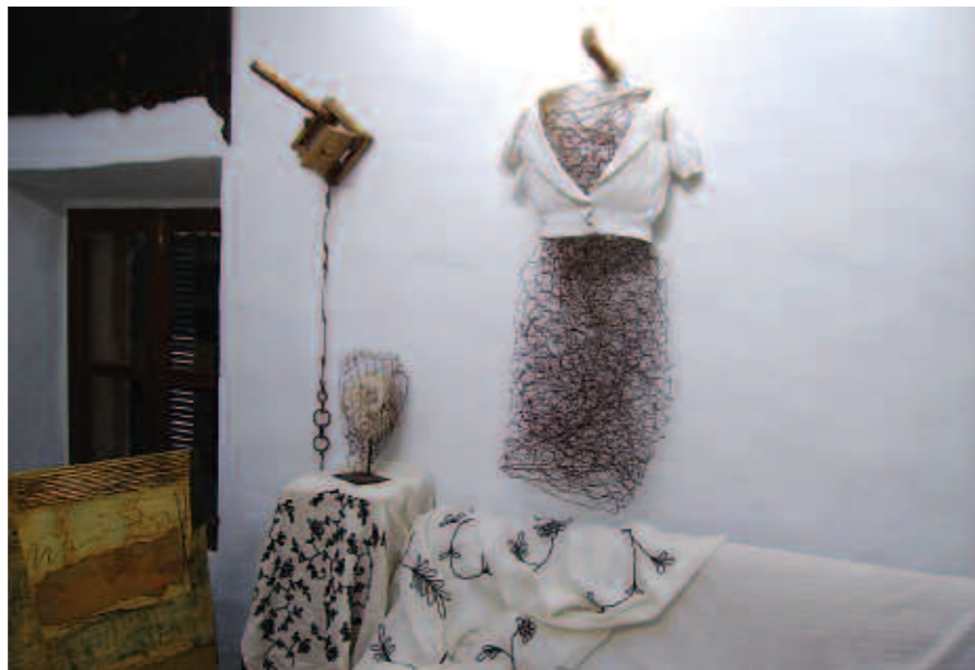
El vestit de cristiana ha estat un de les seves inspiracions.