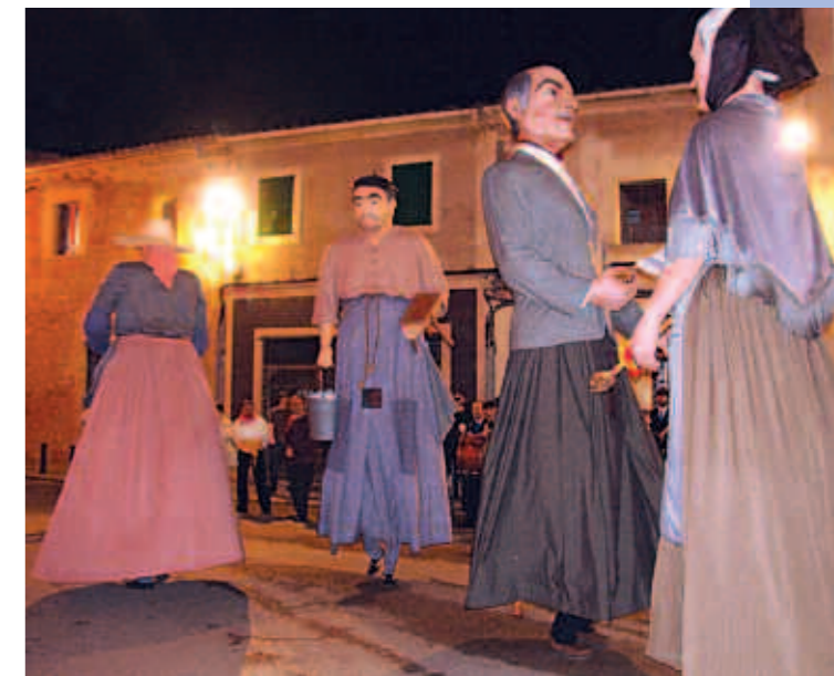
El quatre gegants del poble van ballar davant l'ajuntament

Dins els actes de Sant Julià també va tenir lloc la V Fira d'Oportunitats a la nau de Son Fuaní i va comptar amb la participació d'una vintena d'empreses de la localitat i representants de "La Casa de las Puntillas" un comerç palmesà que ha tancat les seves portes després de setanta anys d'activitat.