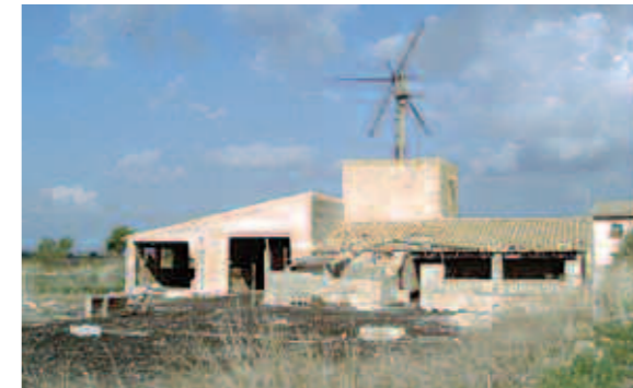
Alguns molins es mantenen en condicions precàries.

N'hi va haver de molts tipus: saliners, gerrers, extractors d'aigua i una gran majoria s'utilitzà per a la transformació de cereals en farina. Al contrari dels del nord d'Europa, de fusta, els espanyols són de pedra i morter emblanquinat de blanc. Quasi sempre tenen tres pisos, el més alt per a la maquinària i la pedra de moldre, el del mig a on es recull la farina i la planta baixa pel magatzem. Els molins de vent estaven construïts damunt una base