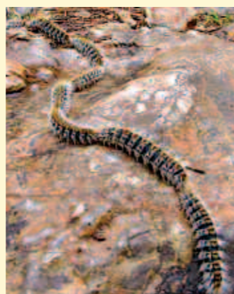
Les erugues ataquen la vegetació i provoquen al·lèrgies als humans