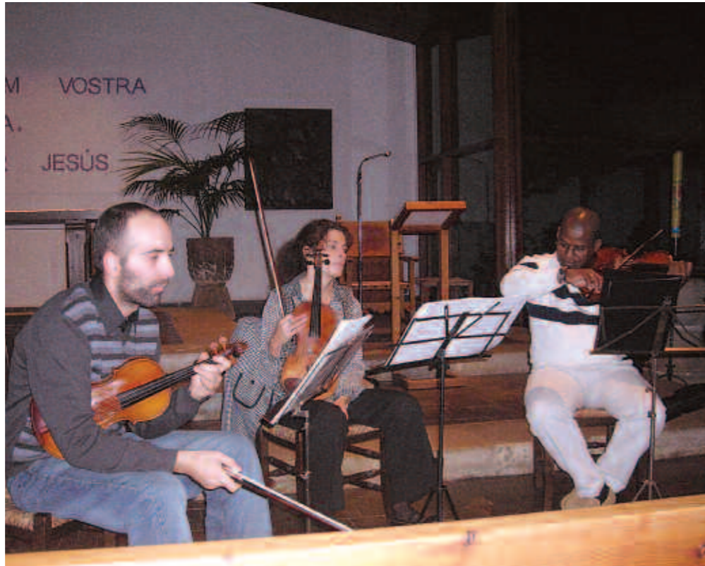
El concert es realitzà a l'església parroquial de La Colònia de Sant Jordi

Es pot dir que la música cubana nasqué d'una amalgama de les fórmules del folklore musical espanyol i dels ritmes africans, aquests darrers duts a Cuba pels esclaus negres. També han tengut una míni-