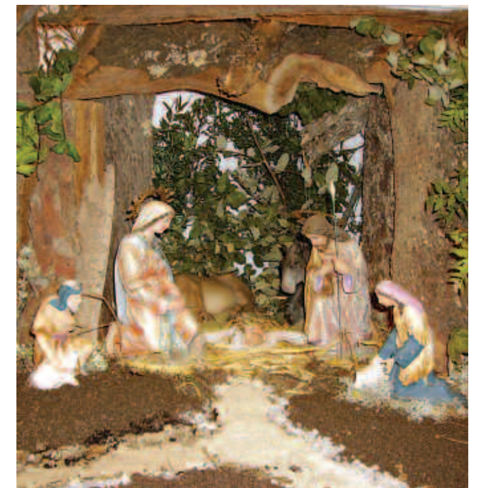
Betlem de l'Associació de Mestresses Nuredduna.