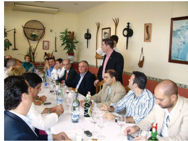
Instantes de la merienda "oficial".

La feria de octubre de Campos pronto cumplirá los 100 años. Para octubre solían venir al pueblo todos los payeses de fora vila a hacer la compra más grande del año. Compraban con el dinero que habían ganado durante todo el año, herramientas agrícolas, las especies y utensilios para hacer las matanzas o simplemente ropa para la mujer y los hijos. Esto con el devenir de los tiempos ha cambiado mucho. Sin embargo, la feria de octubre mantiene tintes característicos. En la edición de este año han participado diversos sectores de artesanos, del comercio y restauración; así como las entidades sociales y culturales del municipio.