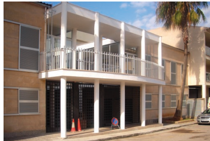
Les obres s'han finançat amb fons del Pla de Desestacionalització Turística.

Un dels grans projectes que s'han dut a terme a la Colònia de Sant Jordi, ha estat l'ampliació i la reforma del centre cívic. L'edifici, símbol de la nova Junta de Districte, ha estat totalment renovat i millorat.