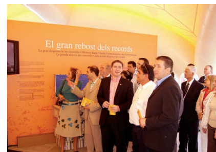
Las autoridades recorrieron el recinto ferial.