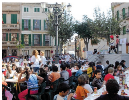
Els nins es concentraren a la Plaça Espanya i tastaren un berenar saludable