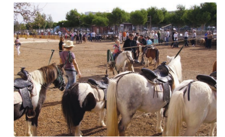
Los animales de razas autóctonas dieron carácter de "fira pagesa".

con diferentes números de doma y la tradicional Mostra de Cuina de la Asociación de Amas de Casa Nuredduna. La jornada concluyó en la Plaça Major con música de la butucada y s'Escandol.