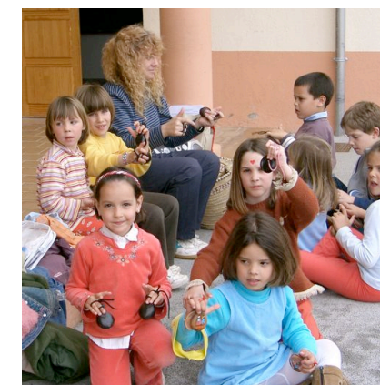
L’Associació Cultural Capocorb també realitza altres activitats relacionades amb la cultura popular.