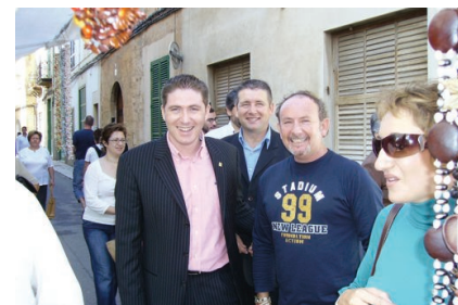
Visita a los diferentes stands.