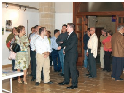
Moments de la inauguració de l'exposició