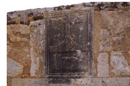
Detall de la inscripció amb la creu llatina i l'escut heràldic de Campos.

habitatges a causa de les diverses incursions que el pirata Barba-rossa va fer a la zona. El lloc va quedar mancat de la més mínima infraestructura d'abastiment d'aigua i per aquest fet es va iniciar la construcció del dipòsit.