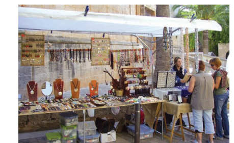
Los artesanos llenaron las calles principales de la ciudad.