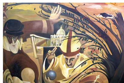
Leonardo i el Papa

es pot conèixer tot. Crec que si no es coneix la nostra pròpia història, el nostre passat, no ha d’ésser fàcil obtenir idees de futur i tampoc conèixer-se a un mateix. Amb aquest mural, podria succeir que certes històries de la Mediterrània ens sorprenguin i ens resultin més properes.