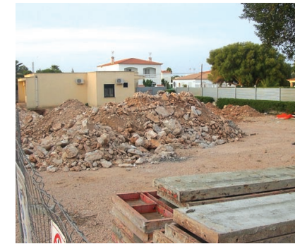
Les obres cobriran la creixent demanda sanitària en les urbanitzacions de la costa.