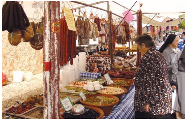
Las calles principales se llenaron de expositores.

EL ALCALDE REIVINDICA LA PROMOCIÓN DEL MUNICIPIO A NIVEL INTERNACIONAL