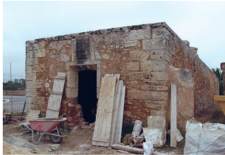
Exterior de l'aljub

L'estat quasi ruïnós i degradat de l'aljub de cas Donat, ha obligat a l'administració local a prendre mesures immediates per a la seva recuperació. Aquest element etnològic està catalogat com un Bé Patrimonial de Campos i com BIC (Bé d'Interès Cultural) de les Illes Balears. L'estat actual de l'edificació era llastimós i les causes de la seva degradació han estat el pas del temps i la necessitat d'un treball de reparació i consolidació. S'havien fet treballs de manteniment i neteja, però les pluges i les filtracions havien afectat de forma important la seva estructura.