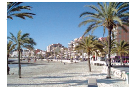
La Platja de Palma consta de 9,5 quilòmetres de costa dels municipis de Lluçmajor i Palma.

La Federació de Serveis Públics de la UGT-Illes Balears ha atorgat una menció "Premi Llum" a l'Ajuntament de Lluçmajor, pels seus treballs i activitats desenvolupades per la millora de les condicions de seguretat i salut en el treball. El consistori ha estat premiat pel seu projecte de reestructuració de les instal·lacions de les Brigades d'Obres. En aquesta convocatòria hi participen totes les empreses o institucions públiques de les Illes Balears, serveis de prevenció, seccions sindicals, delegats de prevenció, empleats públics, així com qualsevol altre persona física o jurídica.