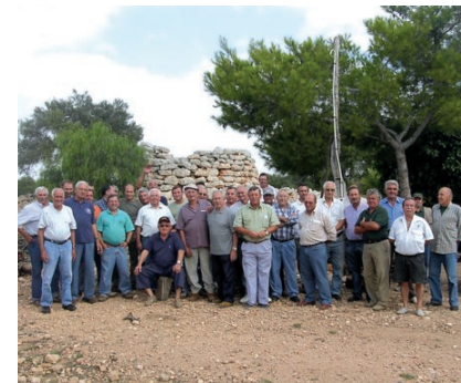
La prova es va disputar en diversos vedats del municipi.