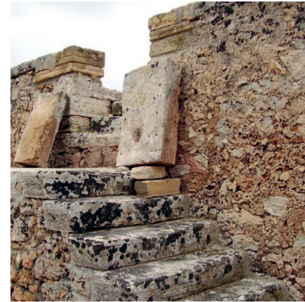
També s'han restaurat les escales laterals.