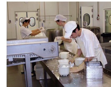
Un dels principals productes és el formatge

de 0,31 cèntims per litre de llet i aspira a poder incrementar-lo al nivell de la mitjana nacional que és de 0,41 cèntims. Durant la presentació dels resultats als mitjans de comunicació, la central obrí les seves portes i mostrà les seves instal·lacions. Aquesta empresa de productes agroalimentaris nasqué a finals de l'any 2002 per iniciativa d'un grup de ramaders disposats a elaborar i comercialitzar la seva pròpia producció. L'empresa es constituí amb l'aportament del Govern Balear, la Cooperativa "Lleters de Mallorca" i el Grup Fontanet. Cada una de les parts posseïa un 33% de les accions. A l'actualitat, el Grup Fontanet és l'únic propietari de l'empresa.