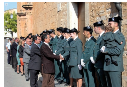
Els membres de la Guàrdia Civil reberen la felicitació de les autoritats locals.

La Corporació municipal ha deixat clara la seva preocupació davant la "massificació de l'ensenyança" i el seu desig de trobar una solució ràpida.