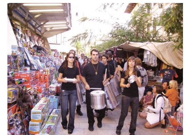
La batucada Els Insonoritzats dio mucho ambiente a la fiesta.