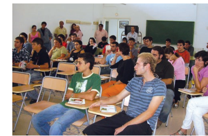
S'han organitzat també cursos de català i d'anglès.