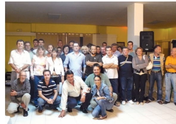
S'ha destacat la importància dels voluntaris a l'hora d'actuar als accidents.