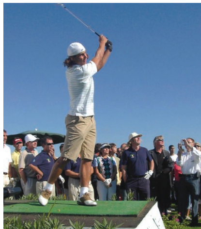
El Torneig Renault Lluçmajor es va disputar a Son Antem