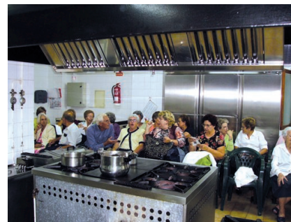
El objetivo del taller fue promover una alimentación saludable en esta etapa de la vida.

Según explicó Bonet el taller tenía la finalidad de promover una alimentación saludable evitando patologías derivadas de la mala nutrición. Los platos que se elaboraron fueron un primero de lentejas con cigalas, el segundo de cordero asado y de postre "amargos".