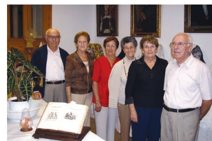
La Associació de Gent Gran organizó la exposició "Records d'un temps passat".