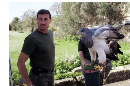
Demostración de cetrería.