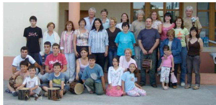
El grup prepara amb molta il·lusió el seu segon disc.

L’OBJECTIU ÉS CONTRIBUÏR EN LA RECERCA I RENOVACIÓ DE LA MÚSICA TRADICIONAL REGIONAL