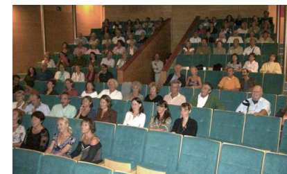
S'han projectat tres pel·lícules durant el mes d'octubre.

S'HA ESTRENAT A L'ESTAT ESPANYOL LA PEL·LÍCULA "MOLIERE" DE LAURENT TIRARD