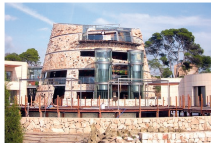
Exteriors del Centre d'Interpretació del Parc Nacional de Cabrera.

Les instal·lacions recreen els fons marins de Cabrera mitjançant 14 dipòsits que contenen 2.000 litres d'aigua i que acoïlliran, en un principi, a unes 140 espècies