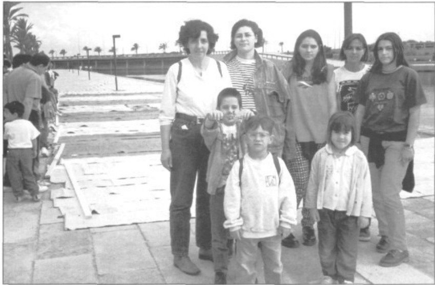
— Mares i al·lots de Campos participen a la Trobada d'Escoles Mallorquines

tenir el suport del Bisbat, d'Entitats Ciutadanes, Culturals i Esportives. El batle de Palma no va assistir però va emetre un ban públic en el qual convidava a la participació als ciutadans.