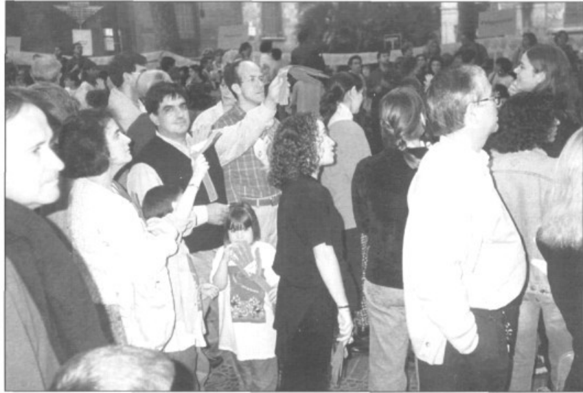
— Grup de campaners a la Diada per la Llengua