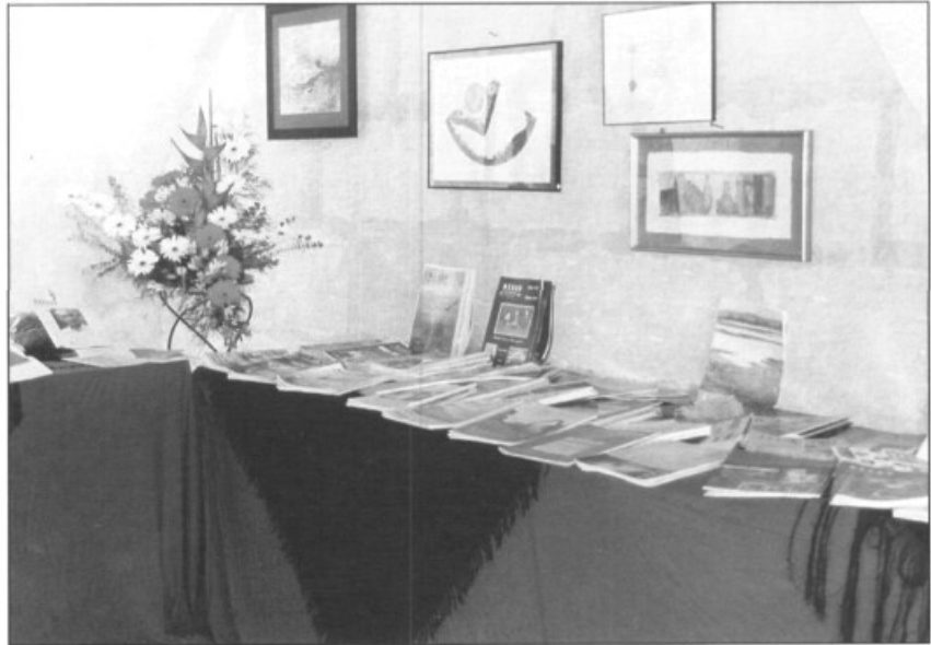
— Ressò va participar a la I Mostra Fet a Campos.

Digué que el Govern Balear es donaria per satisfet si al cap d'un