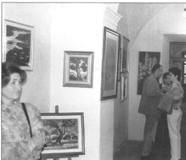
— Cases deshabitades es transformaren en galeries d'art.

Enguany la Fira de Maig que ja du una tira d'anys amb alts i baixos com tot allò que és humà, ha tengut una nova empenta i Déu dirà si definitiva o provisional.