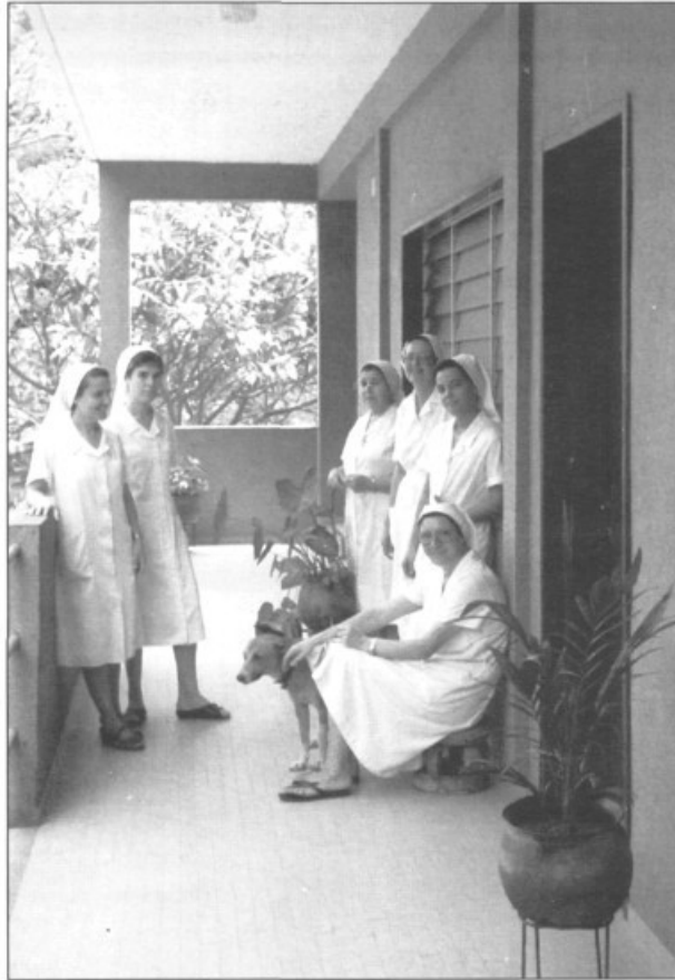
— La comunitat de teatines a l'hospital de Sant Joan de Déu a Tanquieta.

La poligàmia i la creença en medicina tradicional són dos factors que tenen repercursió en el nostre quefer. En el primer cas seria millor per a ells tenir una planificació familiar però tenen un concepte de la família molt ample i creuen que els infants són riquesa i no miren molt que llavors els han de mantenir. Llavors hi ha el tema dels fetitxes i curanderos, hi creuen molt però a vegades els remeis que s'apliquen produeixen infeccions i vénen a l'hos-