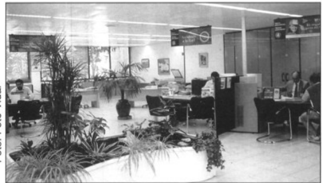
— La nova imatge de "La Caixa"

La major proximitat entre els clients i els empleats pot ajudar a millorar l'atenció personal.