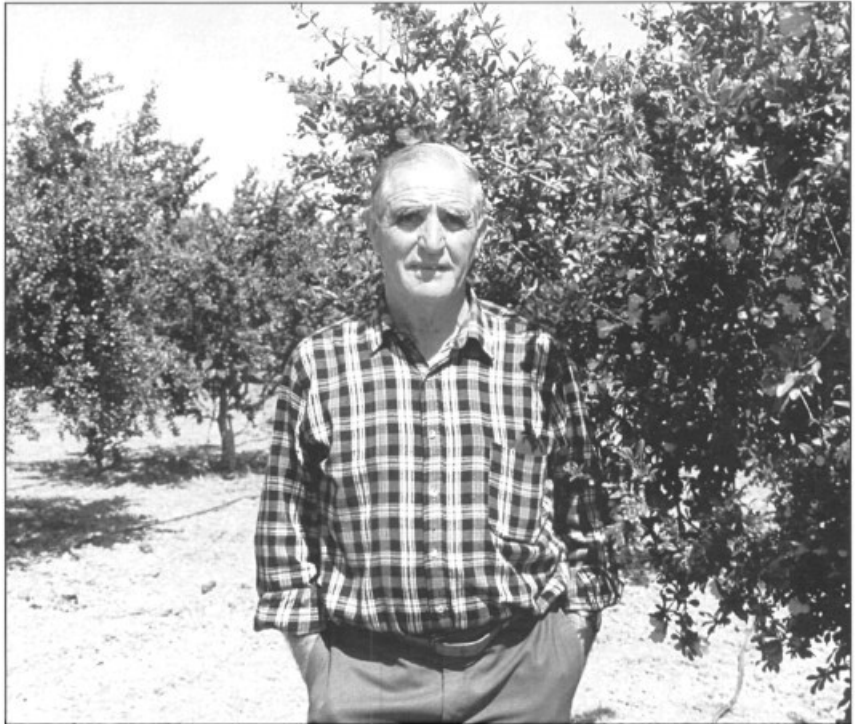
— "Per fer feina a foravila es necessita gust"

Als estius vaig començar a fer feina i amb 15 anys me n'anava a segar faves amb els grans, me dona-