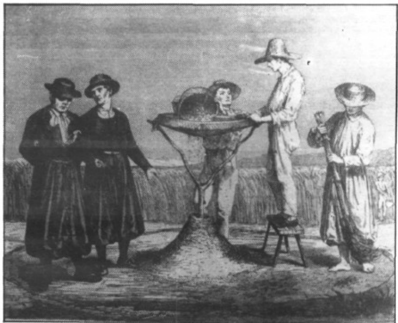
Un dels sistemes de purgar el gra

- Sí, ses feines de sa nostra foravila totes tenien una tonada, però, si te pareix, en xerrarem un altre dia.