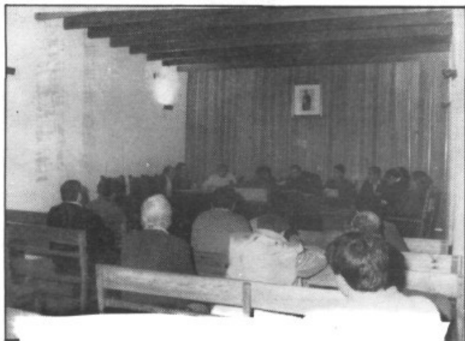
EL PUBLIC SORTI ENFADAT AMB EL BATLE.