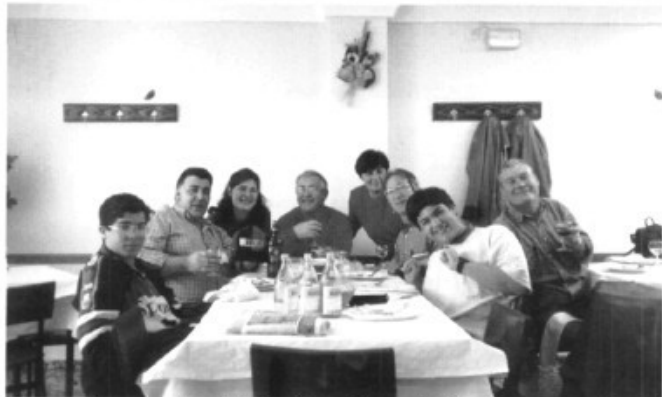
Més aventurers d'Es Pont d'Inca Nou a la final de copa del rei d'Espanya a València.