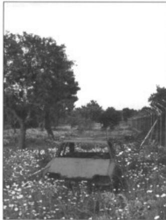
Son Bielo, un cas

En sabeu res de tot això, a Marratxí? Aquí, Marratxí es mou a cops de la música que dicten els urbanitzadors. Si es pensàs en el futur, la política i la nostra mentalitat haurien d'entendre, d'una vegada, que no podem fer la mateixa política d'afegir asfalt i xaletets "preciosos" per tot el territori, ni tan sols a una mica més del territori. Ara, l'estructura urbana de Marratxí és caòtica. No hi ha manera