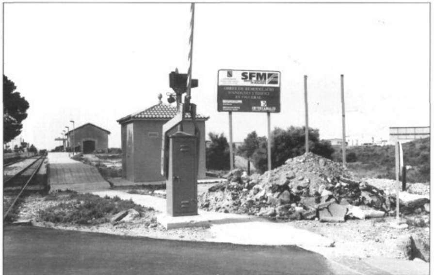
B.- Fotos: VS / BMM