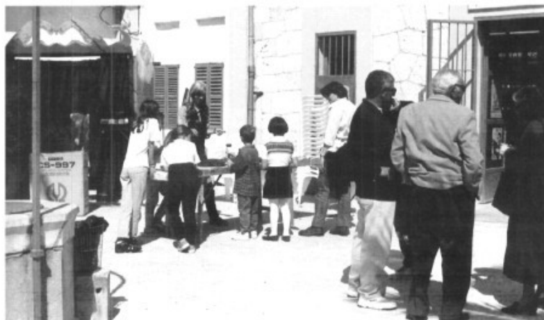
dos moments de la Diada del Llibre a la Biblioteca pública d'Es Pont d'Inca

Pòrtol (CPC Costa i Llobera): dilluns, dimarts i dijous de 8:30 a 14:30 hores.