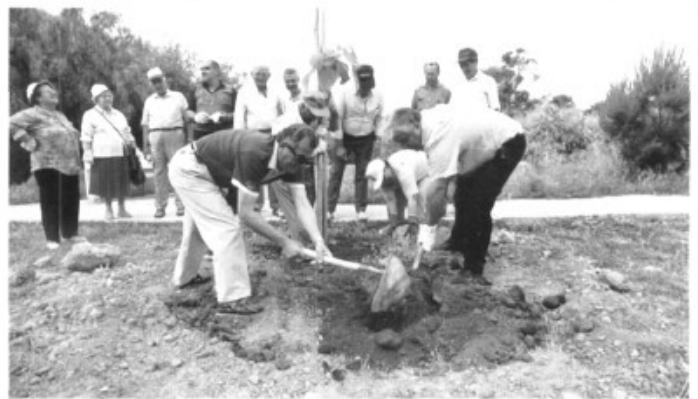
Els batlles suaren una miqueta el dia del Medi Ambient sembrant un arbre. El GOB diria que es tracta d'accions aïllades...