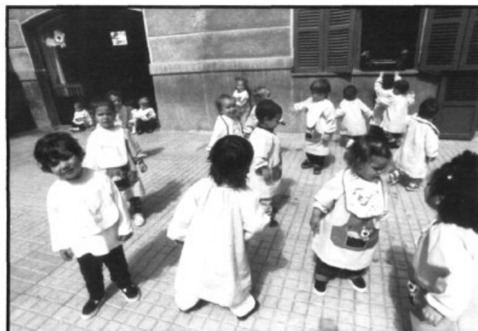
Jugant a l'Escoleta

Monitors nacionals inicien classes de tennis per a grups reduïts de nins i adults al poliesportiu d'es Garrovers, els dissabtes i diumenges de 17 a 19 hores.