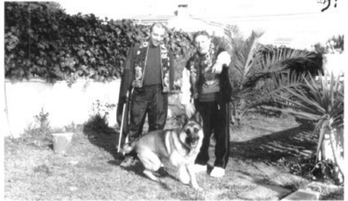
Els dos Xiscos d'Es Pont d'Inca Nou just abans de partir amb el Mallorqueta cap a València.