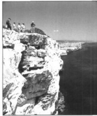
Els cabaneters a les Cales de Manacor amb Vicenç Sastre.

Envia'ns la foto que vulguis o posa't en contacte amb la redacció de Pòrtula .