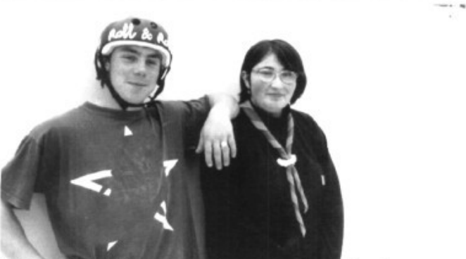
N'Aina de sa Cabaneta amb un amic seu patinador.