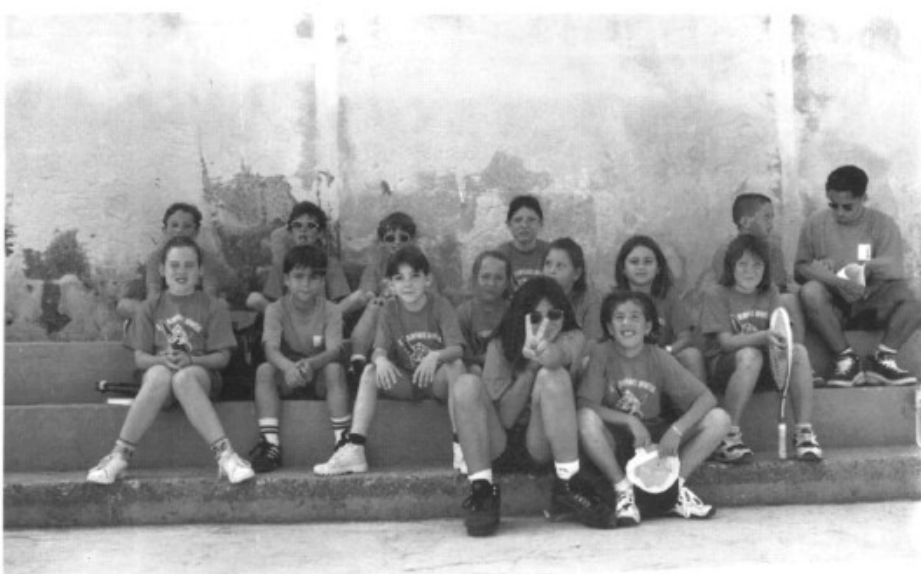
Participants a les Jornades de l'any passat