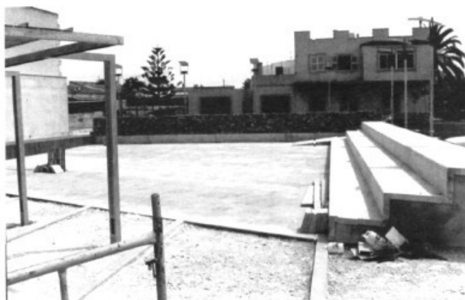
Massa ciment i poca integració a l'entorn

satisfets d'haver recuperat un espai i un topònim, Can Flor, per al poble. Ara només queda disfrutar-la i que a través de les vivències pròpies de cadascun, cada dia la fem més nostra."