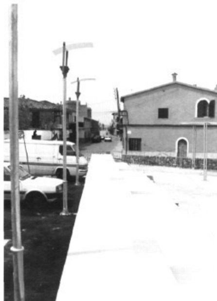
La divisió entre plaça i aparcament, l'altària de les grades i els fanals, motiu de polèmica.

Hi seríem a temps, encara, de regalar-nos una plaça major per a Pòrtol? Un gran espai per passejar i prendre el sol i la lluna? A ses Rotes, per ventura? Tanmateix, la cara dels nostres polítics mira cap a altres "miralls".