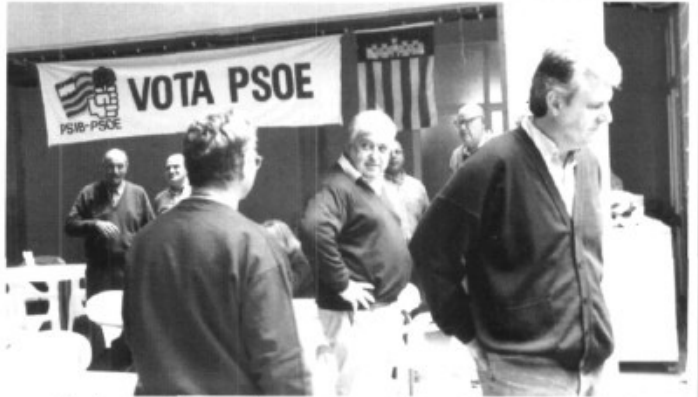
Equivocació o prèviess? Dia 1 de maig, a la paellada que organitzà el PSOE una pancarta ja demanava el vot...