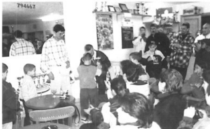
Lliurament de trofeus del Torneig Reis '98

El passat dissabte 3 de gener tingué lloc el tradicional Torneig de Reis a les instal·lacions esportives municipals de Sa Cabana, torneig organitzat una vegada més pel club esportiu APA Es Siurell.