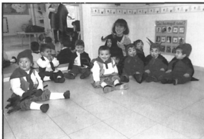
Preparant Sant Antoni

Tindrà lloc el dia 15 de febrer a les 16 hores. Si hi voleu prendre part ho heu de comunicar abans de dia 10 de febrer a l'Àrea de Cultura i Educació de l'Ajuntament (tels.: 797624-83).