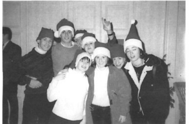
Celebrant les festes