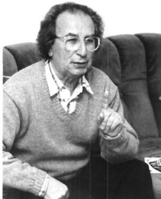
Contundent i segur de les seves opinions

No consider que jo digui res d'especial. Qualsevol que estigui mínimament al dia pel que fa als estudis de la Sagrada Escripura dirà les coses que jo dic, però crec que hi ha un detall significatiu, a mi m'ha enriquit molt el contacte amb la marginació. Quan el 1979 vaig anar a Es Jonquet, a Palma, la presa de contacte amb el món gitano, el problema de la vivenda, el problema de la droga, m'ho capgirà tot; després, el 1980 vaig conèixer