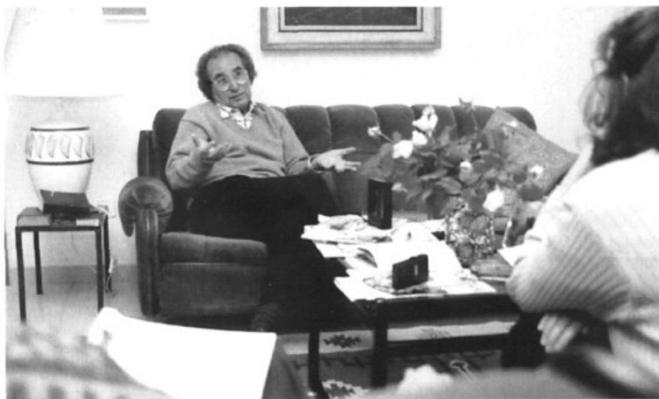
De tant en tant li surt la rebel·lia interior...