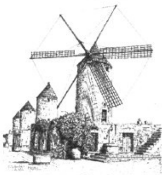
IL·LUSTRACIONS DE VICENÇ SASTRE

característics trets a què ens té acostumat el polifacètic artista que ens comentava que li sabia greu no haver-n'hi pogut incloure cap de Marratxí. Tranquil, en una altra ocasió hi dedicarem tot el calendari.