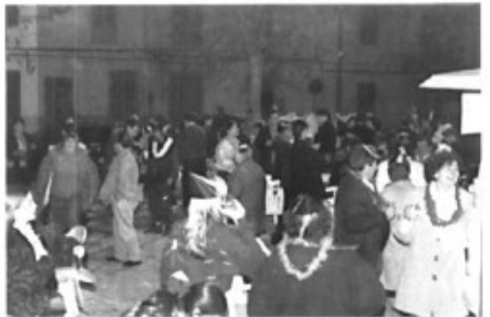
Festa i bauxa a la plaça durant la nit de cap d'any

El passat Cap d'Any els veïns d'Es Pont d'Inca sortiren a la plaça per acomiadar l'any 97 i rebre el 98 amb cava i alegria. Aquest és el primer any que se celebra i la impressió que tenim tots és positiva perquè ens reunirem