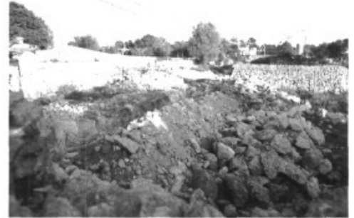
Son Verí, la destrucció per tot arreu

Podeu estar segurs que aquest és l'únic present que els Reis d'Orient poden haver deixat a l'equip de Govern. Per la seva ineptitud i per la seva incapacitat en temes d'infraestructures, en temes de medi ambient i en temes d'urbanisme. Els ciutadans de Marratxí n'estam farts de denunciar atrocitats i malifetes contra el nostre terme. La darrera, comesa fa cosa d'un mes per l'empresa encarregada d'encimentar la pleta de Son Verí (FCC per més senyes), ha estat la destrucció de la bassa picada a la roca entre els sestadors i la carretera.