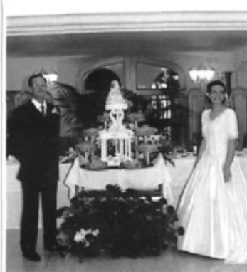
En Tassar i na Malen es casaren a St Marçal dia 14 de desembre.