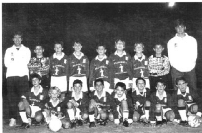
L'equip aleví futbol-7 d'Es Liceu lidera les puntuacions globals dels equips marratxiners.

Dia 17 a les 21:30 h ..... Alien Resurrección Dia 18 a les 17 h ..... Alien Resurrección Dia 24 a les 21:30 h .... La Salchicha Peleona Dia 25 a les 17 h ..... La Salchicha Peleona Dia 31 a les 21:30 h ..... Conspiración Dia 1 de febrer a les 17 h ..... Conspiración