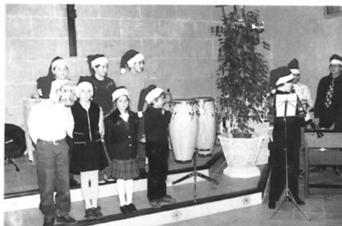
La coral dels més joves