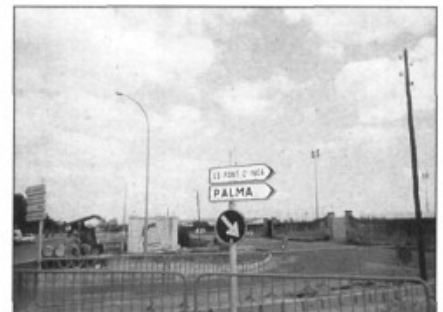
Reforma al Pont d'Inca Nou