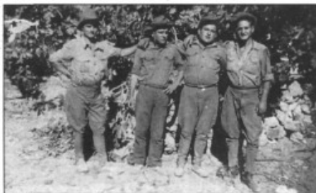
Al front de Teruel amb un d'Algaida, un de Lloret i un de Sineu. Ell és el segon de l'esquerra

I això es vera, m'escoltes bé? Cantàvem lo que passava en aquell temps. Parlàvem d'anar a sa guerra, de si havíem