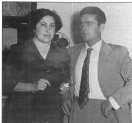
Amb la seva esposa Francisca quan encara festejaven

resulta que és qui comandava va dir que aquí érem tots bons al-lots, i amb una paraula que a Pòrtol dolent no n'hi havia cap, de dolent. A Pòrtol sempre hi ha hagut bona gent. Aquí hi havia ses societats de monos i de culers i cançons sí que en férem. Només me recorda d'una que deia: