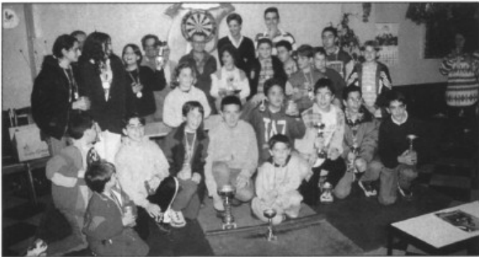
Els participants al torneig de Pasqua d'escacs