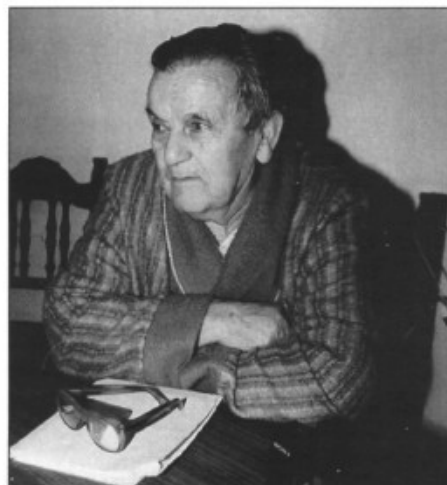
Avui, quasi als vuitanta anys

El món dona voltes, això de ses gloses pot ser com es ball de bot, que primer havia com a descomparegut i ara va davant. I ara si aquests joves que han