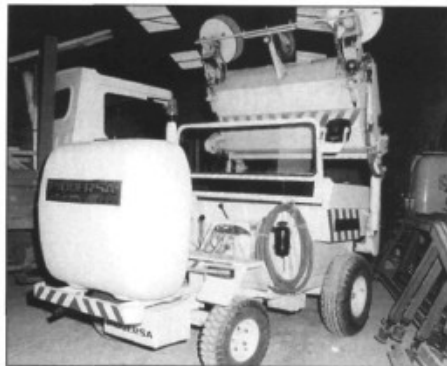
Una de les actuals agradores

La gestió directa de la recollida de fems representarà un estalvi a les arques municipals d'un 9 a un 20%, però aquesta rebaixa no se veurà reflectida al rebut que paguen els ciutadans, ja que continua-