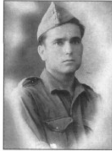
El temps del servici

«Pentura qualche castell haurem d'anar a bombejar però no vos heu d'assustar per poder-mos defensar menam en Verga i el Rei».