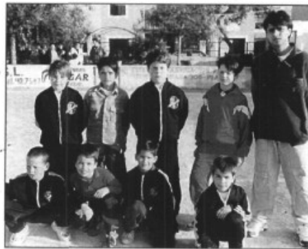
Escola futbol Sporting Sant Marçal