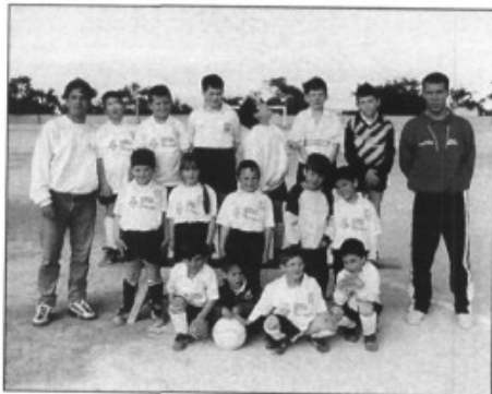
Escola futbol U.E. Pla Na Tesa

En aquest torneig hi han participat els equips Penya Arraval, Sporting Sant Marçal, Patronat, U.E. Pla de na Tesa, Coll d'en Rabassa, Son Cladera, Soledat, Independiente, Sa Vileta i APA Miquel Porcel, en distintes categories des de l'escola de futbol a Cadets.