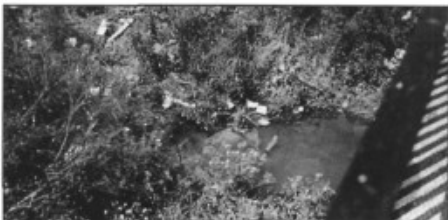
El torrent Coanegra al seu pas pel Pont d'Inca nou

Dia 12 es va fer la neteja de part del torrent de Coanegra, amb la crítica dels