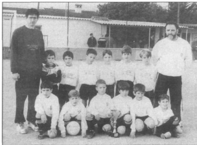
El Pla de Na Tesa pre-benjamin

El Pla de na Tesa que juga al Grup G va guanyar al Solllerenc per 6-1 i a dins Bunyola per golejada ni més ni manco que 1-11, ocupant el quart lloc de la classificació.