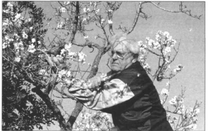
La collita, la primera passa

cuiden amb seny la matèria primera. Per collir han d'haver sembrat i ells es cuiden de renovar els arbres. Enguany han sembrat una sèrie d'ametlers de varietat especial per tal d'amillorar el producte. Des de fa anys guarden les espècies antigues mallorquines perquè -mirau per on- les forasteres no tenen perfum. Es cuiden d'empeltar les diferents varietats característiques de l'Illa, de les quals en coneixen més de 130. Rotleta, d'en Pons, florencina, des Llombards... són alguns dels noms presos de l'empeltador, de la forma o del lloc que vegé la primera varietat.