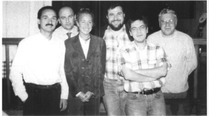
Els representants de la premsa local, escrita i parlada, durant la presentació de la Fira del Fang.