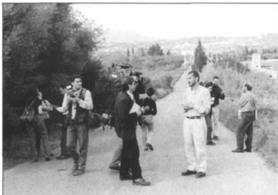
El GOB informant els mitjans de comunicació sobre el terreny, a la carretera de Marratxinet