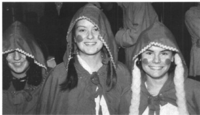
Tres agudes caputxetes vermelles que no tenien por del llop durant la Rua de Marratxí.