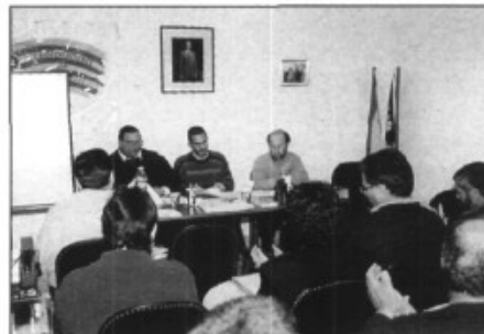
Un moment de la presentació del GOB a la seu dels Independents

El fet decisiu que animà un grup de socis i sòcies a constituir la delegació fou la revisió de les normes subsidiàries (NNSS) que l'ajuntament està duent a terme actualment. És un tema que pel seu abast i transcendència determinarà el futur de la terra i la natura a Marratxí. Una vegada més, l'urbanisme en el punt de mira ecologista.