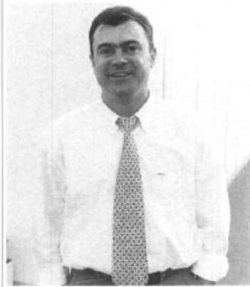
Ja va sortir, però és que veure en Tolo amb corbata és massa!

... tu també hi pots sortir! Envia'ns la foto que vulguis o posa't en contacte amb la redacció de Pòrtula .