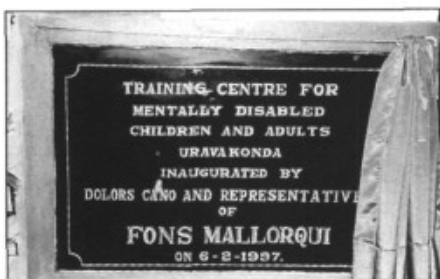
El testimoni de la presència mallorquina

Idò, precisament en aquesta regió fa uns 20 anys va arribar en Vicenç Ferrer i amb la col·laboració d'un grapat d'estudiants ha aconseguit crear unes 300 escoles, 40 tallers de formació professional, 3 hospitals, 5 dispensaris, tallers de rehabilitació i ortopedia, plantació de més de 2 milions d'arbres, 4000 pous, 240 embassaments i el que és més important, que una regió totalment degradada comenci a mirar el seu futur amb esperança.