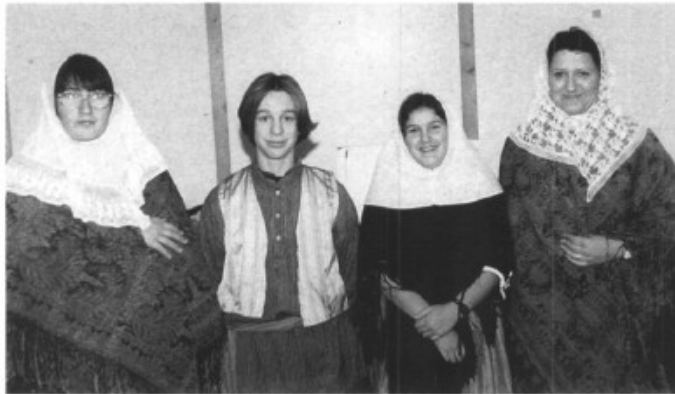
Quatre cabaneters preparats per fer de pastors a la comèdia dels Reis.