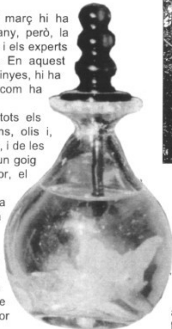
El producte final, l'essència