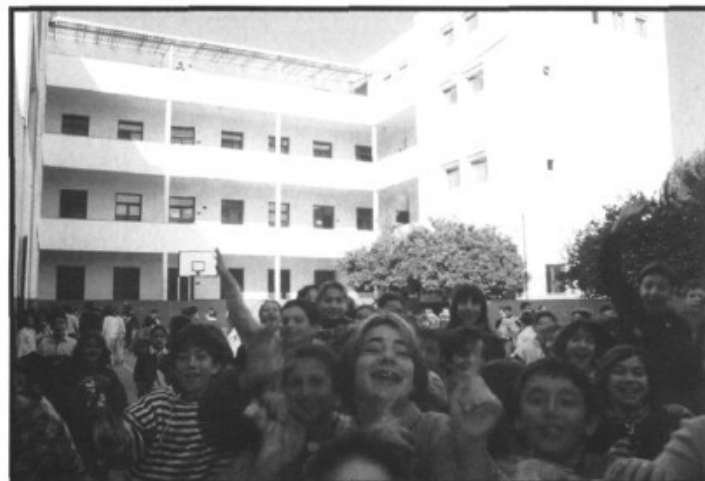
Tothom vol sortir a la foto, encantats

Dia 19 d'abril al Col·legi Costa i Llobera de Pòrtol.