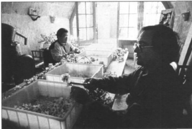
La selecció a can Baix Sol

Per seguir parlant de la resta del procés fins arribar a la quintaessència de la flor més característica de Mallorca envasada quedam citats per a una propera ocasió.