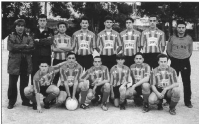
C.D. Marratxí líder de la categoria

Dins el grup B de la segona Divisió hi tenim dos representants, l'Sporting Sant Marçal i l'U.E. Es Pla de na Tesa. Els resultats de la darrera quinzena varen ésser Pla de na Tesa 0 Génova 2; Son Ferrer 2 Sporting Sant Marçal 1; Calvià 4 Pla de na Tesa 1 i Sporting Sant Marçal 2 Ferriolenc 1. L'Sporting Sant Marçal ocupa un dels llocs alts de la taula, però enfora de les opcions d'ascens, mentre que el Pla de na Tesa ocupa el tercer lloc per la cua.