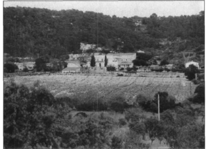
La possessió de son Cós