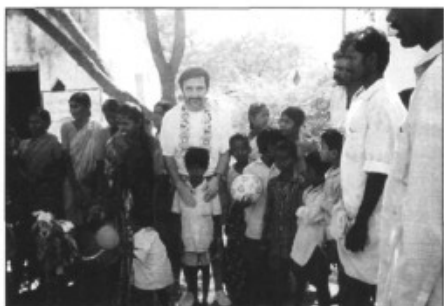
Grup d'hindús, dones amb sari i cabres

Vàrem esser vint-i-dues persones de tot Mallorca que, convidats per la Fundació "Vicenç Ferrer", partírem a veure la tasca que aquesta Associació duu a terme a Anantapur, regió situada al sud de l'Índia, d'una extensió com dues vegades Mallorca, d'un milió d'habitants, integrats principalment per persones de la casta "pària" o "intocables" considerada a l'Índia com la més baixa de totes; una zona quasi desèrtica, la més pobre del país.