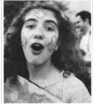
Na Magdalena estava així de divertida a la passada Rua.