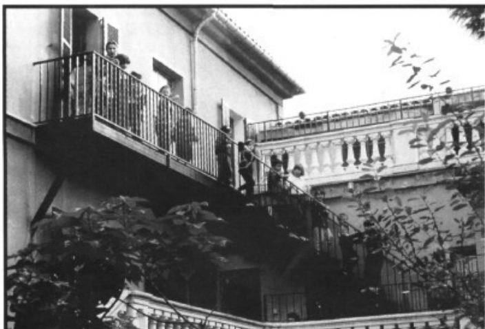
Una raconada d'Educació Infantil

Del Gorg Blau a Mancor, 3'5 h. de camí, excursió organitzada per l'A. de V. de Sa Cabaneta. Diumenge, 23 de març. Sortida a les 9 h. de la plaça de l'Ajuntament.