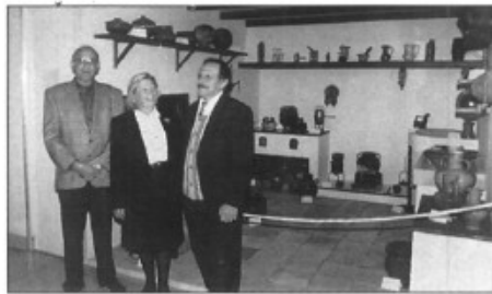
La cuina antiga i els seus creadors

En total han estat seixanta-vuit parades que han estat presents a l'actual edició.