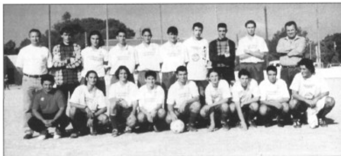
Sporting St Marçal, juvenils Zona regional

Aquesta és una qüestió molt interessant. Pens que haurien de venir més els pares, ja que no tots vénen. Quan els al·lots tenen una edat de dotze o tretze anys, els pares els solen deixar tots sols i els al·lots ho noten, això. Pensau que els al·lots, quan juguen un partit, si saben que hi ha els pares a les graderies estan més contents i reaccionen millor. Els pares ens ajuden, perquè ens fan les aportacions econòmiques; vull deixar clar, idò, que col·laboren quan els ho demanam. Els acompanyen i els vénen a cercar, però no se solen quedar a veure els partits. S'ha de tenir en compte que la il·lusió dels al·lots és veure son