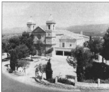
Una font de problemes per als pladenatesers

Les queixes també són pel renou dels vehicles de gran tonatge que passen a tota hora del dia i de la nit per dins el nucli.