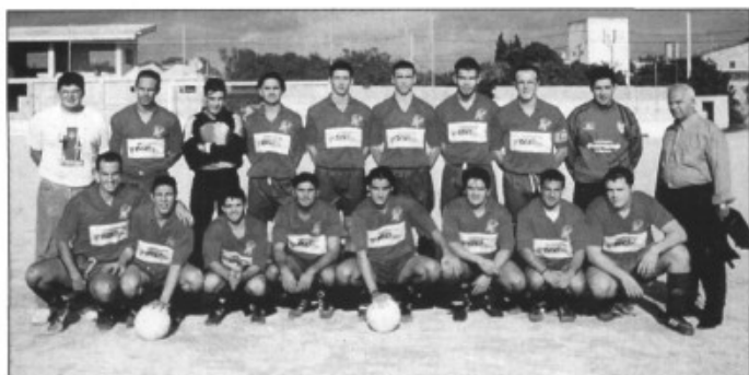
Sporting St Marçal, amateurs 3era regional