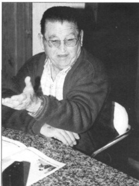
Avui en dia, mentre ens explica les seves vivències

Jo no el vaig conèixer però mon pare me va parlar molt d'ell. Estava a una possessió per devers s'Indieteria i estava allà llogat de pastor, a l'amo li devia agradar molt es teatre perquè segons em va contar mon pare aquell pensava i no la podia escriure i llavors es vespre l'amo escrivia, els hi devia agradar a tots dos, perquè l'èxit és de tots dos, perquè si a l'amo no li hagués agradat li hagués dit "au, a fer punyetes". No tenim cap d'aquestes obres.