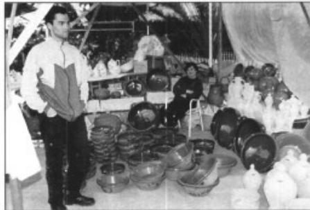
Sa Penya, premi a la producció més artesanal

Una de les coses més criticades pels visitants consultats va ésser que els expositors posaven més interès en la parada de defora que no en la de dedins, i els pareixia que el que va començar com una fira per donar a conèixer una artesanía a poc a poc esdevenia una "fira" de venda de material de fang.