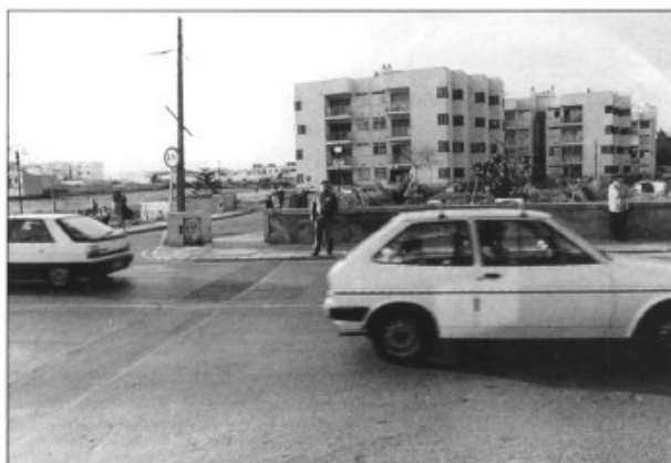
Per aquest cap de cantó amb la carretera d'Inca els veïnats reclamen un semàfor; al fons, els edificis de "Las Acacias"

Actualment, com ja hem dit, el problema més greu que tenim és el del pas zebra que hi ha a l'entrada del municipi. Volem que ens posin un semàfor. Estam fent una campanya de recollida de firmes i ja en tenim més de set-centes. A part de l'associació també en recullen el president de l'APA de La Salle i l'Associació de Veïnats des Pont d'Inca per fer la petició d'aquest semàfor per sortir del carrer Francesc Salvà. Sortir d'aquest carrer és una cosa molt difícil, ja que hi ha molt de trànsit.