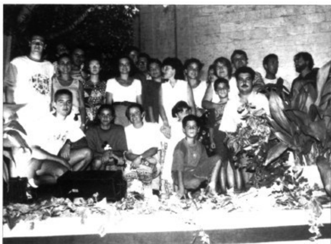
El grup Aires des Pla