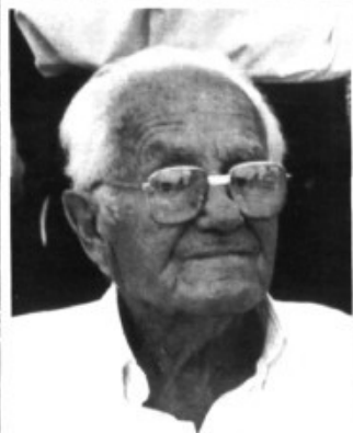
L'home de més edat del Pla de na Tesa, homenatjat.