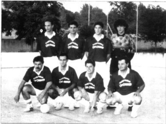
Fusteria Cas Cabrer