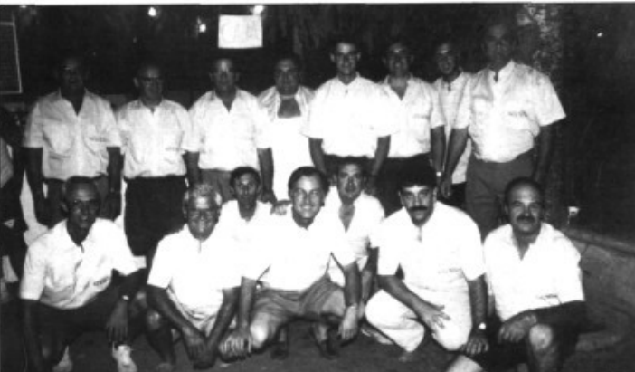
Els organitzadors de les festes del Pla de na Tesa