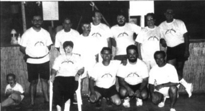
Els organitzadors de les festes del Pont d'Inca

Encara no sou subscriptor de Pòrtula ? Contactau-hi a través dels telèfons 79 78 70 / 60 31 44.