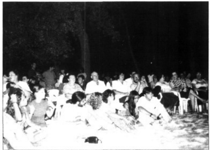
Els assistents, a la fresca

"Del pinar de Son Caulelles vora el poble portolà canta les cançons més belles que l'estimat li ensenyà"