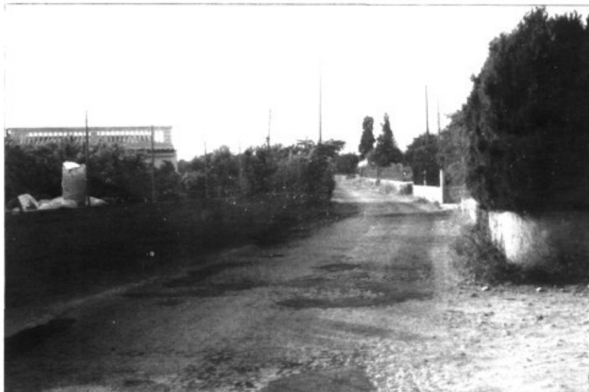
El camí de sa Fita, al Pla de Son Nebot, entre la carretera vella de Bunyola i la de Sóller arriba fins a son Reus.