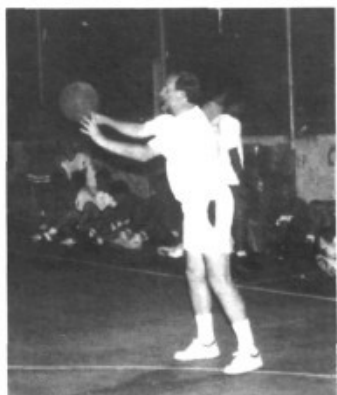
El rector del Pla de na Tesa també participà a les 24 hores.