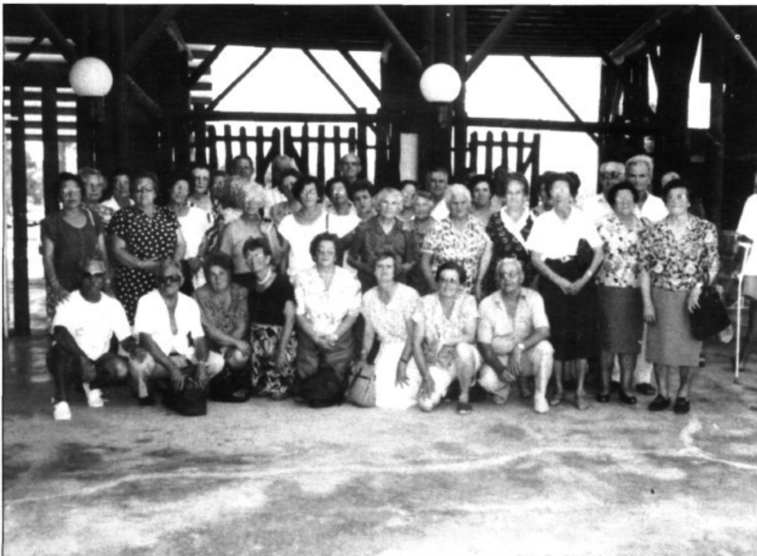
Una de les excursions de l'Associació

A.C.-Mos presentarem 18 socis. A cada un dels altres socis els donarem una llista dels que s'havien presentat i ells votaven als 4 que volien.