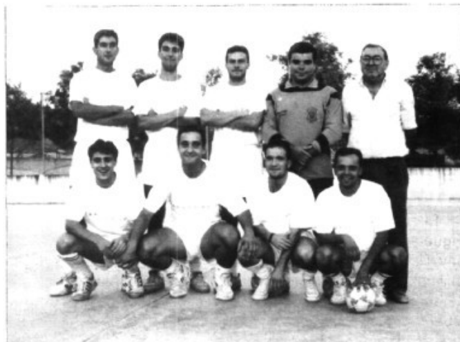
Equip campió, Bar can Baló

Hem de senyalar que a més a més dels cursos infantils es dugueren a terme uns cursets per a la gent major del terme i durant el mes d'agost un per a infants menors de quatre anys.