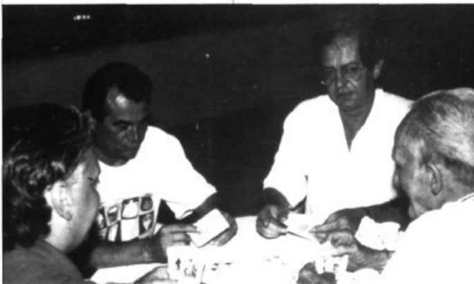
Un moment del campionat de truc a les passades festes del Figueral