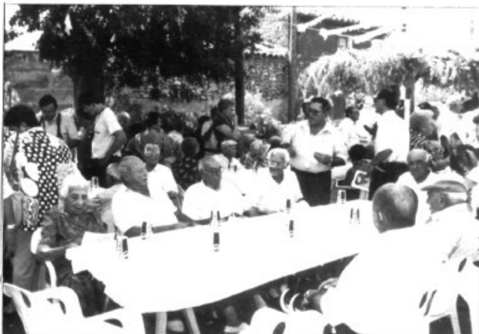
L'homenatge a la tercera edat

1777 a 1546, i és que enguany la lluna els va acompanyar.