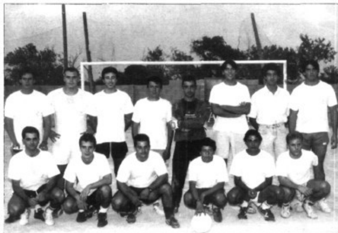
L'equip dels fadrins

El divendres fou un dia màgic. A la tarda una espectacular serp multicolor (això ho diuen els de Tele 5 al Giro) giravoltava