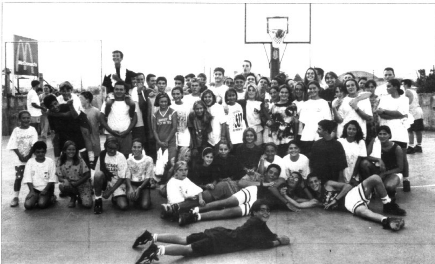
Els participants a les 24 h. de bàsquet