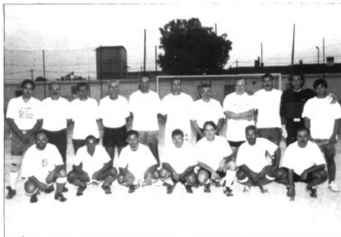
L'equip dels casats

pel poble. Joves i no tant joves muntats a les seves màquines infernals i precedits per la policia recorregueren el poble competint amb imaginaris Indurains. A l'arribada berenar, i és