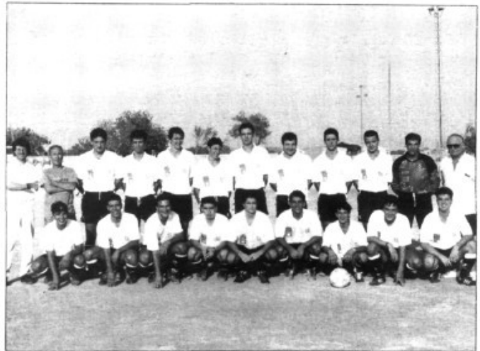
U.E. Pla, nou equip de segona regional