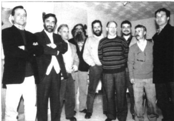
Els components de la Federació d'AA.VV.

REUNIÓ DE LA FEDERACIÓ DE VEÏNATS DE MARRATXÍ AMB EL PRESIDENT D'E.M.A.Y.A.