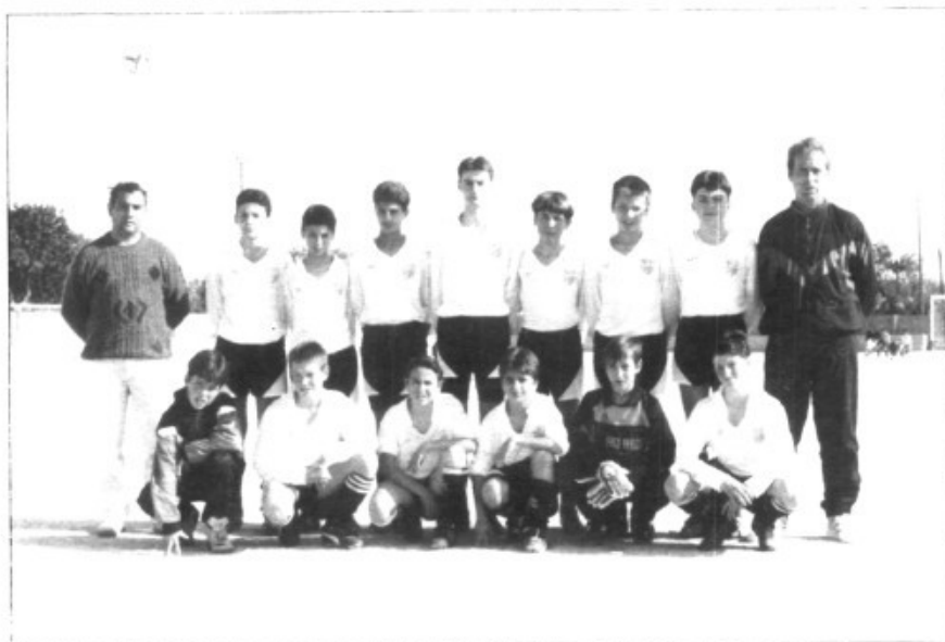
L'EQUIP DELS INFANTILS