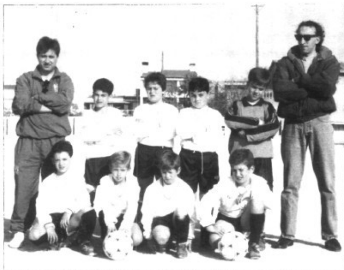
L'EQUIP DE FUTBOL SET

Per acabar dir que el proper dia 17 de juny es farà el sopar fi de temporada, aquest sopar es farà al mateix camp de futbol i serà de pinyol vermell pel mòdic preu de 1500 pessetes. Més informació al telefon 600653. No hi falteu.