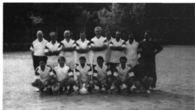
Arreplegats dels Garrovers per al partit de Lluc