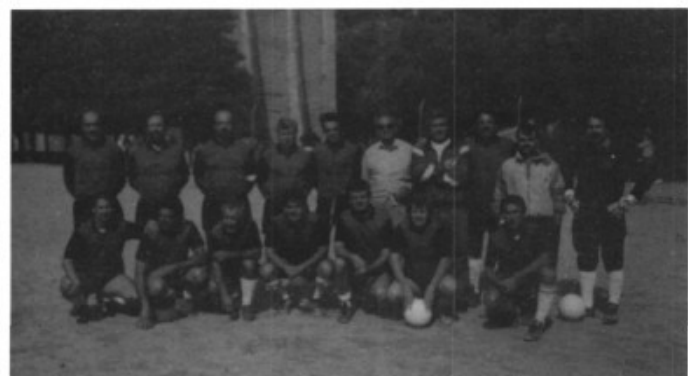
Arreplegats de sa Cabaneta a la Diada de Marratxi a Lluc