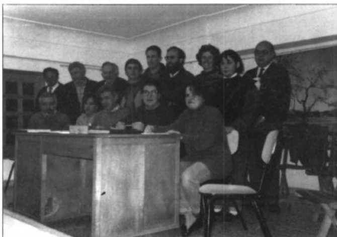
La junta de l'associació de veïnats de sa Cabaneta