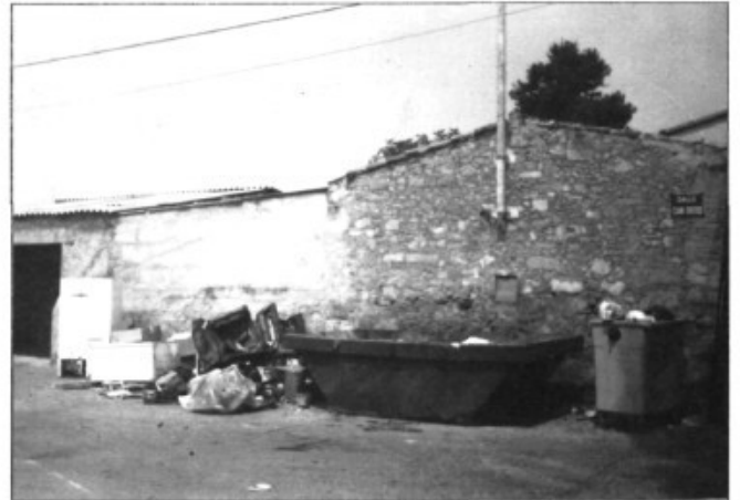
El mateix cantó després de buidar el gran contenidor

Les conseqüències de tot això són clares: a l'estiu, la pudor de la brutícia atreu cans, moixos i fins i tot rates; a l'hivern, a més d'animals, el vent escampa els papers i coses més lleugeres i, si plou, l'aigua se'n duu tot quant troba. A part de la qüestió bàsica