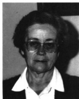
La nova superiora de les franciscanes de Pòrtol