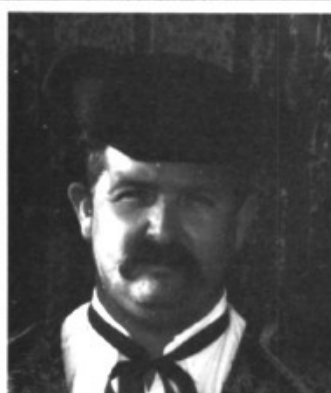
El torero del Figueral, un primer espasa de les festes