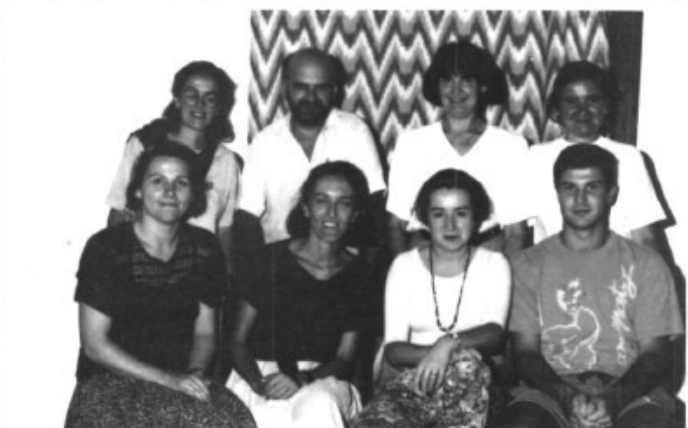
Els catequistes del Pla de na Tesa amb l'ex rector