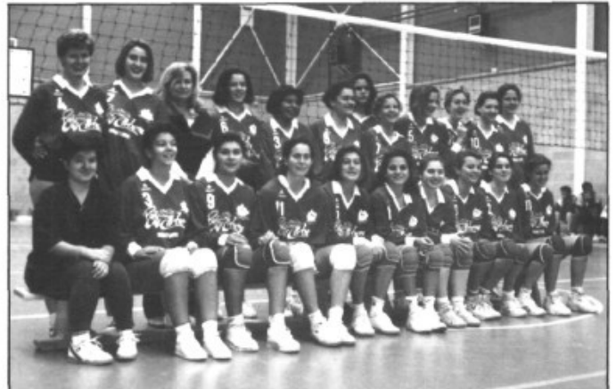
L'equip absolut i cadets del nou club Voleibol Pòrtol