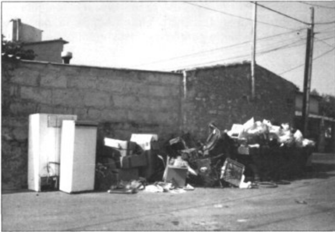
A can Diego la brutor ocupa tot l'espai possible

A la confluència del Pont d'Inca amb el Pla de na Tesa -encara ara carrer del general Franco i carrer del general Mola- hi ha la barriada de Sant Llatzet. Com arreu de Marratxí, durant els últims anys s'hi ha produït un considerable augment de població que, inevitablement, ha transformat la fesomia del redol i la vida dels veïnats. Els canvis que comporta l'increment de cases i de gent són de tots coneguts: més cotxes, més renou, menys aigua... més fems.