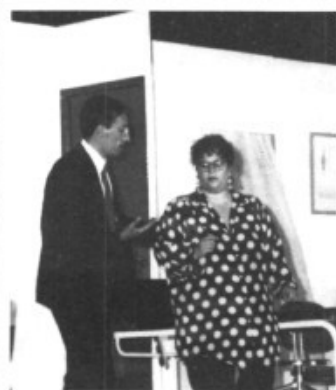
Dos bons actors, en Mateu i na Tita, del Taller de sa Cabaneta