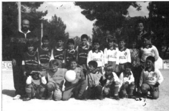
L'escola de futbol de l'Sp. St Marçal