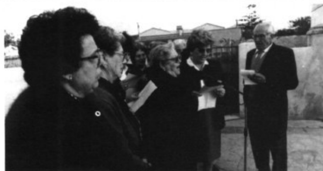
Un grup improvisat de cantadores i cantador de l'Associació de la Tercera edat de sa Cabaneta