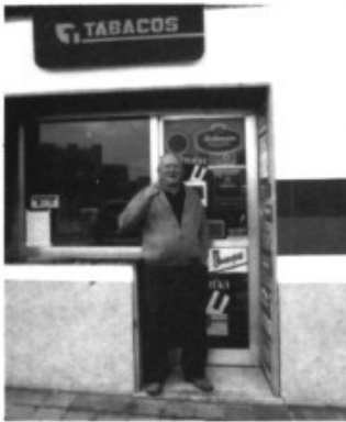
L'amo en Joan de can Crosta no perd mai el bon humor