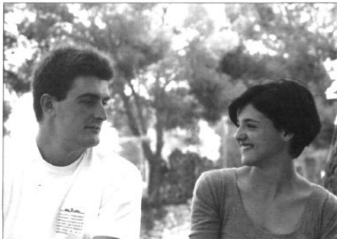
L'entrevistat i l'entrevistadora

El primer any érem pocs. De monitors vàrem començar na Petrina, en Miquel Canyelles, que va ser el primer responsable oficial, na Cristina, n'Antònia Ramis, na Polita, na Margalida Sales, n'Antònia Jaume, i jo. Teníem unatrentena d'al·lots poc més o manco. Encara que cap de nosaltres teníem gens d'experiència vàrem aconseguir funcionar tot l'any amb 5.000 ptas. utilitzant el vell sistema del reciclatge de materials.