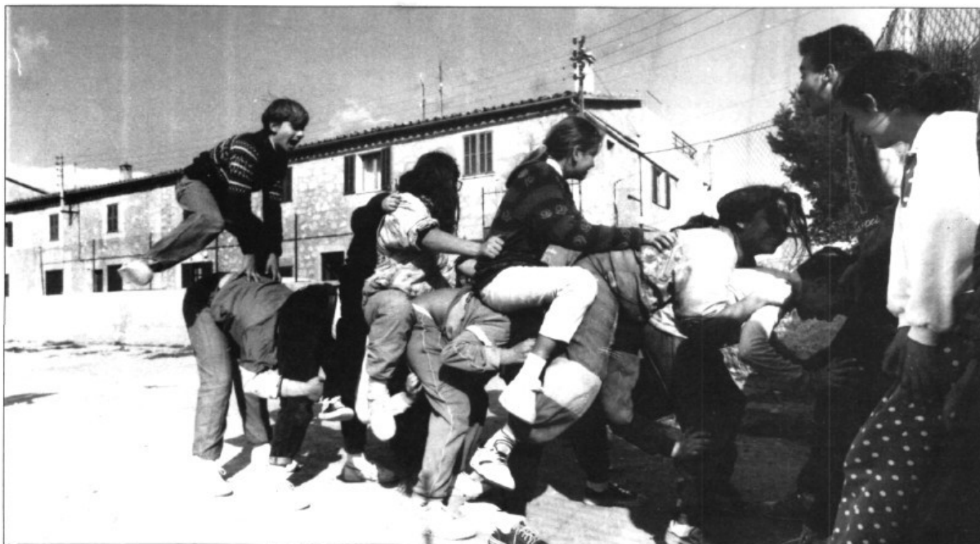
Activitats en Es Campet un dissabte qualsevol

Sí. Inclús actualment hem arribat a una situació complicada. Correm el perill de caure en una inèrcia. Tenim la sensació que hem arribat al màxim i que és molt difícil superar-nos.