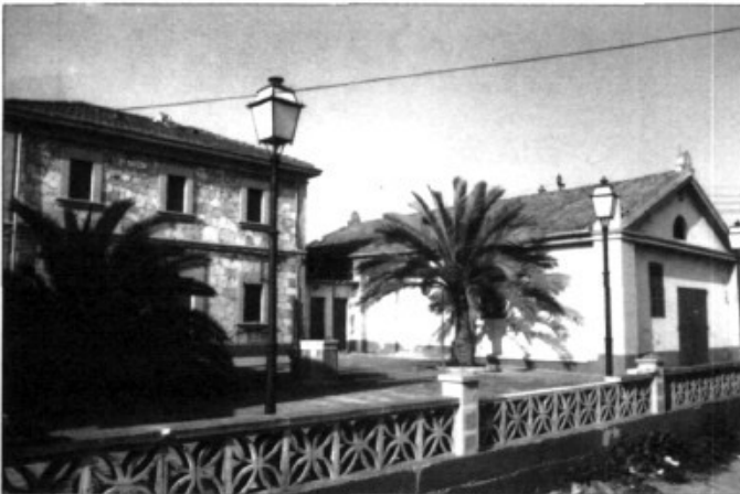
L'estació del Pont d'Inca

El centre de B.U.P. tenia prevista la seva construcció dins Es Figueral, i més concretament dins la urbanització de "Es Caülls", però l'Ajuntament ha decidit canviar el solar i oferir-ne al M.E.C. un dins Son Ramonell. Els motius exposats per l'equip de Govern són que els terrenys ja tenen la qualificació que pertoca per aquest tipus de construcció. El solar té una extensió de 12.023 m 2 i està situat a prop del Centre de Salut.