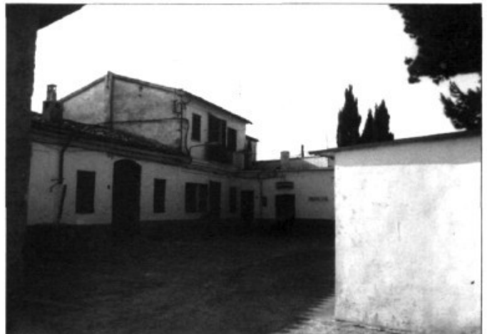
L'actual "Casa-Cuartel" al Pont d'Inca