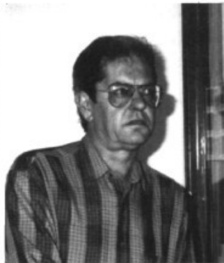
L'administració de loteries del Pont d'Inca repartí bons premis