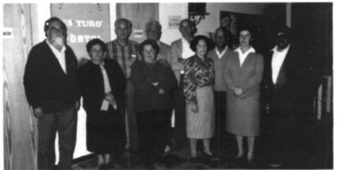
Junta directiva de l'Associació "Es Turó" de Pòrtol