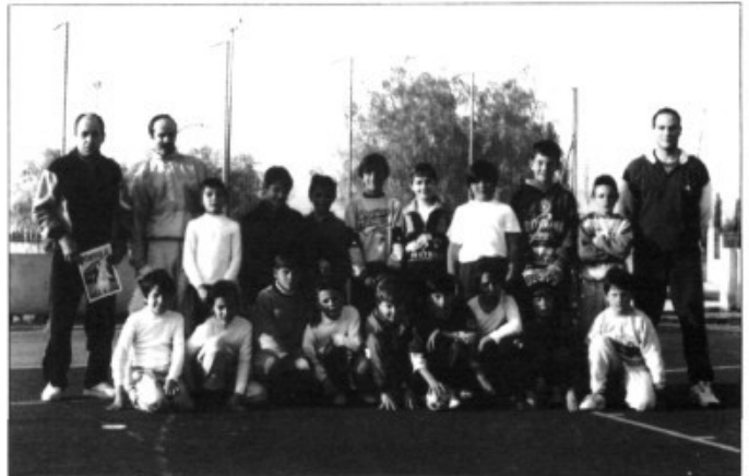
Unió Esportiva sa Cabana de futbol sala

Aquest equip disputa els partits de camp propi dins les pistes del polisportiu can Farineta. Encara ha de jugar dia 6 d'octubre contra Santa Maria, dia 13 X contra Binissalem, dia 8 XI contra