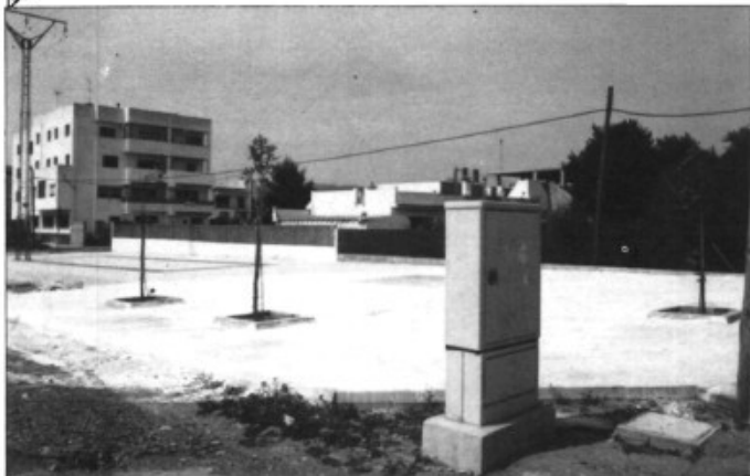
La nova placeta del Figueral