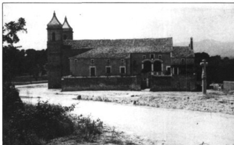
Sant Marçal, 1930