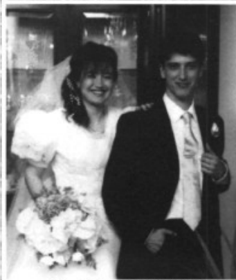
En Julià de ca n'Agustí de sa Cabaneta també es casà.