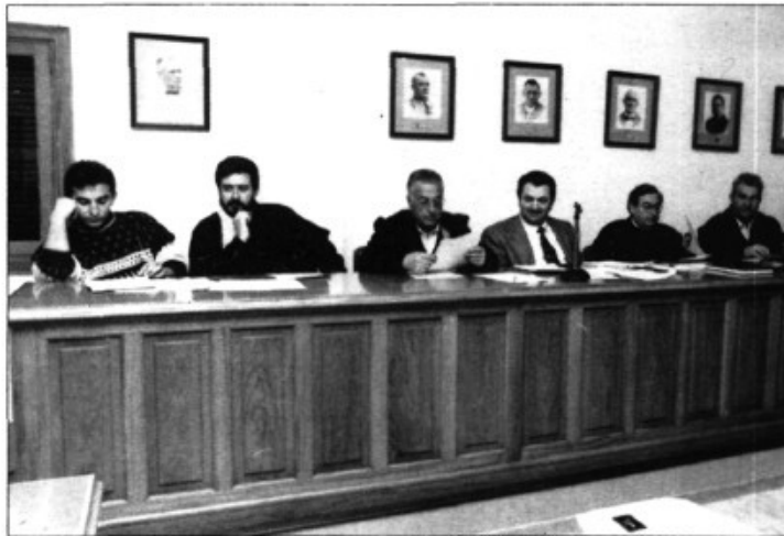
La coalició PPUM

El mes de març del present any el batle Miquel Bestard va signar un conveni de lloguer d'uns locals propietat de "La Caixa" al carrer Antoni Maura del Pont d'Inca, per destinar-los a activitats socio- culturals i més concretament per a les mestresses de casa d'aquest nucli de població. El conveni havia d'esser ratificat per l'Ajuntament en ple.