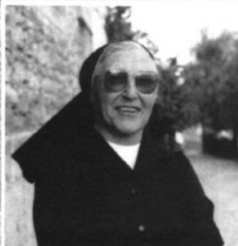
Sor Rosa envia moltes memòries des de l'Horta.