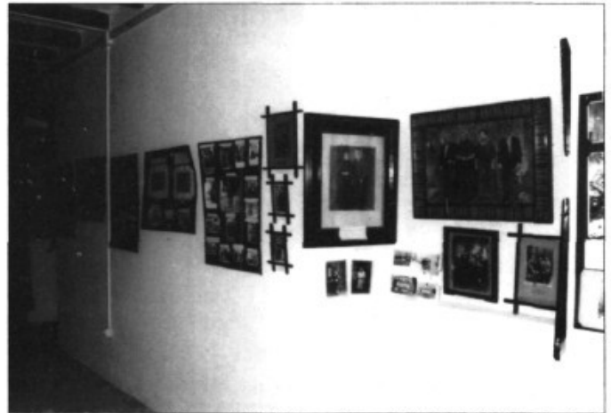
L'exposició de fotos antigues al Pla

Del 13 al 22 d'agost Es pla de na Tesa va celebrar les seves festes patronals. Enguany les festes varen esser un petit homenatge a Toni Vidal, que formava part de l'organització feia molts d'anys i que va morir el passat mes de gener.