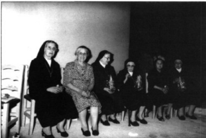
Les monges homenatjades