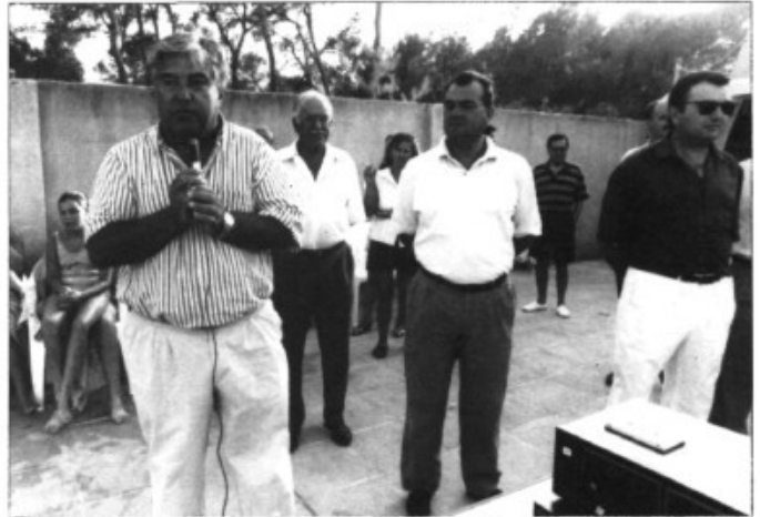
L'acte d'inauguració

la seva ja tradicional excursió al torrent de Parells. Foren prop de seixanta les persones que varen fer el trajecte per dins el torrent, ara camin, ara bot, ara davall, i així durant prop de quatre hores, guiats tots ells per Jordi Cloquell "Costella". Un pic arribats a Sa Calobra es va fer un dinar a un Restaurant de la zona, i fins l'any vinent.