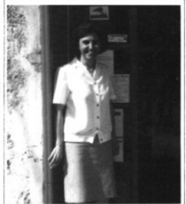
Na Bel de can Ros se'n cuida de la sabateria de Pòrtol.